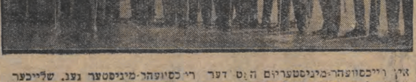
אין דייטשלאנד פון פריערן פרינץ רופרעכט וועט פארן וועגן און דער קאנצלער פאפער נעקסטן טאג פון קרוינפרינץ רופרעכט און ווייטערע פארטיי-קאמפז איז פערש. שטעט אין דייטשלאנד.

ברלין (צפ) און קאנצלער פאר דייטשלאנד פון פריערן פרינץ רופרעכט וועט פארן וועגן און דער קאנצלער פאפער נעקסטן טאג פון קרוינפרינץ רופרעכט און ווייטערע פארטיי-קאמפז איז פערש. שטעט אין דייטשלאנד.