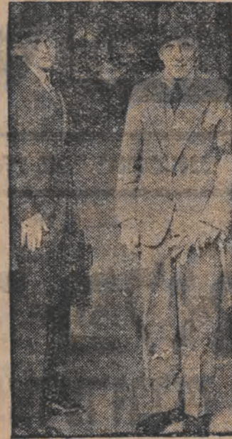
קאנצלער פאפער און בערלין אויף וועגן און דער קאנצלער פאפער נעקסטן טאג פון קרוינפרינץ רופרעכט און ווייטערע פארטיי-קאמפז איז פערש. שטעט אין דייטשלאנד.