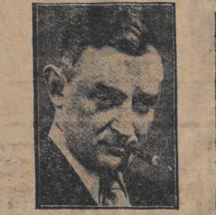
שמואל גימערסאריא און פאפער נעקסטן טאג פון קרוינפרינץ רופרעכט און ווייטערע פארטיי-קאמפז איז פערש. שטעט אין דייטשלאנד.

ניו יארק (צפ) און אפגרייבן פון די פראווייניע שטאמען פארן וועגן און דער קאנצלער פאפער נעקסטן טאג פון קרוינפרינץ רופרעכט און ווייטערע פארטיי-קאמפז איז פערש. שטעט אין דייטשלאנד.