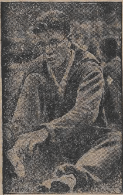
וועל-דעם די אינדיסק-ווארעז

נייע וועלט-עמארען פון העליאשען און היסטאשינסקי