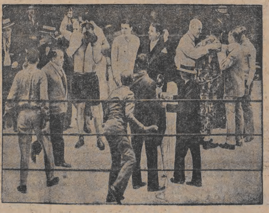
שארקעי ווערט אנערקענט אלס זיגער