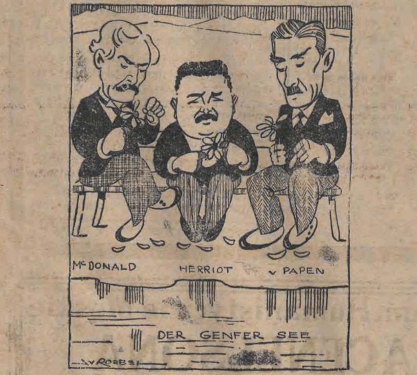
לאזאנער קאנפערענץ אין יאנואר 1933. דער דריטער פון לינקס איז פאפולאריז.