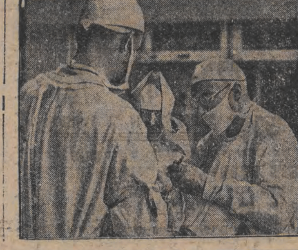
רעקארד פון א רעקארד

פיעמריהאוו (עלעמאניש) ווי בעוואוסט פיהרע די פיעמריהאוו בענעפיקערונג ווי א אייגענע דרשיס אן אקציע צו פערבלינגען דעם פרויז פון עלעקטריע. אין צוזאמענהאנג דערמיט, אויך די טעג פארענקען א פערזענלעך און