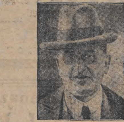
דאלמעטשער פון דער דייטשער דעלעגאציע אין גענען אומע-קומען פון א קאנסטראקט.