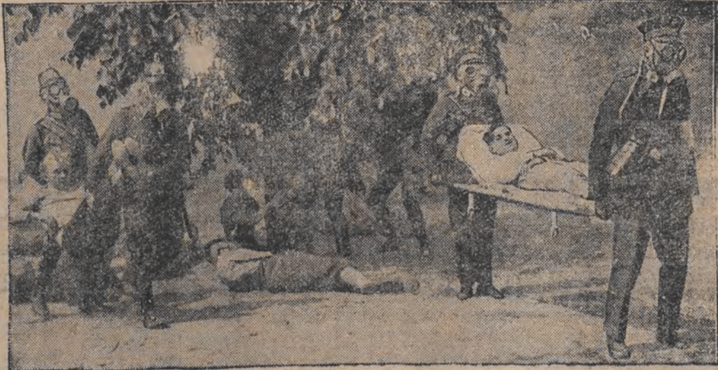
אין בערלין לערנען זיך סאנאטארע דאמעווען נאך א נאן-אנגריה