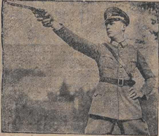
אויפן בילד זעהן מיר דעם זיגער פון קאנקורס