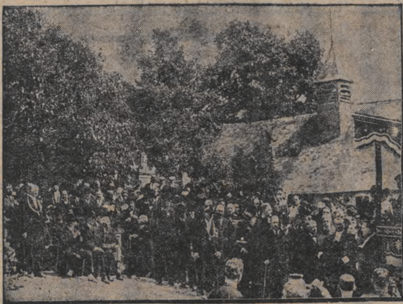
ווען ער זעהט מיין הערצליך האל (7) א ביינער רעדע