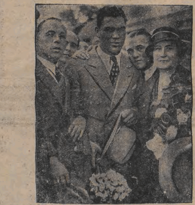
דער דייטשער באָקס מיינסטער מאַקס שמעלינג אהיימקומענדיג נאָך זיין מפלה אין נוי-יאָרק