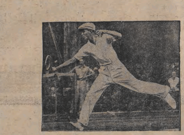
יונגער טעניס-וועלט- מייסטער