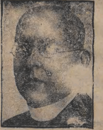
דער גרויסער עסטרייכער פרעמד-מיניסטער פאליקער זיפער