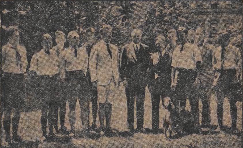
ענגלישע סקויטען-דעלעגאציע ביים פראוידענט היבער

די פארזען דער רעוועלוצאנס האט ענד גילטען געוואונען דעם בעלער פון ערשט פארעם. פופטיגום 1500 מאן.