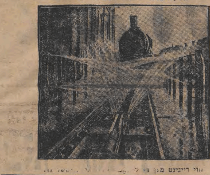
לאקאמאטיווען אונטער א טיש

כאאס איז דרום-אמעריקא; דער אויפשטאנד איז פראזיקלעז; איבערגעריסענע דיפלאמאטישע בעציהונגען צווישען ארגענטינא און אורוגוויי; קאמפען אויף דער פאליטישער-פאראגווייאער ער גרעניץ