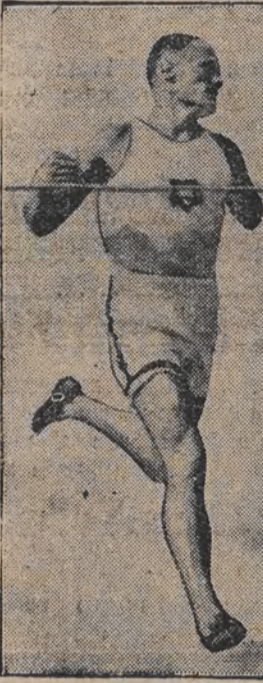
פרייע גלענצענדר מינלענדישער מייסטער 1500-מעטער-לויף

בעריהמעטע אויטלענדישע אנטוויקענעמער אין דער אלימפיאדע