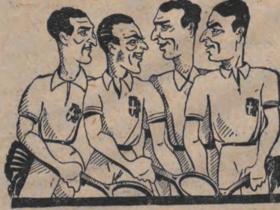
די איטאליאנישע קאמפער פארן דייזעלען בעכער

לינקס פונעם דייזעלען העכטער דער בערלינער אייז-האקעי נייסטער יענעקע