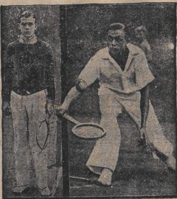
דער קאמף ארום דייזעלען בעכער

לינקס פונעם דייזעלען העכטער דער בערלינער אייז-האקעי נייסטער יענעקע