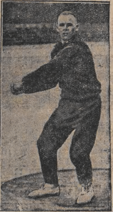
פער העלע בוזמער מינלען ישר מייסטער אין האמער-ווארפן