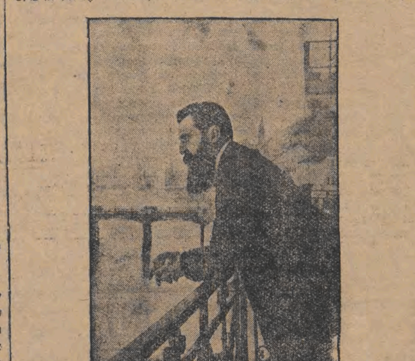
ד"ר הערצל ז"ל, זיין אידיע, דורך דעם מאנפרעד פון זיין בעניטערטער סאטמארער.

אין דעם פערשטן טייל פון דער ביאגראפיע, וועלכע ווערט ערשט דערציילט אין דער וועלט דורך דער אריגינעלער פון זיין אידיע, דורך דעם מאנפרעד פון זיין בעניטערטער סאטמארער.