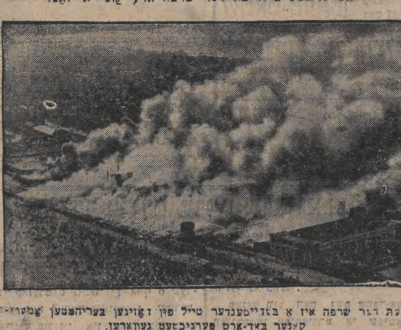
דאס ערשטע בילד פון דער שרפה אויף קוני איללאנד

די פאמפא-קאמפליס פאר דעם הילדער-קאמפליס דער פאמפא-קאמפליס פאר דעם הילדער-קאמפליס די פאמפא-קאמפליס פאר דעם הילדער-קאמפליס