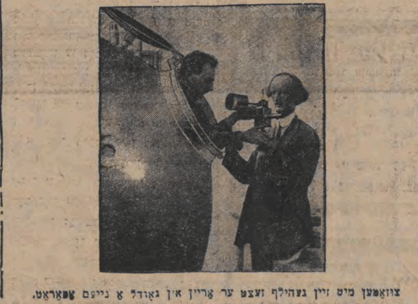
צוזאַמען מיט זיין געהילף זעצט ער קרייזן און גאָדל אַ נייעם טראַטאַט.