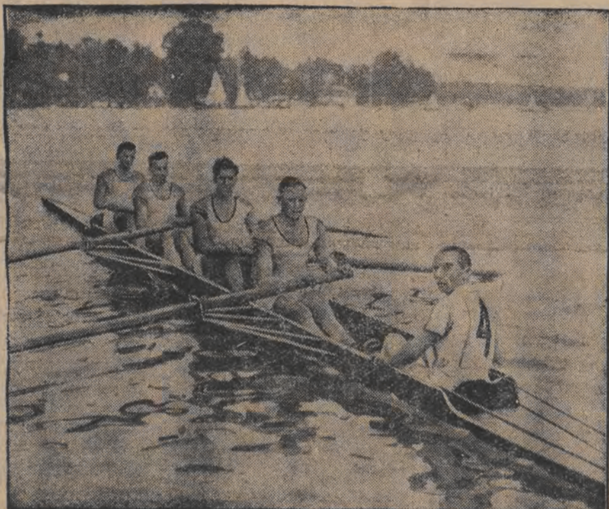
פיר זיגרייכע רויער, ון דער אימפיאדע לינס: א שלוסן-טויער ווערט אפגעפיהרט אין דאך אויף דעם פערטע.