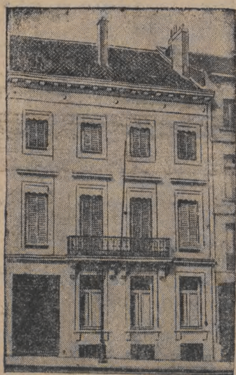
האמוניסטען-בעפאלען די אינארישע געשעפטען אין בריסטל