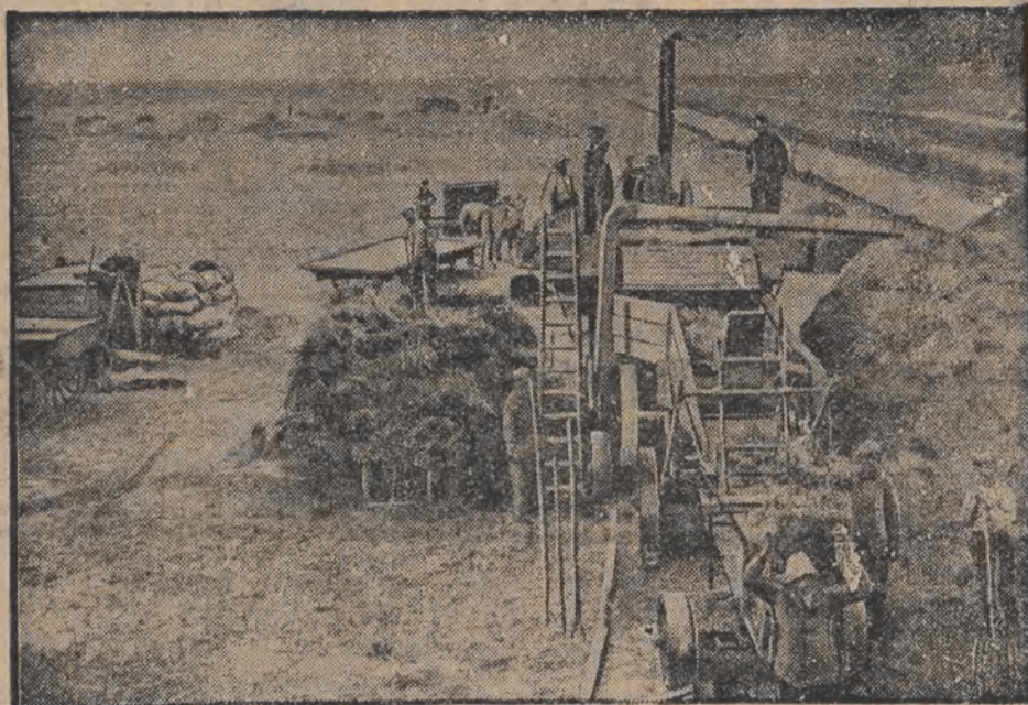
תבואה-שניט אויפ'ן ים-באדען