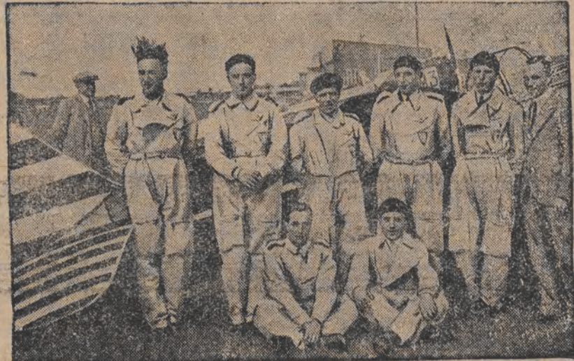
די פאלקסזון און איטאליענער אויפ'ן 1-טן ארט פון די איראפעאישע פליהער