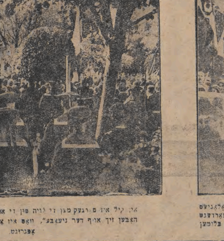
איך ליל איז פארגעסן די לוייה פון די אומגעקומענע מאטראזען, וועלכע האבען זיך אויף דער נ'אבע' וואס און אויסגעצויגען געווארען פון ים-אפריקע.