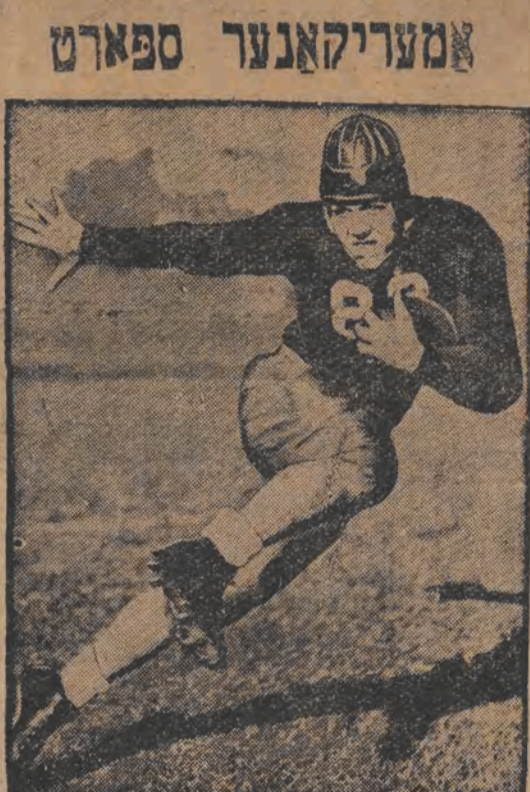
פון אמעריקא האט מען אַהערגעבראַכט דעם ריגור-ספּאַרט, דער דאזיגער ספּאַרט האָט אלע שאַנסען צו זענען דער נאָכערער פּאַפּולער אין אַיראָפּאַ.