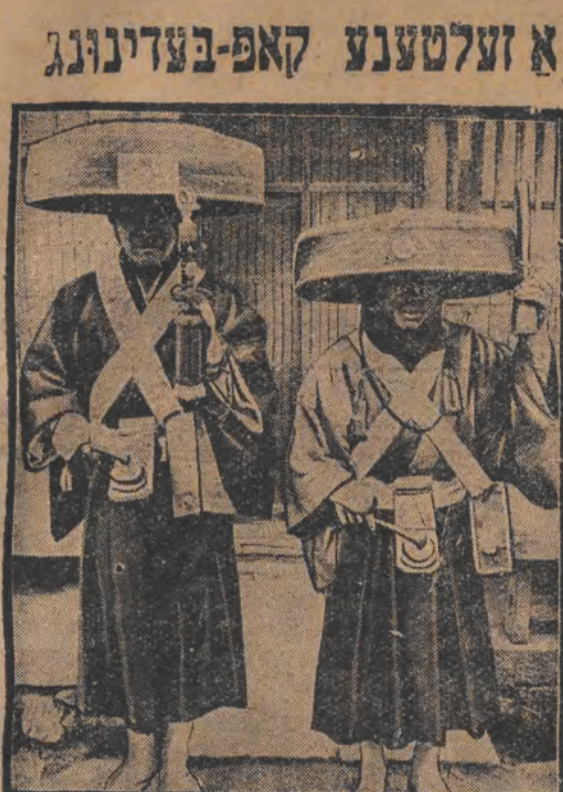
די דאזיגע יאפאנישע גלחים, וואס רופטן די גלויבטע פיש מערקווירדיגע אינטערעסאנטע צום געבעט. טראץ-צו זען אויף די קעפּ אַזעלכע הישען, וואס זענען עהנליך אפאזירען פון אַ לאַטע.