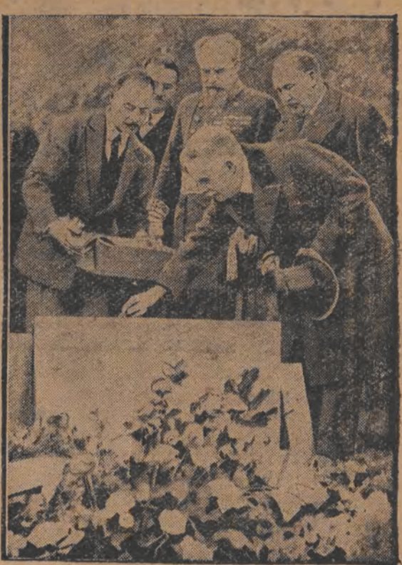
אַ דענקמאַל פאַר דער לופט-שיף, ר. 101. מיט 2 יאָר צוריק איז די ענגלישע לופט-שיף ר. 101 פליהענדיג קיין אינדיען אַראָנעפּאַלען און אונטעבראַכט 50 מענשען, איצט ווערט געשעלט אַ דענקמאַל די אומגעקומענע.