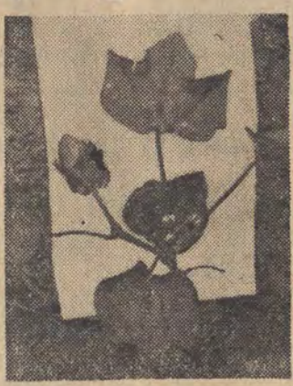
Polska bawełna w okresie dojrzewania. Na zdjęciu z lewej strony widać torebkę z puchem i nasieniem.

Wyniki pierwszych dwóch lat były dobre, rok obecny zapowiada się również dobrze, co jest wynikiem doświadczeń lat poprzednich jak również przyczynił się dla bawełny tegorocznej pogoda. W pierwszym okresie hodowli cały nacisk kładzie się na skrócenie okresu wegetacji bawełny, tak, żeby jej dojrzewanie nastąpiło przed nadejściem deszczów i chłódów jesiennych. Bo w tym czasie, w których jest nasienie i włókno (puch) bawełny nie znośną wilgoci.