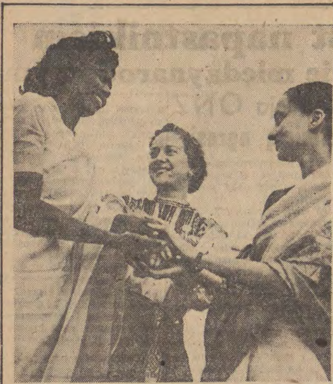
Serdeczne uśmiechy i uściski dłoni to międzynarodowy język wzajemnego zrozumienia studentów całego świata, obradujących na Kongresie w Warszawie.