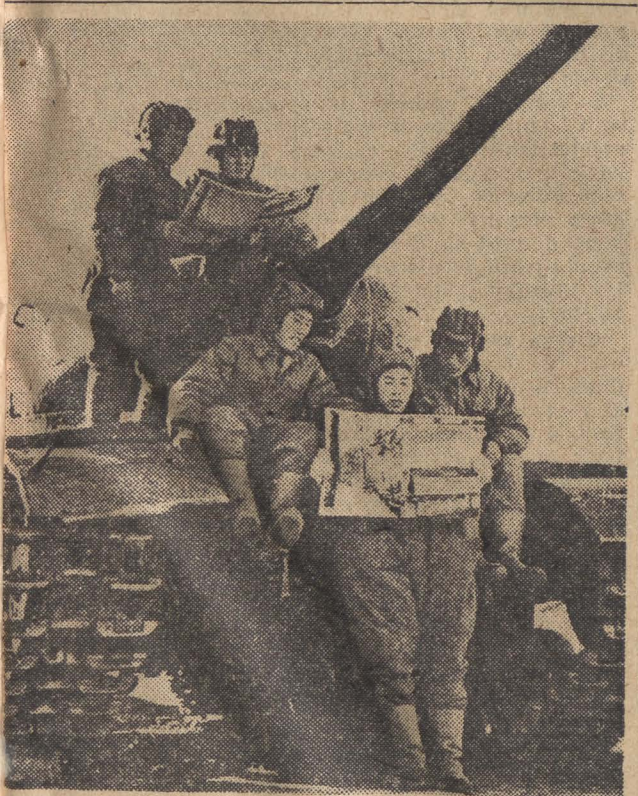
Potega Chińskiej Armii Ludowej obalila na zawsze znienawidzone rządy kliki Czang Kai-szeka i jego amerykańskich popleczników. Bohaterscy ochotnicy chińscy pomogli narodowi koreańskiemu odeprzeć najazd imperialistycznych grabieżców. Armia chińska pod wodzą Czu Teh, złączona braterskim sojuszem z niezwykłą Armią Radziecką, broni bezpieczeństwa swego narodu oraz pokoju w Azji i na całym świecie.