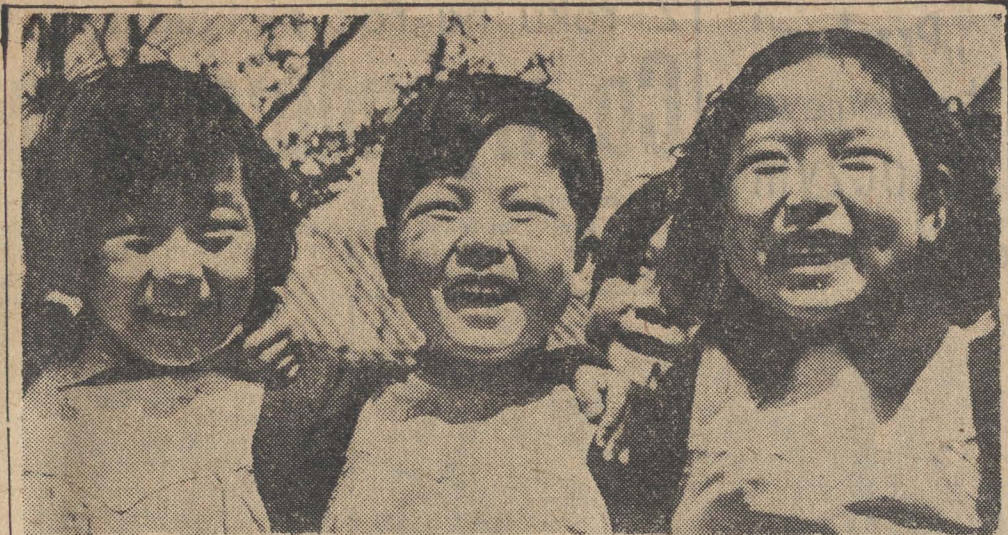
Nie ma już w Chinach dzieci, pracujących w fabrykach lub na roli. Nie ma dzieci, sprzedawanych na służbę do bogaczy. Uśmiech, radość życia, szczęście — stały się udziałem młodego pokolenia. Na zdjęciu: dzieci z przedszkola Fen Szu Ting w Pekinie.

Mówiąc o tych zdobyciach nie można pomijać faktu że przez 3 lata najlepsi synowie narodu — ochotnicy chińscy walczyli z bronią w ręku u boku swych braci koreańskich przeciw wspólnemu wrogowi, co kosztowało