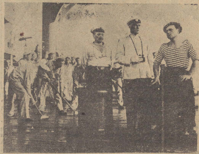
Dnia 10 października rozpoczyna się w całym kraju Festiwal Filmów Radzieckich, który potrwa do 8 listopada. Na ekrany wejdzie szereg arcydzieł kinematografii radzieckiej, a m. in. doskonały film pt. „Przełom“, z którego scenę reproduujemy powyżej. Jest to ekranizacja znanej sztuki Ławreniewa pod tym samym tytułem, wystawianej w Leningradzkim Teatrze im. Gorkiego.

„Przełom“ Ławreniewa zobaczymy na ekranach