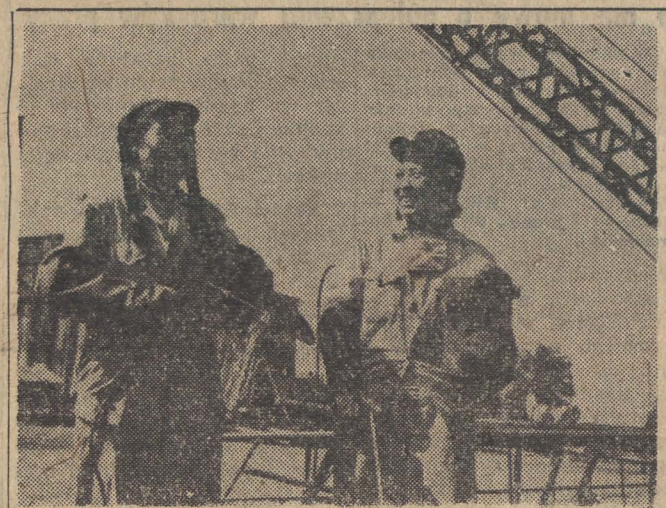
W szybkim tempie rozbudowuje się przemysł narodowy Chin. Kobiety, zrównane w prawach z mężczyznami, mają dostęp do wszystkich zawodów.

Na nic zda się hołubienie niedobitków czangkaiszkowskich na wyspie Taiwan, na nic zda się robota dywersyjna przeciw Chinom, na którą Amerykanie nie szczę-