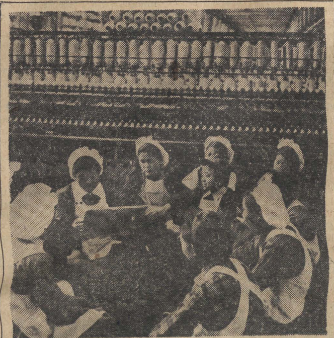
Oto dalekie towarzyski pracy naszych łódzkich tkaczy i przadek — włóknianki chińskie. Na zdjęciu: grupa włóknianek omawia bieżące zagadnienia produkcyjne.

Wielki problem w rolnictwie chińskim stanowi woda. Kraj nawiedzany jest często przez susze, które nieraz skazywały miliony ludzi na