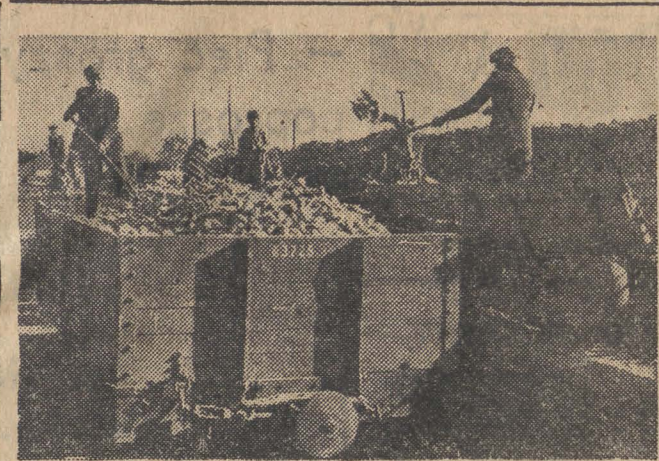
Liczne PGR, spółdzielnie produkcyjne i gospodarstwa indywidualne kontynuują wykopki i dostawy buraków cukrowych. Odwożone są one bezpośrednio na miejsce przeznaczenia, bądź też na punkty skupujące się najczęściej na najbliższej stacji kolejowej. Na zdjęciu: załadowywanie na wagony buraków -cukrowych na punkcie skupu w Jasielcu, pow. Grójec. Punkt ten odbiera dziennie od 1.500—2.000 kwintali buraków.