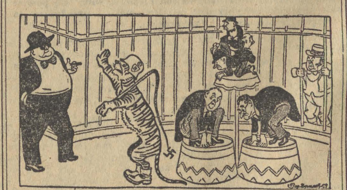
Poskromienie poskramiaczy, czyli ewentualny wynik osławiania militarizmu niemieckiego.