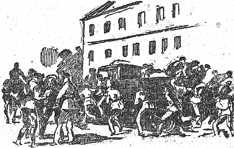
2) Policja zamyka ulice i spieszy do lokalu, w którym odbywała się zgromadzenie komunistyczne.