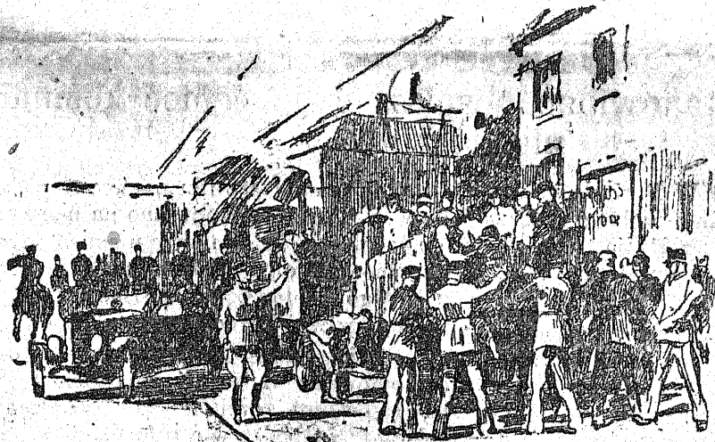
3) „Zaladowanie” aresztowanych uczestników zebrania na samochody eszaronow.