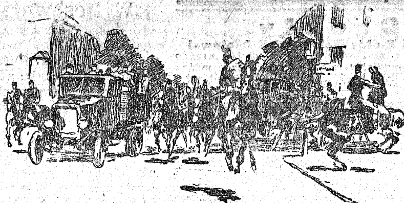
4) Transport uwiezionych komunistow do dyrekcji policji pod silna eskorta piesza i konna.