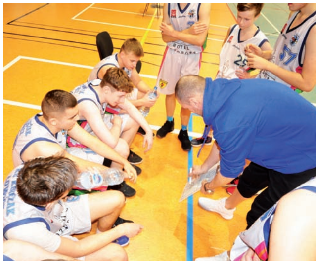
Juniorzy Księżaka cały czas czekają na pierwszą wygraną.

To był słaby występ juniorów Księżaka i tylko druga kwarta była na dobrym poziomie. Księżacy przegrali ją 16:18, pokazując, że momentami mogą się skoncentrować i grać dobrze. W pozostałych okresach gry dużo lepiej zagrała Ósemka, budując ostatecznie przewagę 46 punktów.