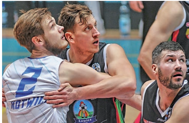
Starcie w Kołobrzegu było bardzo wyrównane, a walka trwała do końcowych minut.

Kotwica mecz zaczęła trochę nerwowo i pierwsze punkty zdobyła dopiero po czterech minu-