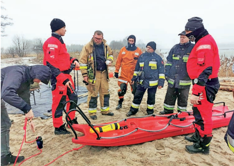
Strażacy z Bolimowa mają na wyposażeniu specjalne sanie, na których mogą zbliżyć się do osoby znajdującej się w zamrożonej wodzie.

na, a czego wręcz nie należy robić na lodzie. Udało mu się natomiast nagrać ciekawy, krótki, bo zaledwie 15-sekundowy filmik podczas ćwiczeń, który może być ostrzeżeniem przed tym, że nie należy wchodzić na zamrożone zbiorniki wodne. Można go obejrzeć również na naszym portalu www.lowiczanie.info wyszukując frazę „ćwiczenia ratownictwa lodowego”.