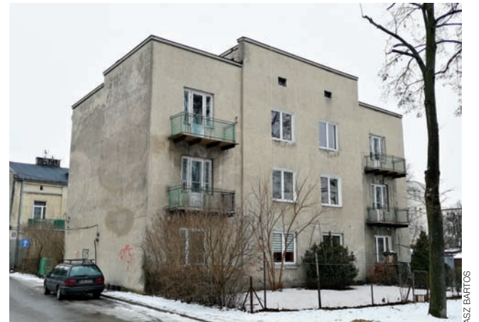
Kamienica przy ul. Akademickiej 11 jest w złym stanie technicznym, po nabyciu nowy właściciel będzie musiał zadbać o jej kapitalny remont.