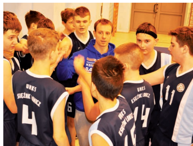
Młodzi Księżacy nie mieli w Łodzi żadnych szans.