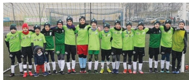
Zespół Pelikana 2009 nie dał szans Górnikowi z Łęczycy.