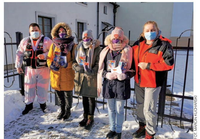
Wolontariuszy spotkaliśmy m.in. na ul. Pijarskiej w Łowiczu, gdzie do puszek wrzucili pieniądze ratownicy z zespołu ratownictwa medycznego.

Spotkaliście wolontariuszy WOŚP na ulicach Łowicza lub okolicznych miejscowości? Kto chciał, takiego znalazł, choć było ich nieco mniej niż w ubiegłych latach, a to również z tego powodu, że łowicki sztab wspomagał zbiórki w okolicach. – Rok temu skupialiśmy się przede wszystkim na samym Łowiczu, teraz nasi