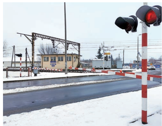
Przejazd w ul. 3 Maja co chwila jest zamykany na kilka lub kilkanaście minut.

W rozmowie z nami wskazał, że wytracenie prędkości przez pojazd i wolniejsze wykonywanie manewrów sprawia, że kierowca ma więcej czasu na reakcję, w przypadku tego skrzyżowania trzeba brać pod uwagę jeszcze to, że ul. Młodzieżową przecina chodnik i ścieżka rowerowa, które są, szczególnie w okresie letnim, chętnie wykorzystywane. Rowerzyści jadący ścieżką mają pierwszeństwo przed pojazdami, które winny się zatrzymać i ich przepuścić, to też było brane przy projektowaniu ulicy. Wolniejsza jazda samochodów jest w tym miejscu, zdaniem naczelnika, wręcz wskazana. – Zwolnienie przed skrzyżowaniem to normalny element ruchu drogowego – podkreśla. ■