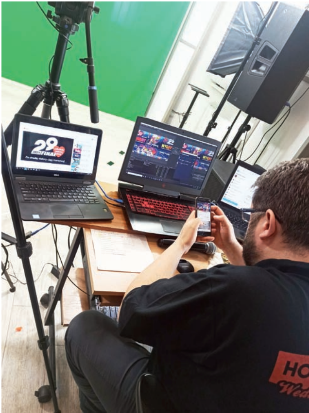
Produkcja wirtualnego programu odbywała się w jednym z prywatnych domów w Mysłakowie.