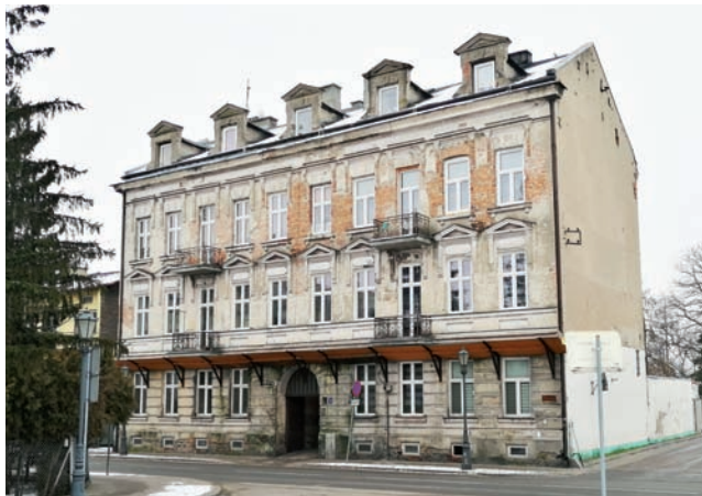
Jedna z najładniejszych, ale i najbardziej zaniedbanych kamienic w Łowiczu. ZGM przez ostatnie lata inwestował w nią wymieniając m.in. okna i remontując dach, ale potrzeby są dużo większe i obciążąłyby budżet miasta na 2,8 mln zł.

Obecnie, po tym jak opuściło go Państwowe Gospodarstwo Wodne Wody Polskie – Zarząd Zlewni w Łowiczu, budynek stoi niewykorzystany. Jak powiedział nam burmistrz, w obecnej chwili nie ma też zainteresowania jego wynajęciem. Budynek wymaga remontu. ■