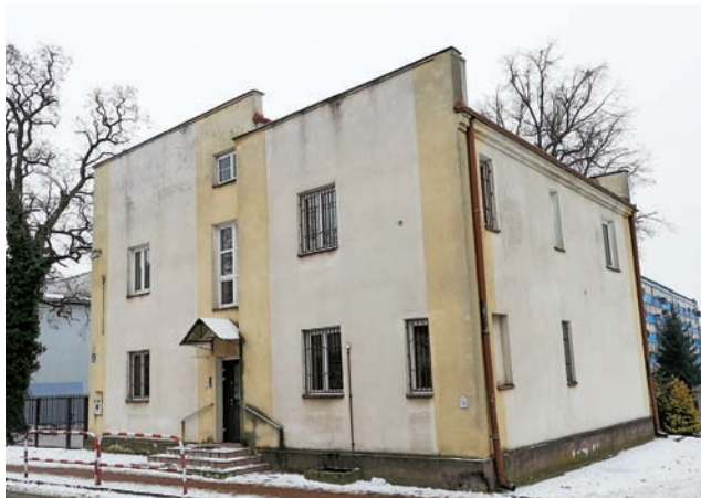
Jeszcze kilka lat temu w budynku przy ul. Nowej mieściły się biura Zakładu Gospodarki Mieszkaniowej, obecnie stoi pusty.