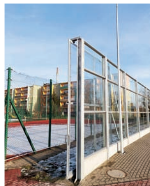
Brama jest obecnie otwarta. Skrzydło, które wypadło nie jest używane.

Kierownik przyznał, że zamontowana w ekranach bramach została wykonana zgodnie projektem otrzymanym z ratusza. Pytany o to dlaczego doszło do jej przewrócenia, nie chciał wdawać się w szczegóły, przyznał, że miało na to wpływ wiele czynników