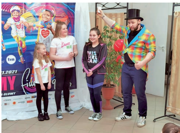
Pokaz iluzji „Miś Masz” był transmitowany online z hali OSiR I przy ul. Topolowej.

Zbiórki w części również przeniosły się do sieci: WOŚP stworzył platformę eSkarbonki, do których można było wpłacić pieniądze. ESkarbonkę mógł uru-