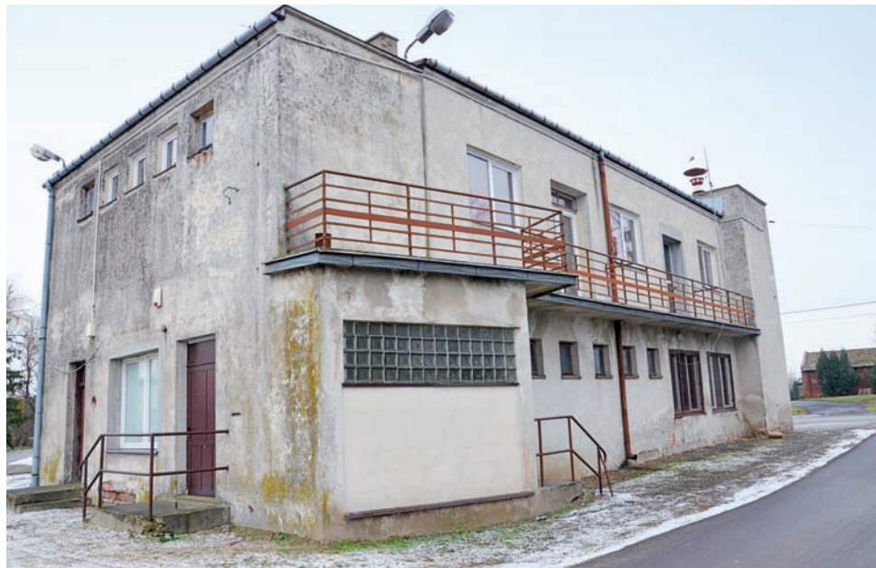
Budynek jednostki Ochotniczej Straży Pożarnej w Zdunach przed termomodernizacją, która poprawi także jego estetykę.

Jako pierwsza przygotowania do realizacji projektu rozpoczęła jednostka w Zdunach, która pod koniec grudnia ubiegłego roku ogłosiła przetarg na roboty, była do tego zobowiązana, ponieważ ich koszt szacowany jest