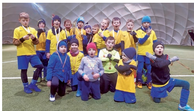
Drugie miejsce – to sukces UKS AP Champions-2011 Łowicz.

Zgodnie z założeniami Programu szkolenia PZPN, który realizujemy jako certyfikowana szkoła, w meczu należy skupić się na realizacji celów z aktualnego mikrocyklu szkoleniowego. Nasz mikrocykl w grupie żak zakładał grę 1x1 i do takiej właśnie gry byli zachęceni nasi zawodnicy w tym meczu. Mecz obfitował w mnóstwo dryblingów i indywidualnych akcji, co daje każdemu zawodnikowi mnóstwo przyjemności. Przy okazji wygraliśmy też mecz i to sprawiło nam wszystkim oczywiście dodatkową radość. Po wrót autobusem był bardzo sympatyczny, bo grupa 2011/12 mimo,