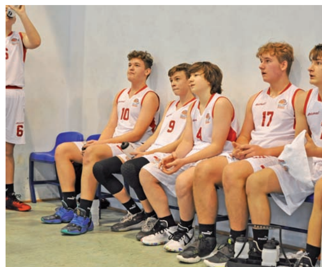
Koszykarze Bzury przegrali minimalnie w Kutnie.

– Niestety, po serii zwycięstw, nadszedł słabszy moment. Tak jak się spodziewaliśmy, mecz był bardzo wymagający fizycznie. Rywal wykorzystywał swoje atuty, czyli szybkie wyprowadzanie piłki oraz przewagę fizyczną pod koszem. Moi chłopcy dzielnie walczyli i w momentach gdy prezentowali swój właściwy poziom, byliśmy w stanie niwelować atuty przeciwnika i budować przewagę punktową. Niestety zagraliśmy