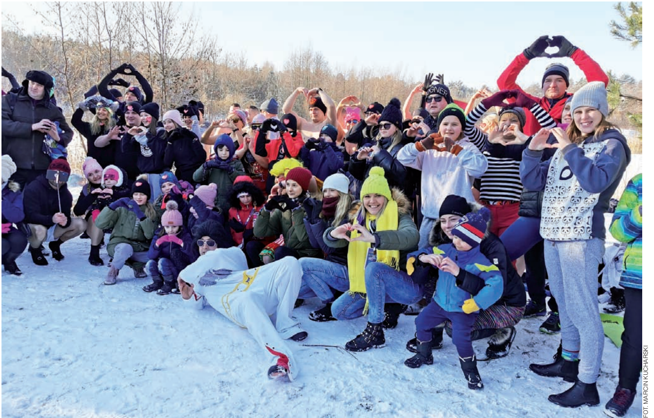
Pamiątkowe zdjęcie części osób biorących udział w morsowaniu dla WOŚP.