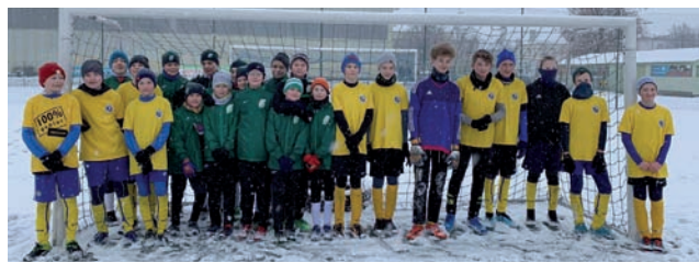
Przewaga fizyczna między graczami Pelikana, a Orła Nieborów była widoczna.

Gracze Pelikana III już w pierwszej połowie stracili pięć goli i nie mogli poradzić sobie z wyróżniającym się w zespole