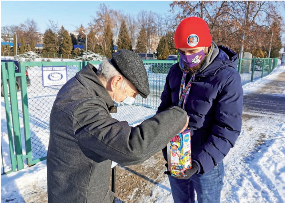
Volontariusza WOŚP Jarosława spotkaliśmy na ul. Topolowej. To był jego pierwszy finał Orkiestry w charakterze wolontariusza.