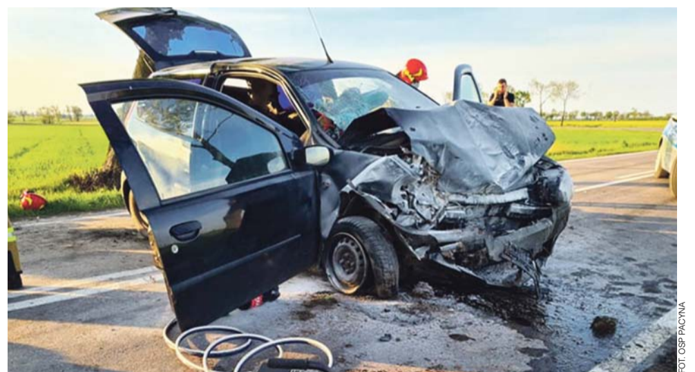
Samochód kierowcy został mocno poturbowany.