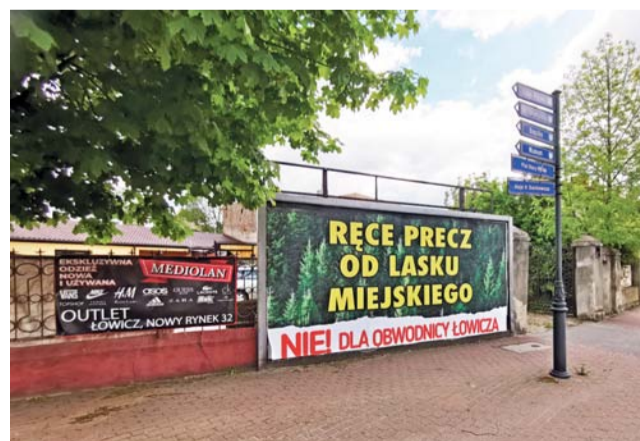
Banery przeciwko 4 zaproponowanym wariantom obwodnicy Łowicza zalewają miasto.