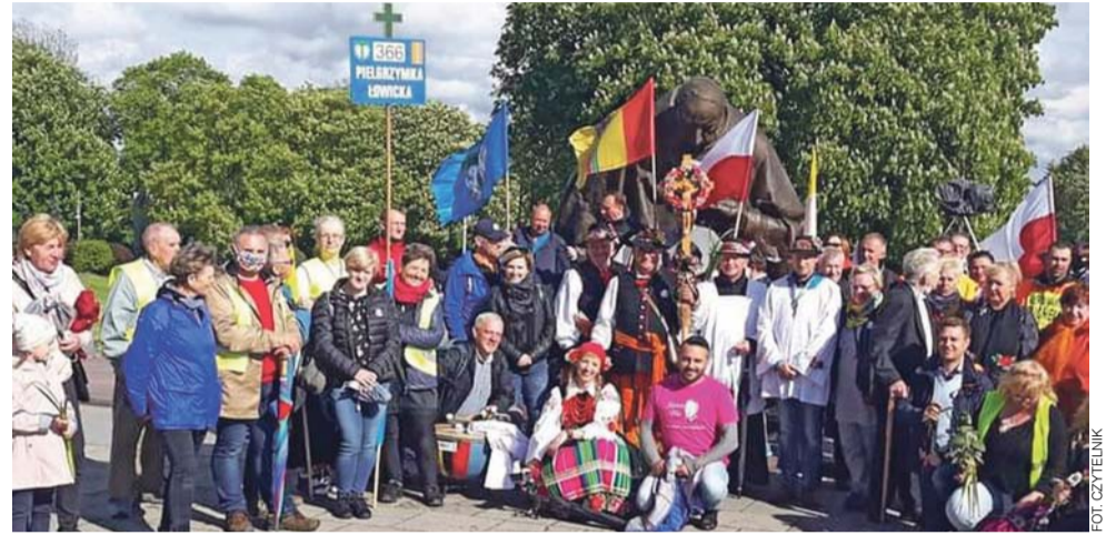
Wspólne zdjęcie pielgrzymów z Łowicza pod pomnikiem Kardynała Stefana Wyszyńskiego.