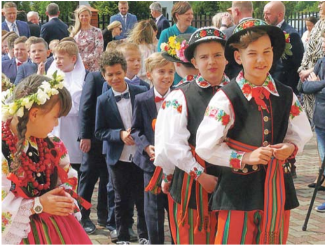
W kościele pw. Chrystusa Dobrego Pasterza w miniony weekend do Pierwszej Komunii Świętej przystąpiło ponad 100 dzieci ze szkół nr 2 i 7 oraz szkoły pijarskiej.