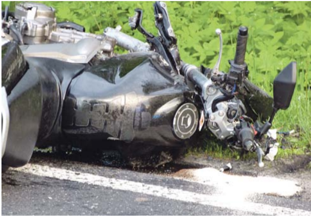
Zderzenie było bardzo mocne, motocyklista nie miał szans na przeżycie, pomimo szybkiej interwencji ratowniczej.

Pierwsi na miejscu zjawili się strażacy z OSP w Nieborowie, później nadjechały także dwa zastępy JRG Łowiczu, karetka, policja. Na terenie pomiędzy sklepem a ogrodzeniem ogrodu wylądował przysłany z Łodzi śmigłowiec LPR „Ratownik 16”. Trwająca około godziny reanimacja nie zakończyła się jednak dobrze, ranny zmarł. Był to 21-letni mieszkaniec Skierniewic. Nie miał prawa jazdy kategorii „A”, w ogóle więc nie