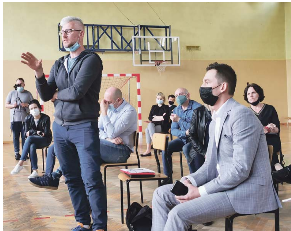
Mieszkańcy wsi w gminie Łowicz mieli wiele pytań i uwag do przedstawicieli łódzkiego oddziału GDDKiA oraz biura projektowego IVIA.

Na koniec spotkania burmistrz przypomniał, że w latach 2023-2024 będzie budowany trzeci pas autostrady A2. To pokazuje jak zwiększy się ruch pojazdów – i my też wkrótce wszyscy odcujemy, jak bardzo potrzebna jest w Łowiczu obwodnica. mwk