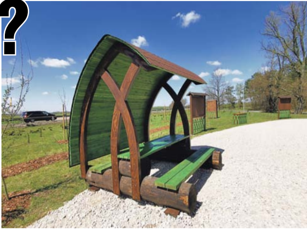
Miejsce odpoczynku turystów przy DK70 – nie tylko zachwyca ilością zasadzonych drzew i krzewów, ale też formą ustawionych zadaszeń, pod którymi można usiąść przy stoliku.

Wykonanie punktu obudziło też apetyt wśród mieszkańców gminy i osób korzystających re-