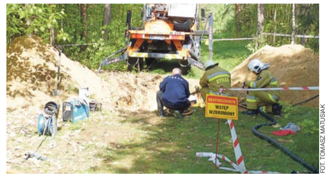
Szybkie zgłoszenie i reakcja na nie zapobiegły kradzieży, jaka wiązałaby się z ryzykiem skażenia środowiska.

Kierowca został zatrzymany. Usłyszał zarzut posiadania narkotyków, za co grozi kara do 3 lat pozbawienia wolności. Ponieważ był poszukiwany, trafił do aresztu śledczego. aa