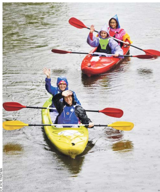
Mimo deszczu uczestniczkom spływu nie przestały dopisywać dobre humory. tb

Sęk w tym, że umowy nie umieszczono w rejestrze nawet już po jej zrealizowaniu, choć wtedy kwotę już znano. Wójcik zresztą, pytając o numer w rejestrze, pytał po to, by do umowy mieć wgląd – tymczasem dopytywał się o to przez wiele tygodni bezskutecznie. Dopiero gdy 23 marca tego roku złożył wniosek o dostęp do tego dokumentu w trybie ustawy o dostępie do informacji publicznej – otrzymał kopię umowy nazajutrz. str. 4