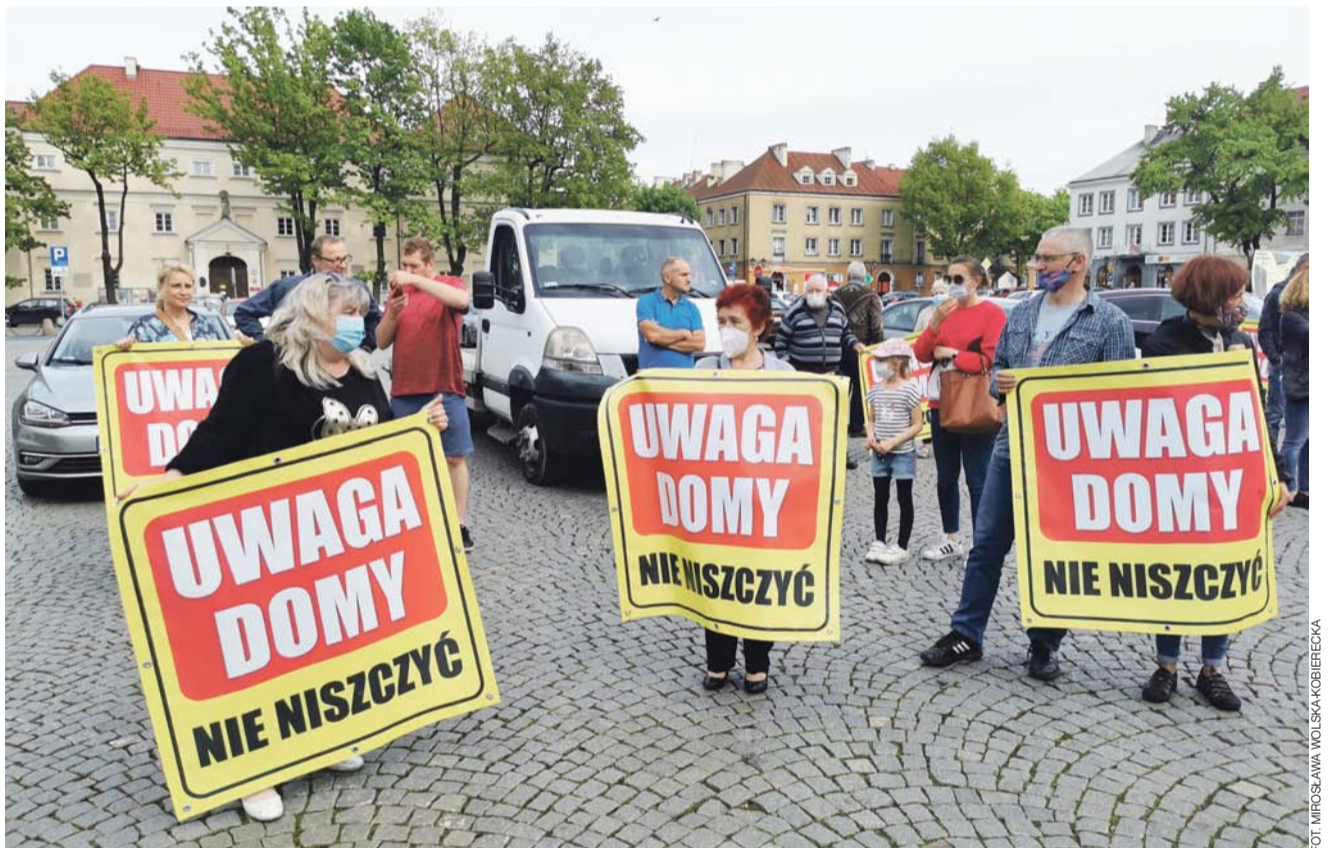
Mieszkańcy gminy Łowicz protestowali 24 maja na Starym Rynku przeciwko przedstawionym 4 koncepcjom budowy obwodnicy, która wykracza poza granice miasta. W tym samym czasie burmistrz spotykał się w ratuszu z przewodniczącymi osiedli.

Samochodów przybywa i będzie przybywać, więc nie można przespać szansy na budowę 15 km drogi, która będzie najlepszym rozwiązaniem także w perspektywie 20 czy 30 lat.