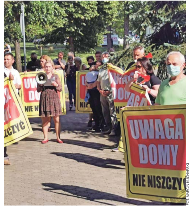
Kolejny protest przeciwko budowie obwodnicy Łowicza. Tym razem przed starostwem powiatowym.