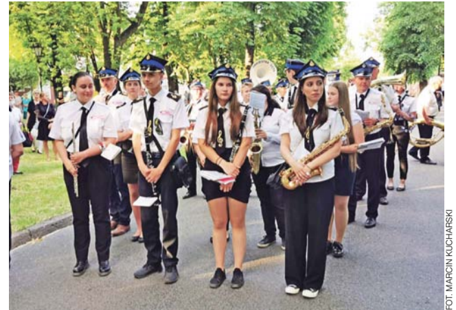
Oprawę muzyczną mszy świętej oraz procesji zapewniła m.in. orkiestra dęta z Góry Świętej Małgorzaty.

Łowicz | Na zakończenie oktawy Bożego Ciała