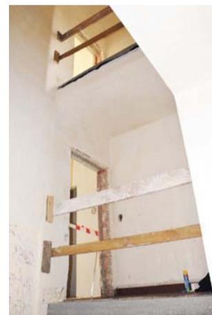
Tu będzie szyb windy. Na razie widoczna jest otwarta klatka schodowa.

Najemcom pozostanie tylko urządzić kuchnię, wstawić meble i mieszkać.