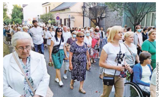
Na końcu procesji idą wierni. W tym roku było ich porównywalnie do tego jak wyglądały takie procesje przed pandemią.