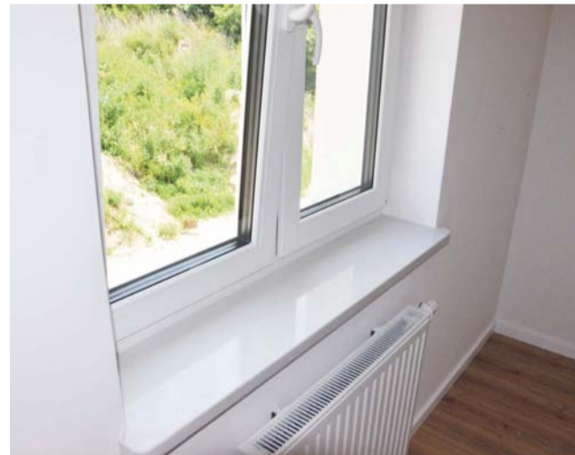
Mieszkania będą mieć centralne ogrzewanie, zasilane z pieca gazowego, odrębnego dla każdego z bloków.