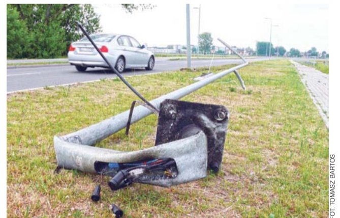
Samochód siłą uderzenia oderwał latarnię od fundamentu i przeciągnął ją po jezdni na odcinku ok. 150 m.

7 czerwca około godz. 19.40 na os. M.Konopnickiej w Łowiczu 8-letni chłopiec jechał na rowerze i w pewnym momencie, w rejonie budynku kotłowni zderzył się z poruszającym się drogą samochodem marki Renault, który prowadził 30-letni mieszkaniec Łowicza. Najprawdopodobniej dziecko wyjechało zza budynku. Na szczęście nic poważnego mu się nie stało, pierwszej pomocy udzieli mu strażacy, później chłopiec trafił pod opiekę Zespołu Ratownictwa Medycznego, był przytomny, nie wymagał hospitalizacji. tb