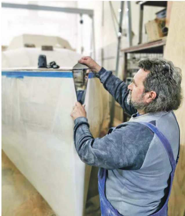
Metalowe okucie dziobu. Takich metalowych elementów będą na jachcie dziesiątki.

kałdu: wytwarzający energię elektryczną wiatrak to koszt 3,5 tysiąca złotych, akumulatory litowo-żelazowo-fosforowe, najlepsze, wytrzymałe do 7000 doładowań – mimo, że oferowane w promocji, kosztowały 20 tysięcy złotych, telefon satelitalny wraz z prawem do transmisji danych – blisko 10 tysięcy, maszt z kompletnym oprzyrządowaniem metalowym (wanty, relingi itp.) – kilkadziesiąt tysięcy, żagle – 35 tysięcy.