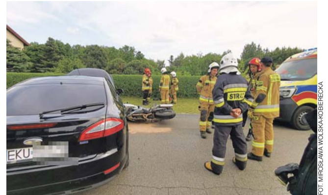
Do wypadku z udziałem motocyklisty doszło na granicy Parmy i Bobrownik.

na miejscu mandatem, ponieważ nie wiadomo jak długo w szpitalu pozostanie najstarsza córka 36-letniej kobiety i jakie ostatecznie odniosła obrażenia i jakiego wymaga leczenia. Jeśli obrażenia nie będą kwalifikować jej do leczenia przez ponad 7 dni, czyn mieszkańca gminy Bielawy zostanie zakwalifikowany jako wykroczenie. Wówczas czeka go mandat do 500 zł i maksymalnie 6 punktów karnych. tb