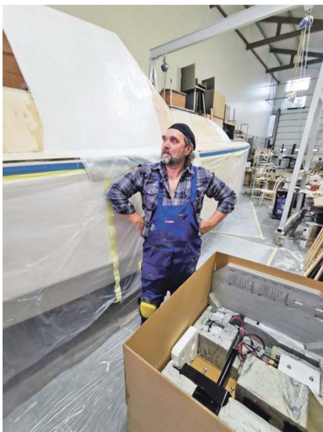
W kartonie spalinowy silnik z Czech. Konieczny, bo bez niego jacht nie będzie miał pozwolenia na wejście do portu.

I dwa uchwyty pod dwa wiatraki – jako kolejne źródło energii elektrycznej. Trzy panele i dwa wiatraki – każdy będzie zasilany z 5 akumulatorów, a on