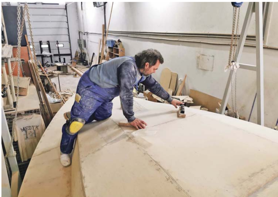
Wygładzanie zewnętrznej ściany i dachu kabiny. Każdy otwór z wkrętem jest dokładnie przykryty szpachlą.