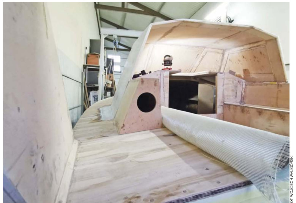
Kolejny etap: kładzenie tkaniny szklanej i przykrywanie jej kolejnymi warstwami żywicy epoksydowej.