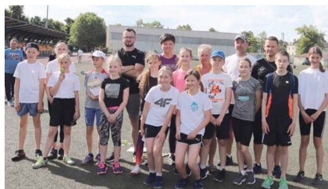
Zespół szkoleniowy naszego powiatu ma wielu chętnych do treningu.

W klasyfikacji drużynowej wygrał Uczniowski Klub Sportowy Jedyńska Łowicz, gdzie trenuje najwięcej uczniów z SP 7 i SP 2 Łowicz. Nauczyciele z tych szkół kierują utalentowane dzieci do tre-