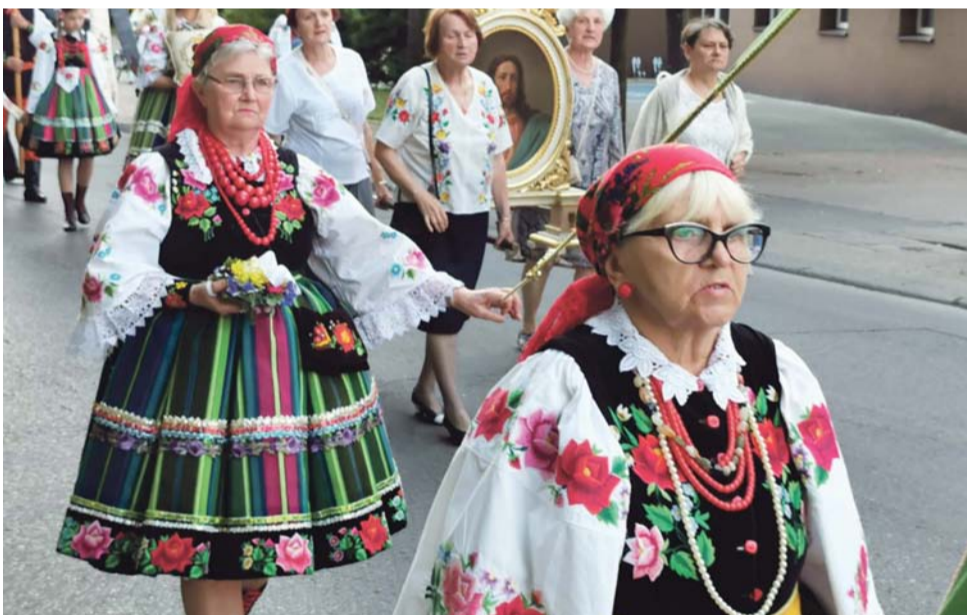
W tradycyjnej procesji na zakończenie oktawy Bożego Ciała wiele osób uczestniczy w strojach ludowych i nie zawsze są to osoby starsze.