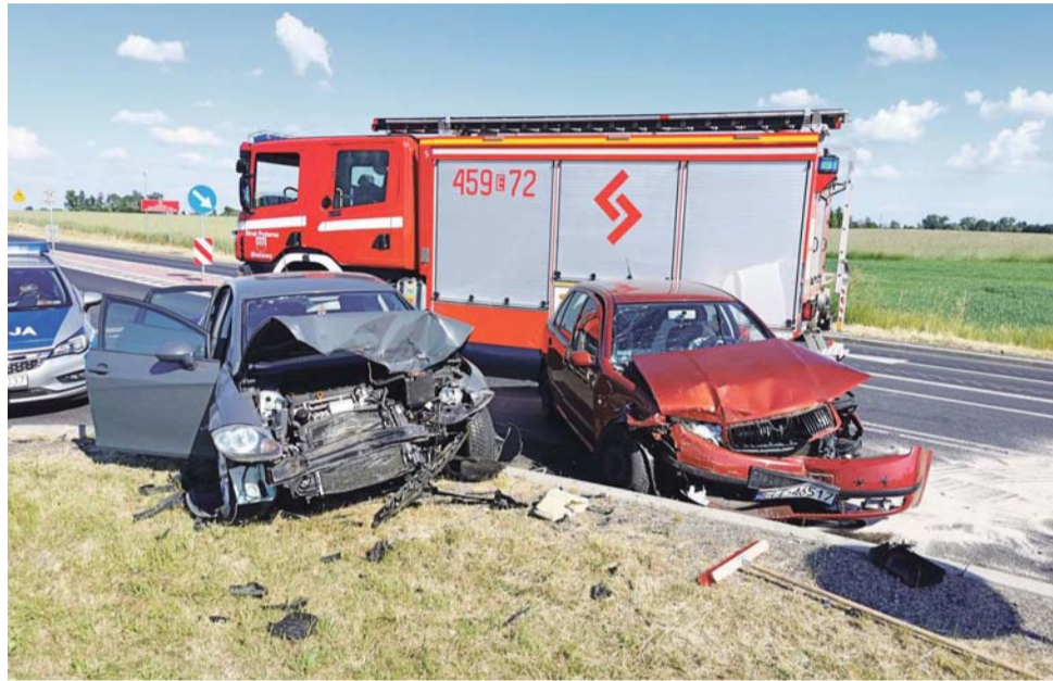
Rozbity seat i skoda na poboczu DW 703 pod Bielawami.

– Nie miałam szans, zdążyłam zacząć hamować, jechałam może 70 km/h – powiedziała nam natomiast 36-latką z powiatu stubickiego (lubuskie), która kierowała osobowym Seatem, jadącym od Łowicza w kierunku Bielaw. Na siedzeniu z tyłu wiozła dwoje swoich dzieci, 16-letnią córkę i 2,5-letniego syna, obok, na fotelu pasażera, siedziała jej druga, 18-letnia córka. – Wzięłam ze