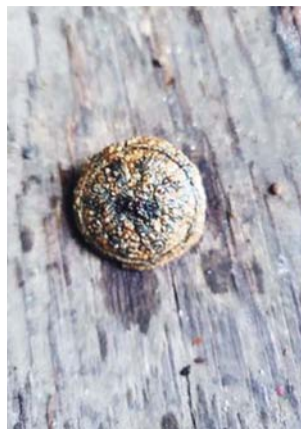
Guzik z munduru żołnierskiego z okresu międzywojennego znaleziony na placu budowy boiska przy ZSP nr 1.