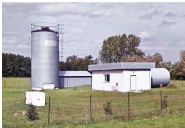
Stacja Uzdatniania Wody w Kiernozi.