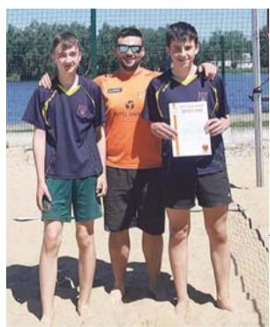
Młodzi siatkarze z Pijarskiej zdobyli doświadczenie w Rawie Mazowieckiej.

■ Wyniki: SP 2 Skierniewice – Pijarska SPKP Łowicz 14:21, SP 1 Rawa Mazowiecka – SP 2 Żychlin 10:21, Pijarska SPKP Łowicz – SP 2 Żychlin 9:21, SP 2 Skierniewice