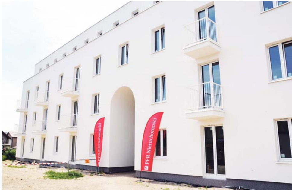
Przy ul. Krudowskiego powstaje jeden blok z 16 mieszkaniami i dwa bloki w kształcie litery C – w każdym z nich będzie 40 mieszkań. Na zdjęciu jeden z nich.

Osoby, które nie spełniają kryteriów społecznych, również mogą starać się o wynajem mieszkania. Tym bardziej, że w drugim etapie planowane jest sprawdzenie dochodów wnioskodawców pod kątem ich możliwości płacenia czynszu, a ten będzie