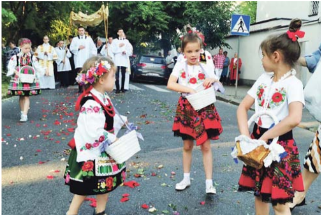
Najmłodsze uczestniczki procesji eucharystycznej sypały płatki kwiatów przed niesionym pod baldachimem Najświętszym Sakramentem.