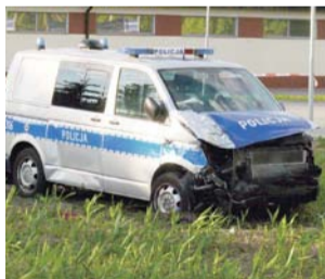
Rozbitny radiowóz Volkswagen T6 , podobnie jak skoda, zatrzymał się po zderzeniu na polu kukurydzy.

W środę powiedziała nam także, że nie postawiono nikomu żadnych zarzutów, sprawa jest w toku, oprócz tego do środy otwarta była klasyfikacja zdarzenia: jako kolizja czy wypadek, a co za tym idzie czy postępowanie będzie o wykroczenie czy przestępstwo. Zależy to od długości pobytu w szpitalu jednego z poszkodowanych – 27-letniego mieszkańca Łowicza, który prowadził skodę. Po