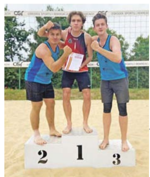
Reprezentanci Pijarskiego LO wygrali i wywalczyli awans do finału wojewódzkiego.

– Chłopaki przygotowawali się mocno do zawodów, zagraли swoje i nie dali szans przeciwnikom –