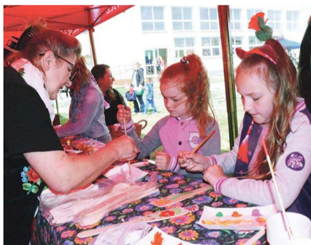
W czasie pikniku rodzinnego w Niedźwiadzie przygotowano dużo atrakcji dla dzieci, były nimi m.in. warsztaty poprowadzone przez twórców ludowych.

Dużą atrakcją dla dzieci stały się dmuchane zjeżdżalnie,