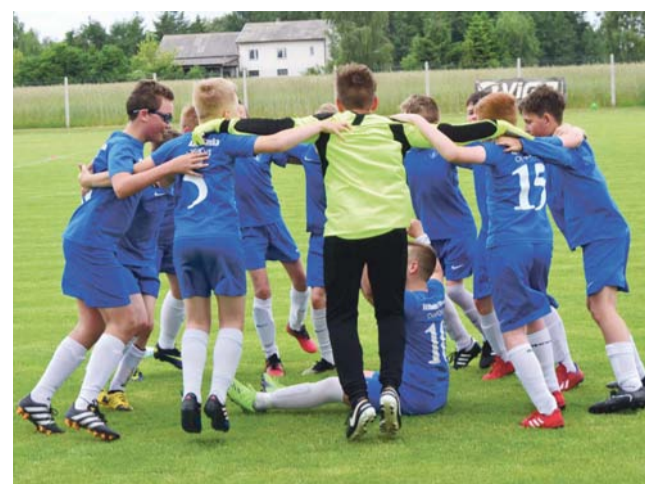
Zawodnicy Champions-2009 odtańczyli po meczu taniec radości.

Teraz czas na walkę w finale wojewódzkim i być może medale. Czekamy na dobre informacje z plażowych aren. zł