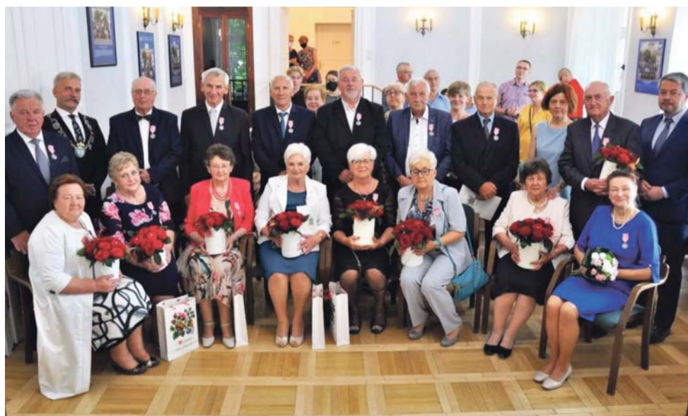
Jedna z grup jubilatów, którzy w 12 czerwca zostali odznaczeni w łowickim ratuszu za długoletnie pożycie małżeńskie.

Łowicz | Dyplomy i odznaczenie od prezydenta