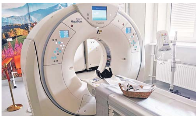
Pierwsze badania nowym tomografem komputerowym w łowickim szpitalu zostały wykonane w środę, 16 czerwca.

CZWARTEK 17 czerwca 2021 | NR 24 (1459) | Rok XXXI | ISSN 1231-479x