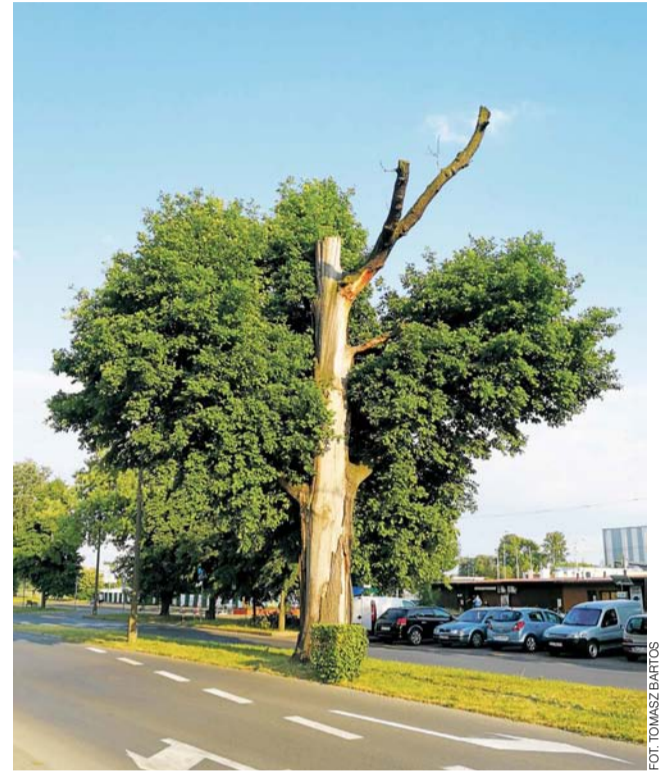
Dąb rosnący na zielonym skwerze pomiędzy pasami ruchu ul. Starzyńskiego, mimo suchego konaru i braku kory z jednej strony, ma się całkiem dobrze.

Nieco lepiej prezentują się mosty pod zarządem Zarządu Dróg Wojewódzkich w Łodzi, a zdecydowanie najlepiej te pod zarządem łódzkiego oddziału GDDKiA – trudno się jednak dziwić, skoro ten ma pieniądze na remonty. W kontrolowanym okresie prowadził ich aż 47. Dzięki temu ma 11 mostów „odpowiednich” i aż 663 „zadawalające”. Żaden z krajowych mostów w woj. łódzkim nie jest awaryjny, ani nawet przedawaryjny. ■