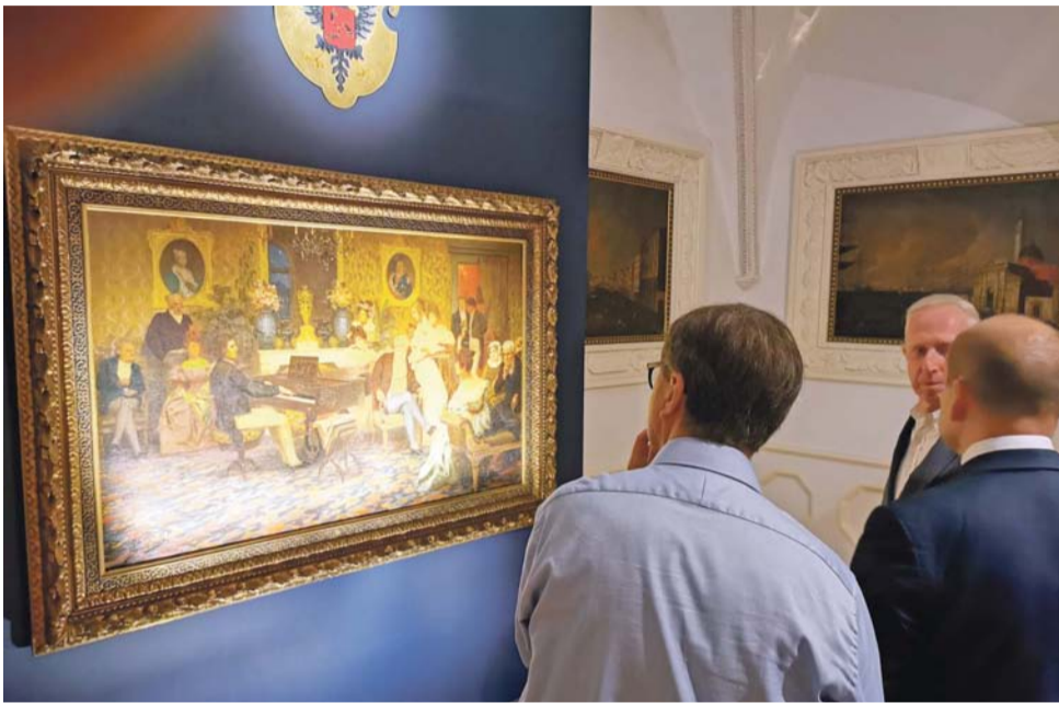
Obraz Henryka Siemiradzkiego można oglądać w muzeum w Nieborowie do końca sierpnia tego roku.

Po tym jak obraz trafił do nieborowskiego muzeum, konserwa-