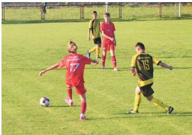
Ekipa Astry-2007 Zduny zajęła ostatecznie czwarte miejsce.

Zaległe mecze 3. kolejki łódzkiej lidze okręgowej trampkarzy młodszych C2: