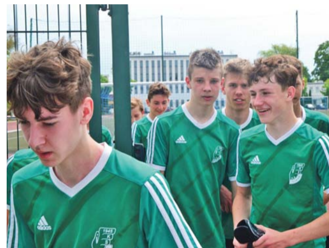
W tej rundzie Pelikan-2006 ma powody do uśmiechu.

W niedzielę, 20 czerwca zespół Pelikana-2006 zmierzy się z UKS Piotrcovia Piotrków Trybunalski. Mecz zostanie rozegrany na boisku rywali o godz. 15.00. ever