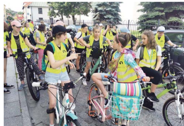
Zgodnie z wieloletnią tradycją, w szkole pijarskiej został zorganizowany rajd rowerowy do Maurzyc z okazji święta szkoły.

W piątek można było oglądać bogato wyposażone pracownie przedmiotowe, służące klasom o wszystkich tych nachyleniach. Podczas dnia otwartego, szkoła prezentowała też, jakie inne zainteresowania pomaga rozwijać. Tym, co jako pierwsze rzuca się w oczy, jest bogata kolekcja historycznych kostiumów. Najczęściej są one wykorzystywane w szkolnych przedstawieniach. Tego dnia część z nich założyli na siebie uczniowie i nauczyciele zachęcający do