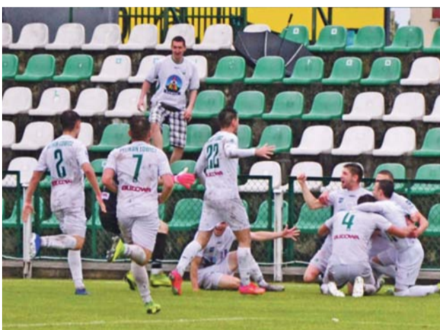
Po голу na 3:1 było jasne, że już nic nie odbierze łowiczanom zwycięstwa.