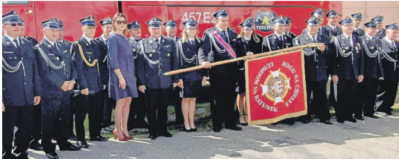
Na zakończenie uroczystości strażacy z OSP w Teresewie stanęli do pamiątkowego zdjęcia.