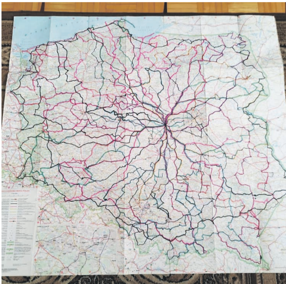
Mapa wypraw rowerowych państwa Wnuków.

przez Wyszogród, Raciąż i Gliniojeck. Całość trasy zamknęła się w 333 kilometrach i trwała 2 dni.