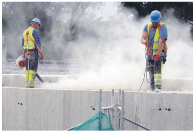
Aktualnie prowadzone są prace nad modernizacją pierwszej z dwóch komór fermentacyjnych.