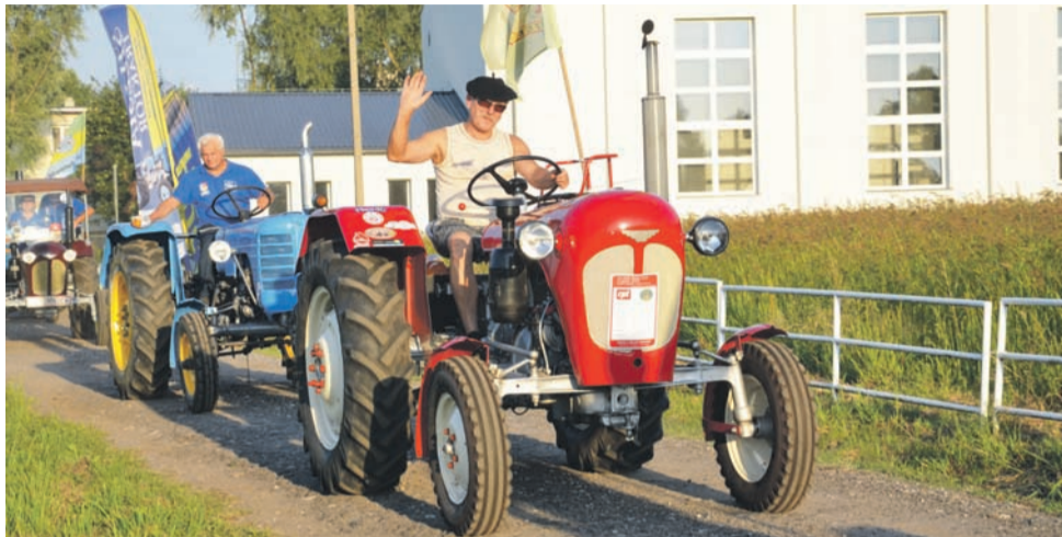
Dwudniowy III Regionalny Zlot Starej Motoryzacji i Maszyn Rolniczych rozpoczęła parada traktorów, w której uczestniczyły kilkanaście maszyn. Przejechały one 14-kilometrową pętlę drogami gminy Zduny, robiąc trochę hałasu i pozdrawiając napotkane osoby.