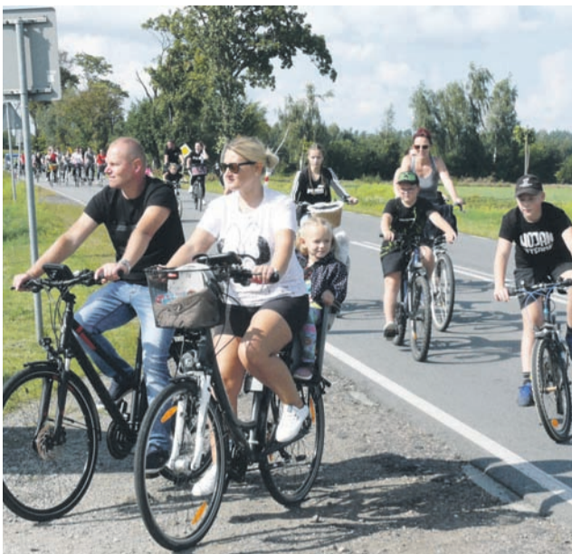
Uczestnicy rajdu rowerowego wracają na teren strażnicy OSP Czyżew, gdzie rozpocznie się piknik rodzinny.