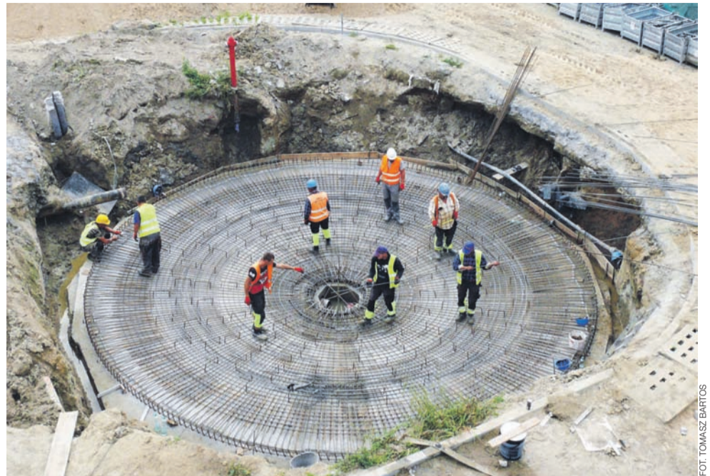
Widok z góry na fundament, który będzie stanowił podstawę nowego zbiornika osadów przefermentowanych.

W marcu od razu z pierwszego zbiornika biogaz popłynię do mających powstać w międzyczasie nowych obiektów: zbiornika, z którego będzie dystrybuowany do nowego budynku, z agregatami prądotwórczymi produkującymi energię na potrzeby oczyszczalni lub do wspomnia-