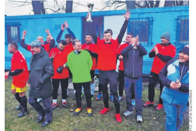
Radość po zdobyciu Pucharu Wójta Gminy Łowicz

Puchar za trzecie miejsce zdobyła ekipa Zrywu Wygoda, która w decydującym meczu pokonała team z Jamna 4:2. Na zakończenie imprezy puchary najlepszym