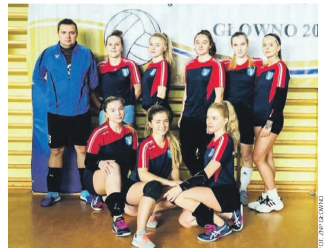
Siatkarki Korony Łaguszew bardzo dobrze zaprezentowały się na turnieju w Głownie.