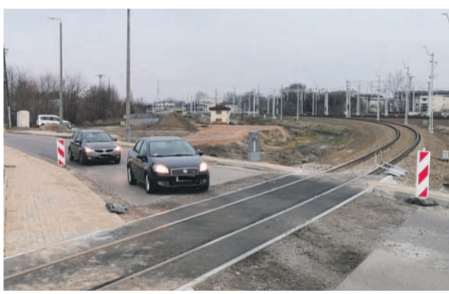
Przejazd kolejowy w ul. Klickiego, czeka na zakończenie prac.