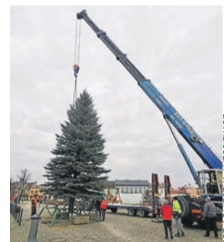
posesji przy ul. Armii Krajowej, stanęło na Starym Rynku – także 30 listopada, tylko nieco później. Na zdjęciu – montaż choinki na Nowym Rynku.aa