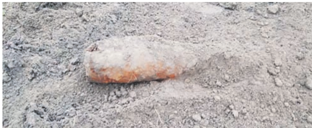
Tak wyglądał znaleziony w ziemi pocisk.