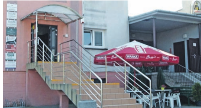
Fasada budynku na działce przy Kaliskiej 5.

Nie chodzi tu o całość zakupionej w 2014 roku działki, ale o wydzieloną z niej część (ok. 1/3 powierzchni, niecały hektar), z budynkami hotelu i restauracji. Budynki te wymagają generalnego remontu, na jaki miasto w tym momencie nie stać.