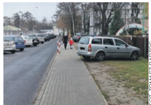
Ulica Nowa ten fragment ma być przebudowany, po prawej stronie ma powstać zatoka postojowa na siedem aut.

Po drugiej stronie ulicy, pod klasztornym murem, projekt zakłada stworzenie – na odcinku około 120 metrów, bo tyle tylko ulegnie przebudowie – 10 miejsc parkingowych (parkowanie ukośne), w tym jednego dla osób niepełnosprawnych. tb