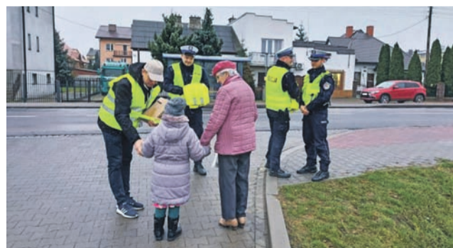
Policjanci z łowickiej komendy rozdawali odblaski przy ulicy Łęczyskiej.

nionych uczestników ruchu drogowego i zachęcanie do noszenia elementów odblaskowych. Spotkali przez policjantów cykliści i piesi otrzymywali kamizelki odblaskowe oraz opaski ufundowane przez Wojewódzki Ośrodek Ruchu Drogowego w Skiernie-