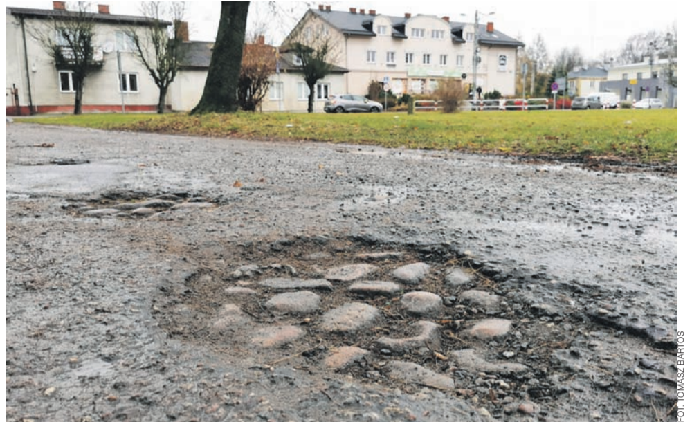
Dziurawa nawierzchnia w ulicy od zachodniej strony rynku ujawnia stary bruk. W przyszłości ma być on uwidoczniowany w określonym miejscu.

Gmina zdecydowała o szukaniu nowego wykonawcy, niestety dwa przetargi się nie powiodły – ostatecznie 16 listopada otworzono oferty w trzecim. O zleceniu