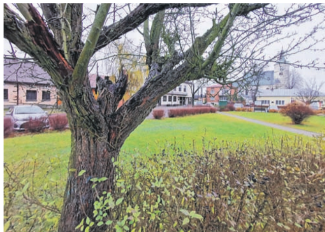
Jeden ze starych głogów rosnących na bolimowskim rynku, który zostanie wycięty i zastąpiony nowym.