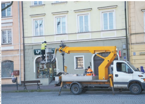
Montowanie iluminacji na Starym Rynku w Łowiczu.

Na zlecenie Urzędu Miejskiego firma Satek z Piotrkowa Trybunalskiego zamontowała w ubiegły czwartek, 25 listopada, świąteczne dekoracje na stylizowanych latarniach w Łowiczu. Tego dnia po zmroku rozbłysnęły te same dekoracje w kształcie gwiazdek, które znamy w Łowiczu od lat i wydaje się, że to może być ostatni sezon ich eksploatacji. Jest ich kilkadziesiąt. Zdobią one Stary Rynek, ul. 3 Maja i Nowy Rynek. Na Starym Rynku pojawiła się też iluminacja drzew. Łańcuchy z lampkami z poprzedniego sezonu pozostały na drzewach, ale dodane zostały jeszcze nowe lampki. mwk