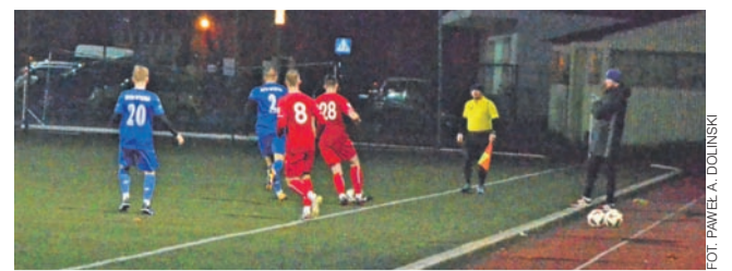
Zryw Wygoda w pierwszej połowie prowadził 1:0, gorzej było po przerwie.