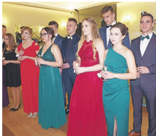
To zdjęcie wykonaliśmy na studniówce ZS nr 1 w Bratoszewicach 11 stycznia 2020 roku.