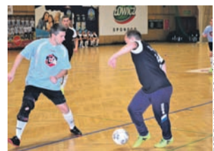
Na najwyższym szczeblu łowickiej halówki zameldowało się dziesięć zespołów