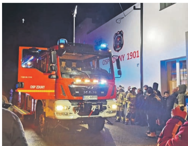
Nowy samochód jednostki OSP Zduny pod remizą witała liczna grupa strażaków i mieszkańców;

MAN wjechał do Zdun drogą krajową nr 92, z włączonymi sygnalami świetlnymi i dźwiękowy-