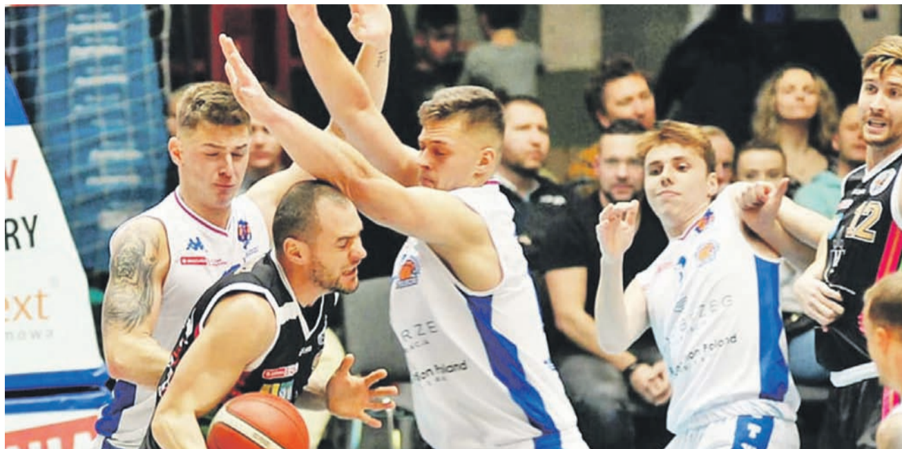
Obrona Kotwicy okazała się za szczelna dla naszych zawodników

Miejscowi już w pierwszej kwarcie wypracowali sobie 10 oczek przewagi i widać było, że są dobrze przygotowani do tego pojedynku. Księżacy w tym sezonie