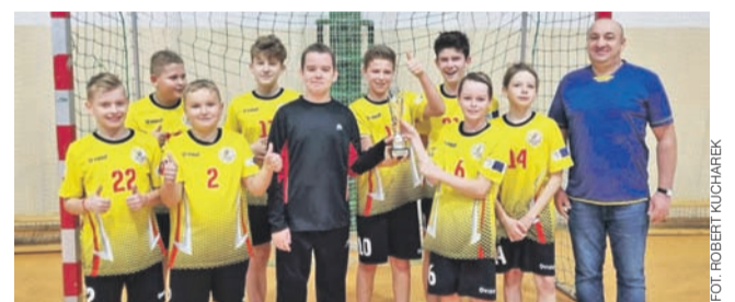
Mistrzami powiatu w piłce ręcznej zostali uczniowie z SP Bielawy.