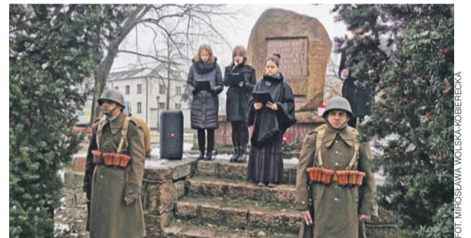
Pod pomnikiem Artura Zawiszy Czarnego wystąpili uczniowie Szkoły Podstawowej nr 7 w Łowiczu.

Podczas uroczystości zabrzmiała muzyka Fryderyka Chopina, a krótkie prelekcje wygłosili Katarzyna Sierska-Pięta oraz Zdzisław Kryściak. Program artystyczny przedstawili uczniowie Szkoły Podstawowej nr 7 im Jana Pawła II w Łowiczu.