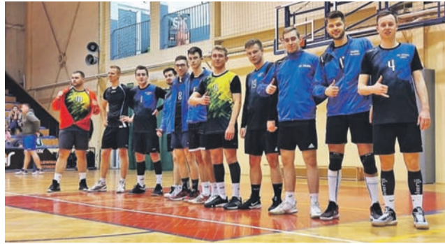
Korabka „idzie niczym burza”, nie dając szans żadnej drużynie.