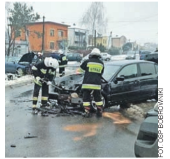
Działania straży po kolizji.

Ze ustaleń policji wynika, że kierujący Volkswagenem Passatem nie ustąpił pierwszeństwa przejazdu podczas skrętu w lewo. Tym samym doprowadził do czołowego zderzenia z BMW. Za kierownicą Passata siedział 41-letni mieszkaniec powiatu łowickiego, BMW kierował 19-latek, również z powiatu łowickiego. W żadnym z pojazdów nie było pasażerów.