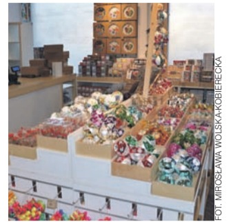
Na kilka dni przed otwarciem sklepu było w nim już wszystko przygotowane na przyjęcie klientów.

W tym roku firma opracowała program franczyzowy. Dzięki niemu w różnych miejscach