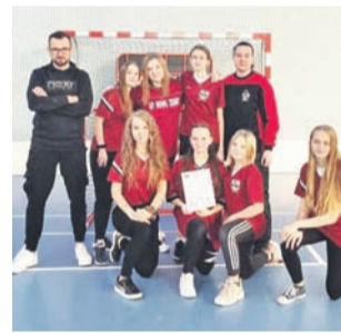
Dziewczyny z SP Nowe Zduny zagrają w Finale Wojewódzkim w Sieradzu.