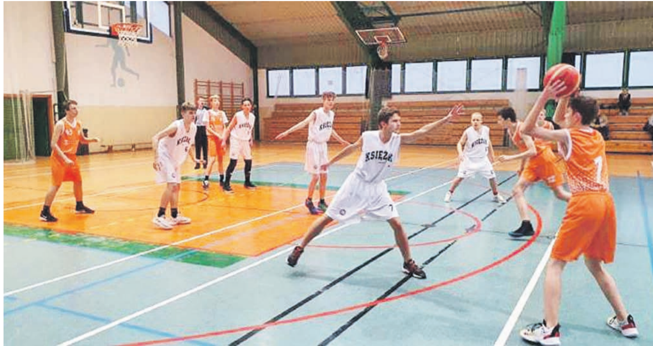
Książacy nie zdołali pokonać AZS PWSZ Skierniewice

Książacy zaczęli mecz nie najgorzej. Mieli problemy ze skutecznością, ale to samo trapiło rywali i po 10 minutach był wynik 12:11. W drugiej odsłonie zaczęło się obiecująco. Łowiczanie tra-