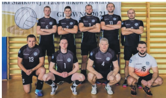
ŁAGS Awanturnik wygrał po raz kolejny turniej w Głownie