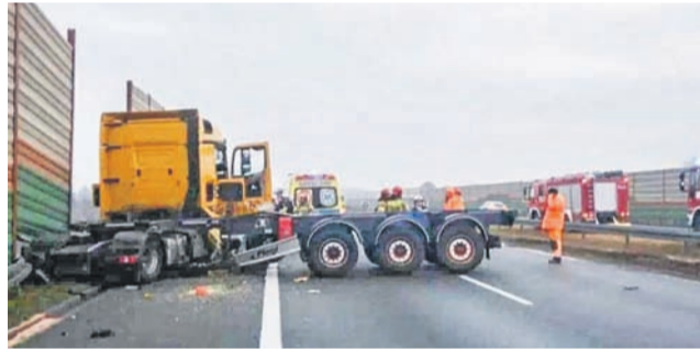
TIR uderzył w ekrany i stanął w poprzek jezdni.

28 listopada około godz. 6.00 doszło do zderzenia pięciu pojazdów na 406 km autostrady A2 – na wysokości Bolimowa. Pas w kierunku Poznania był całkowicie zablokowany do południa – potem udało się drogę udzielić. Utrudnienia zakończyły się jednak dopiero przed godz. 16.00.