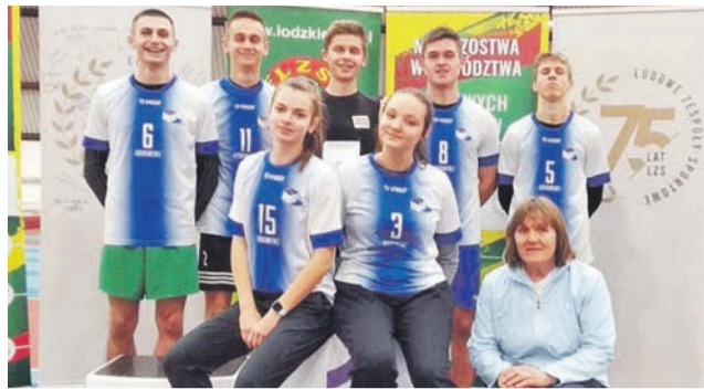
Ekipa II LO Łowicz przywiozła ze Spawy aż sześć medali

Złoty medal w konkursie skoku w dal z wynikiem 4,78 m wywalczyła, trenująca na co dzień w UKS Błyskawica Domanie-