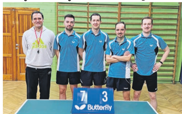
Ekipa UMKS Książak Łowicz w pierwszej rundzie wygrała 9 spotkań i zajęła wysokie 4. miejsce.

– W grach podwójnych drużyny podzieliły się punktami –