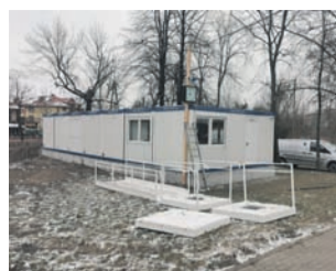
Tymczasowy, kontenerowy dworzec, w jego wnętrzu trwa podłączanie instalacji.