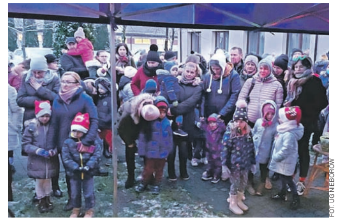
Rodzice z dziećmi w czasie oczekiwania na paczki od Mikołaja.

gminnych i z darów przekazanych przez sponsorów.