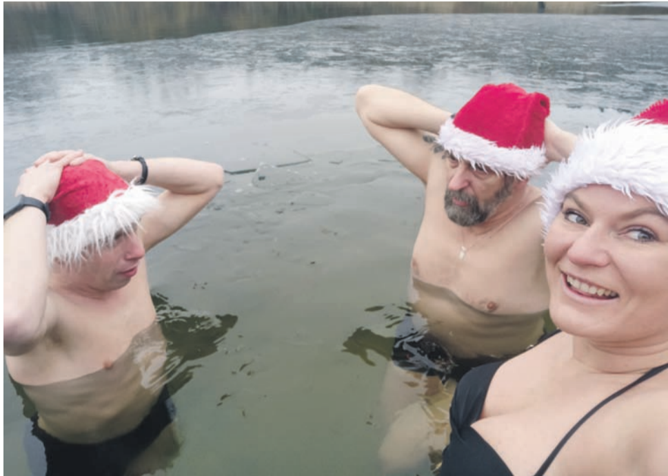
Z okazji Mikołajek wszyscy zabrali na morsowanie czapki mikołajowe.

– Przed wejściem do wody należy się rozgrzać, ale nie gorącą herbatą, a ćwiczeniami fizycznymi i stopniowo się rozbiierać. Do wody wchodzimy powoli, ważne jest opanowanie oddechu – nale-