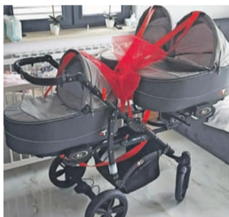
Wózek dla trojaczek podarowany przez gminę Nieborów.

Wójt cieszy się, że te wyjątkowe i rzadko spotykane narodziny trojacz-