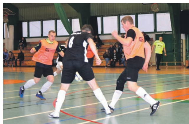
Iskra (czarne stroje) skromnie, ale wygrała.