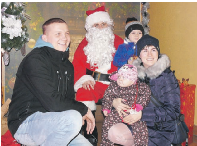
Świąteczny pluszowy renifer, baton, cukierki czekały na dzieci na osiedlu Zatorze, 5 grudnia z okazji Mikołajek. W sumie przygotowano zestawy dla 200 dzieci. Upominki wręczał Mikołaj w zaaranżowanym świątecznym pomieszczeniu świetlicy na boisku Orlik, z którym dzieci, czasem całe rodziny, mogły uwiecznić się na zdjęciu tb