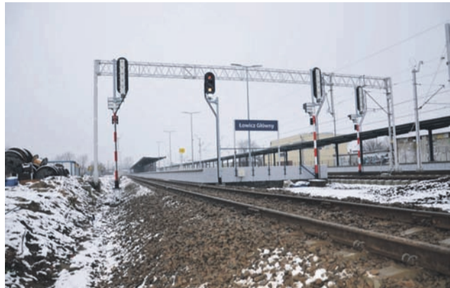
Peron 2 na dworcu PKP Łowicz Główny (po lewo) zostanie uruchomiony najpierw dla pociągów ŁKA, potem – także dla innych.

Jak sami sprawdziliśmy, połączeń do Warszawy w nowym rozkładzie (w dzień roboczy) będzie 16, gdy dotychczas było ich 11. Dobrych wiadomości nie ma jednak wiele, ponieważ czas dojazdu np. do Warszawy Centralnej nie zmieni się. Dotychczas wynosił on od 1 godziny i 46 minut (w przypadku IC Podlasiak lub TLK Zamowski) do 1 godziny 42 minut (w przypadku pociągu KM, który