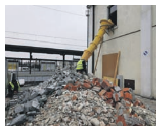
Na piętrze budynku dworca Łowicz Główny trwa wyburzanie ścian działowych.

Sam burmistrz mówi, że nie ma sobie nic do zarzucenia w tej sprawie, natomiast pełnej odpowiedzi na zarzuty ze skargi udzieli w swoim czasie. tm