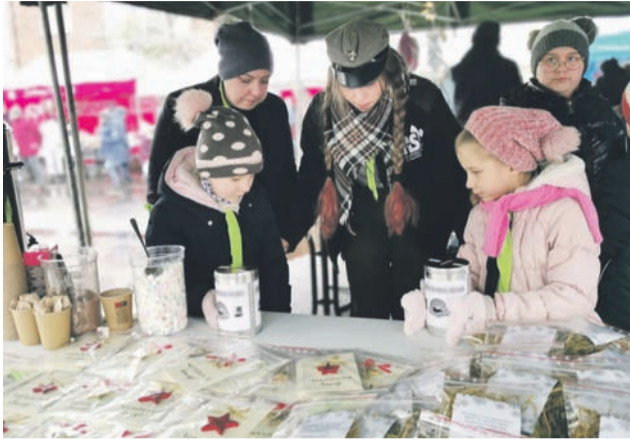
17 Gromada Zuchów „Pracowite Mróweczki” na jarmarku oferowała sianko na wigilijny stół i karty świąteczne.

lokalni. Z powodu ograniczonego miejsca ośrodek odmówił wielu chętnym spoza gminy.