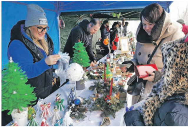
Na bolimowskim jarmarku można było kupić stroiki, ozdoby choinkowe, praktycznie wszystko buduje nastrój świąt w domu.