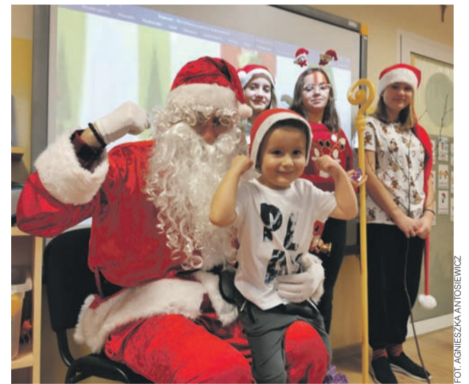
Każdy chciał mieć zdjęcie ze Świętym Mikołajem.

W pierwszej kolejności Mikołaj i jego pomocnicy udali się na spotkanie z dziećmi z oddziałów przedszkolnych. Przedszkolaki długo przygotowywały się do tej wizyty, nauczyły się wierszy i piosenek, a nawet założyły mikołajowe czapki. Gdy tylko Mikołaj wchodził do jakiejś sali, dzieci reagowały okrzykami radości. Radość była ogromna, tym bardziej, że każde dziecko miało chwilę na osobiste spotkanie z Mikołajem i otrzymało od niego prezent. Świąteczny gość okazał się bardzo dowcipny i chętnie pozował do zdjęć. aa