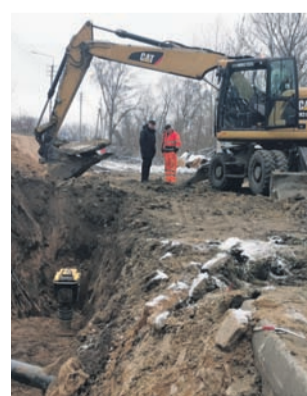
Aktualnie pracownicy Trakt realizują uzbrajanie w media łącznika ul. Nieborowskiej i Dworcowej, w dalszej kolejności zostanie tam wykonana podbudowa i nawierzchnia.