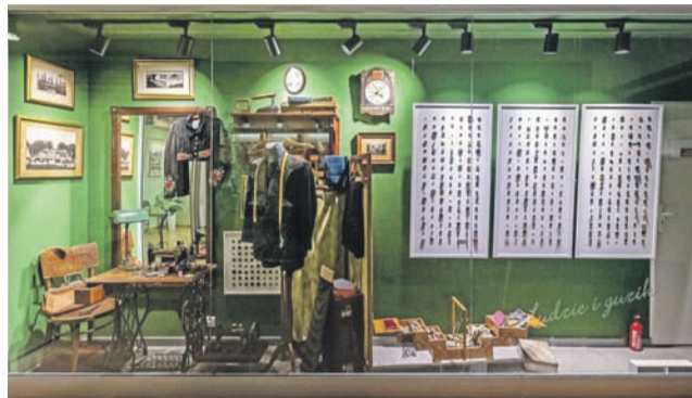
Tak wyglądało Muzeum Guzików w Galerii Łowickiej. W nowej odsłonie zobaczymy je już lada dzień.

Muzeum Guzików Jacka Rutkowskiego jest zaliczane do naj-