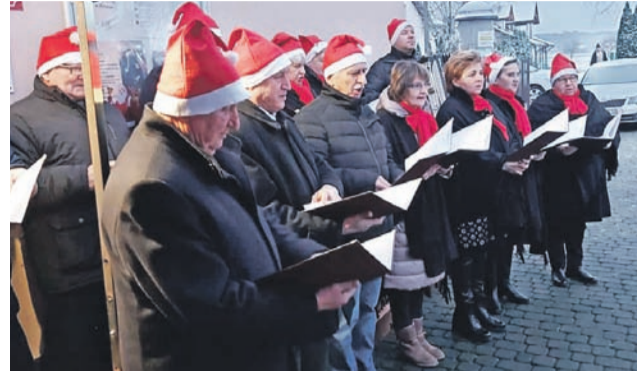
Gminną choinkę uświetnił występ Zespół Wokalny „Bednary”, który zaśpiewał kolędy.

– Przygotowaliśmy 400 paczek, w każdej znalazła się maskotka dla dzieci i słodycze, rozdaliśmy niemal wszystkie. Niestety część dzieci i rodzin było na kwarantannie i nie mogli przyjechać – powiedział nam wójt. Paczki zostały skompletowane z pieniędzy