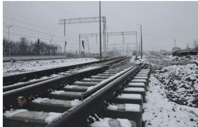
Prace przy modernizacji linii kolejowej z Łowicza do Łodzi jeszcze się nie skończyły. Tak wyglądało 27 listopada rozgałęzienie torowiska w kierunku Łodzi i Warszawy.

Najważniejszą zmianą, którą wprowadzi nowy rozkład jest jednak przywrócenie połączenia między Łowiczem Głównym a Łowi-