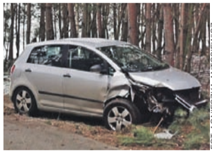
Sprawca kolizji na drodze pomiędzy Zawadami a Bobrownikami był pijany.

CZWARTEK 9 grudnia 2021 | NR 49 (1484) | Rok XXXI | ISSN 1231-479x