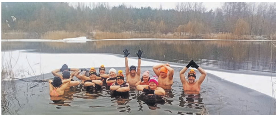
Łowickie morsy wchodzą do wody regularnie, co najmniej raz w tygodniu.

Łowickie morsy dbają o bezpieczeństwo i zawsze wchodzą do wody w grupie, pomagają nowym osobom i pilnują ich podczas pierwszego wejścia. ■