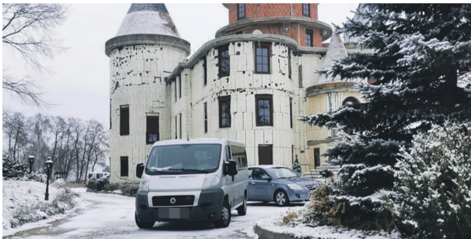
Policyjne samochody przed domem, w którym doszło do tragedii.

Cały czas pracujemy nad odtworzeniem przebiegu zdarzenia – mówił nam kilka godzin później prokurator Krzysztof Kopania, rzecznik Prokuratury Okręgowej w Łodzi. Jest jeszcze zbyt wcześnie, aby wyciągać wnioski. Na miejscu prokurator, policjanci i biegli prowadzili oględziny i zabezpieczali ślady. Z dotychczasowych wstępnych ustaleń wynika, że 49-latek poniósł śmierć w następstwie rany postrzałowej. Kobieta z raną postrzałową i ranami kłutymi nóg trafiła do szpitala. Jej stan jest stabilny. Została zatrzy-