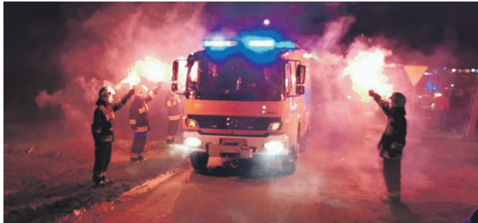
Mercedes Atego wjeżdża przed strażnicę w Złakowie Borowym.