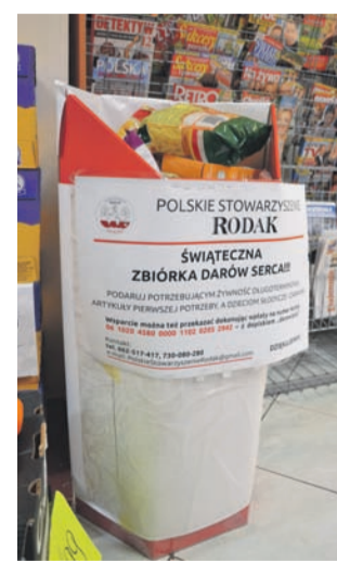
Kosze stowarzyszenia są oznakowane, więc łatwo można je rozpoznać (zdjęcie z Gamy przy ul. 11 Listopada).

W tych samych sklepach można też zostawiać podarunki dla 31-letniej mamy dwójki dzieci, która padła ofiarą przemocy domowej i została sama z dziećmi. Potrzebne są dla niej i dla dzieci: buty w rozmiarze pow. 25, ubranka dla dziewczynki w rozmiarze 104 wwyż, ubranka uniwersalne dla noworodka, pampersy w rozmiarach 2-3, 5-6, chusteczki nawilżane, zabawki, książeczki, ko-