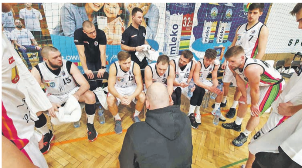
Książacy przegrali ważny pojedynek, ale już muszą myśleć o kolejnym spotkaniu, które trzeba wygrać.

■ 13. kolejka Suzuki I Liga Koszykówki Mężczyzn: KS Książak Łowicz – AZS AGH Kraków 90:99 , AZS UMCS Start II Lublin – KK Decka Pelplin 92:70, SKS Starogard Gdański – MUKS Sensation Kotwica Kołobrzeg 68:89, KKK Mia-