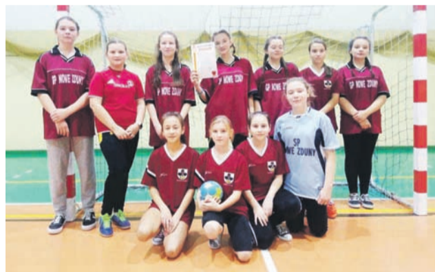
Uczennice SP Nowe Zduny wygrały Półfinał Wojewódzki

Rejonie Igrzysk Dzieci w piłce ręcznej dziewcząt: Wyniki: SP Dębowa Góra – SP