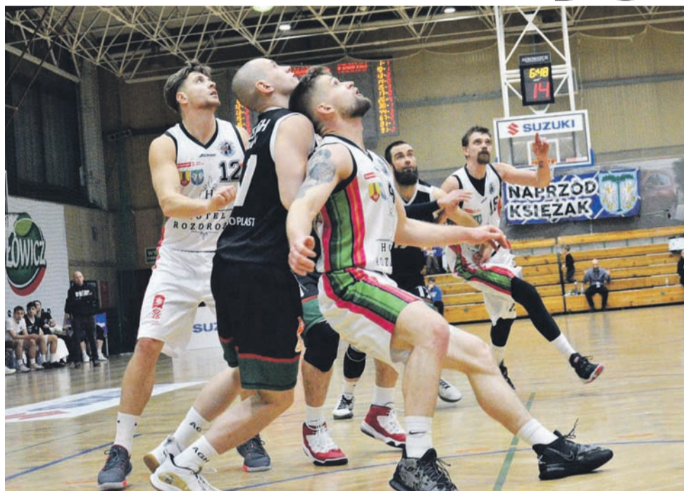
Książacy walczyli, ale zabrakło koncentracji w końcówce meczu

– Czekają nas mecze prawdy, więc w grudniu musimy bardzo mocno popracować, aby poprawić naszą pozycję w tabeli. Czekają nas kilka meczów, które po prostu musimy wygrać. To jest kluczowy