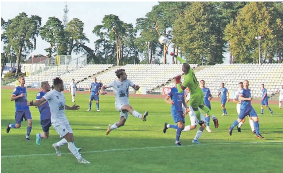
Pelikan był jedną z dwóch drużyn w tym sezonie, która potrafiła zdobyć punkty w wyjazdowym meczu z Bronią.

Nieco bardziej zawiła w tym sezonie będzie kwestia spadków. W tej chwili poza wspomnianymi przed chwilą Wissą i Mamrami z ligi zdegradowane byłyby Sokół i Pelikan. Jednak na tym poziomie rozgrywkowym trzeba jeszcze skontrolować to, co dzie-