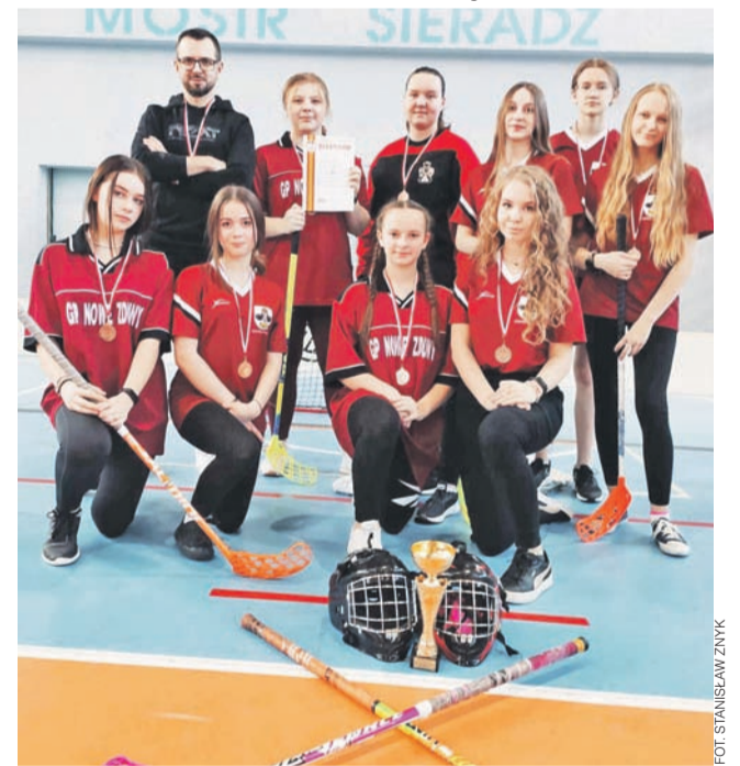
Brązowe medale to wielki sukces dziewczyn z SP Nowe Zduń

– Trafiliśmy niestety na 3 drużynową grupę. Mecze trwały 3 teryje x 6 min. Kto zajął 1. miejsce grał w finale, drugi grał o brąz, a 3. drużyna zajmowała