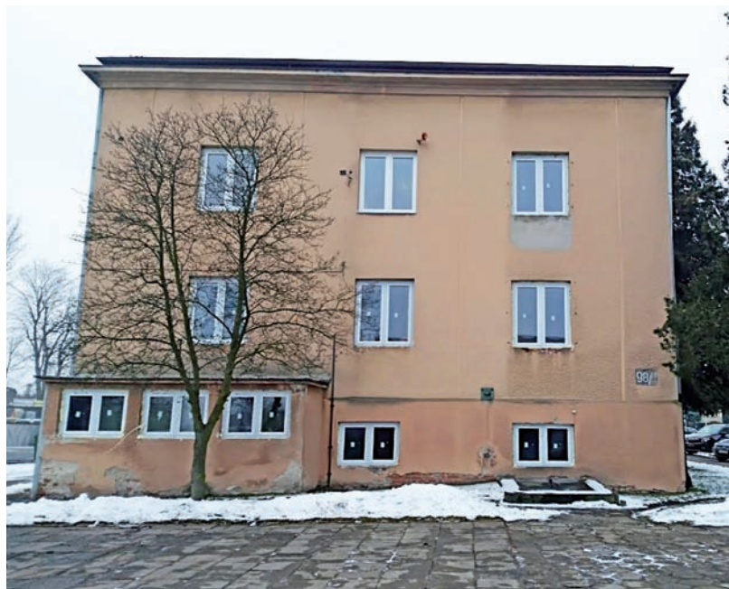
Budynek przy Norblina zmienia się z dnia na dzień. W ramach trwającej termomodernizacji przeprowadzono wymianę okien.

Dość szybko posuwają się naprzód prace termomodernizacyjne realizowane obecnie na terenie budynku Urzędu Miejskiego w Głownie przy ul. Norblina 1. Docelowo działania obejmą docieplenie ścian piwnic i ścian fundamentowych, a także ścian nadziemia i stropu stropodachu. Podobnie, jak w przypadku przedszkoli miejskich, projekt uwzględnia również montaż nowej instalacji c.o. wraz z grzejnikami, dostawą i montażem kotłowni. Przewidziane jest ponadto wykonanie wewnętrznej oraz doziemnej instalacji gazowej. Roboty już ruszyły, a aktualnie trwa w tym miejscu wymiana okien. Działania realizuje firma Szwałkiewicz ze Zgierza za kwotę 959.400 złotych, bo spośród 11 złożonych w trakcie procedury przetargowej ofert, to właśnie zaproponowana przez to przedsiębiorstwo okazała się najkorzystniejsza. Na inwestycję uzyskano dofinansowanie ze środków Unii Europejskiej w ramach ZIT Regionalnego Programu Operacyjnego Województwa Łódzkiego na lata 2014-2020. aw