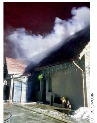
Pożar budynku widziany z zewnątrz.

Straż pożarna otrzymała telefoniczne zgłoszenie o pożarze o godzinie 22.23. Na miejsce zostało wysłanych łącznie 7 samochodów ratowniczo-gasnicych z pełną obsadą: 3 zastępy JRG ze Strykowa (w tym podnośnik koszowy),