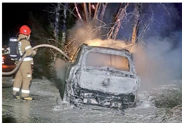
Samochodu nie udało się uratować, ale kierowca nie odniósł obrażeń.

wzwał straż i próbował we własnym zakresie gasić pożar, ale nie udało się. Gdy strażacy dotarli do Lubowidzy pożar był już rozwinięty i obejmował cały samochód. mak