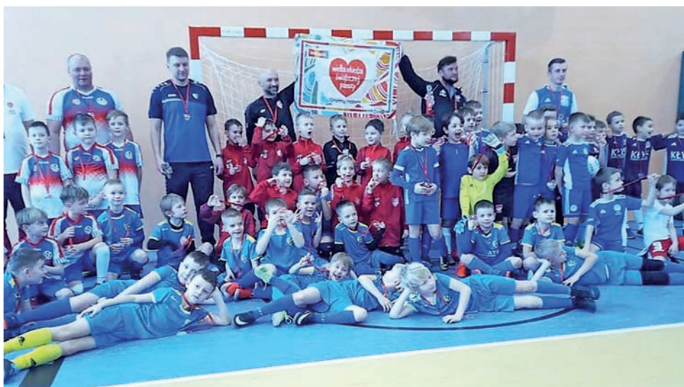
Młodzi piłkarze jednego z turniejów „Dzieci Dzieciom”, który po raz kolejny odbył się w ramach WOŚP.

Sobota, 30 stycznia została zdominowana przez piłkę nożną i najmłodszych sportowców, którzy ochoczo wzięli udział w Turnie-