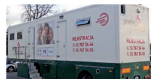
Mammobus zaparkuje za Urzędem Miejskim w Strykowie.

na nie już teraz, bowiem poprzednie cieszyły się bardzo dużym powodzeniem i wolne miejsca skończyły się na kilkanaście dni przed terminem ich wykonania. To druga w tym roku wizyta mammobusu w Strykowie. Po raz pierwszy przyjechał 21 stycznia. str. 5