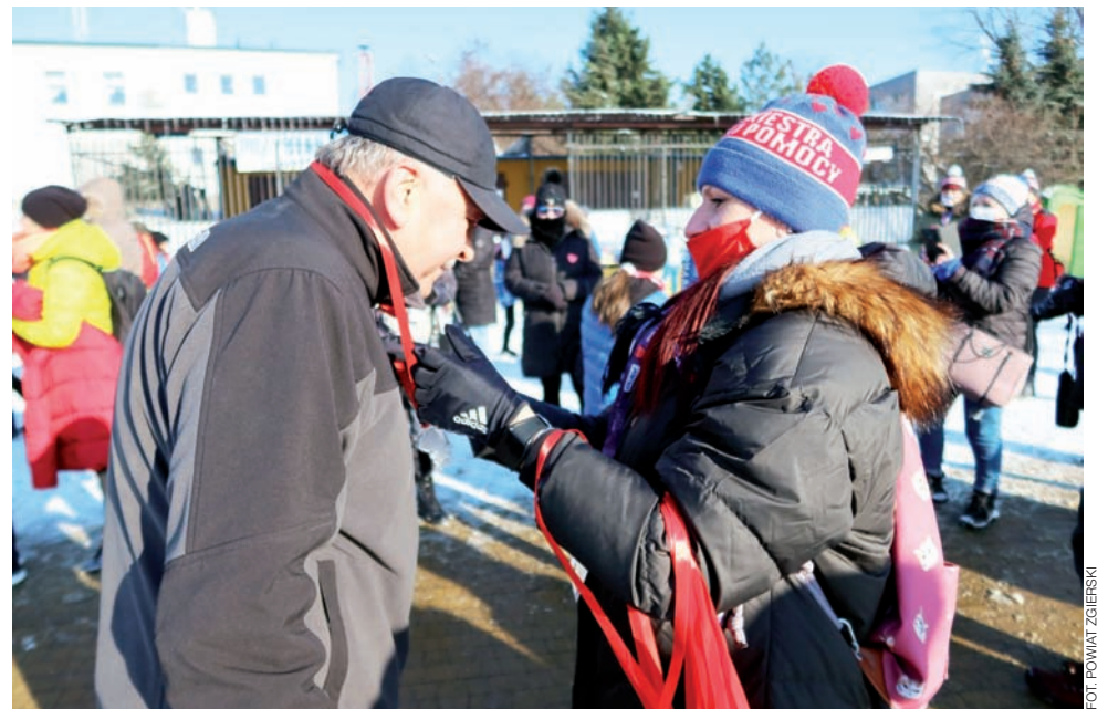
Podczas wielu atrakcji sportowych, o których szeroko piszemy na stronie 31, można było wrzucić pieniądze do puszek wolontariuszy.