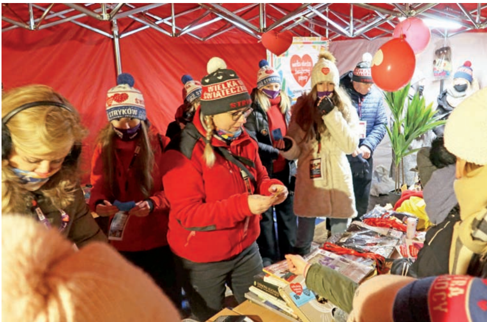
318 cegiełek, które można było zakupić na orkiestrowym kramiku w Strykowie rozeszło się w niecałą godzinę.