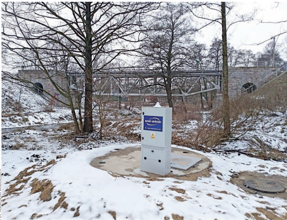
Jeszcze kilka miesięcy temu w tym miejscu stał niewielki budynek. Dziś tak prezentuje się przepompownia.