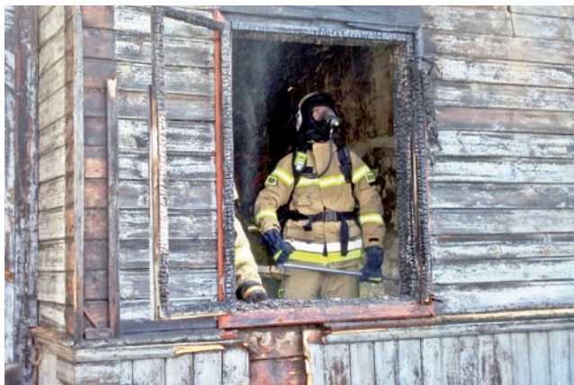
Strażacy musieli rozebrać część nadpalonego deskowania, żeby dostać się pomiędzy tynk a drewnianą ścianę pokrycia zewnętrznego i ugasić tłące się elementy.

– Gdy dojechalismy na miejsce, zastaliśmy wszystkich lokatorów na zewnątrz budynku oraz już rozwinięty pożar w jednym pomieszczeniu na parterze – powiedział nam zastępca dowódcy KRG Stryków Grzegorz Szkup. Płomienie już wydostawały się przez jedno z okien w mieszkaniu. Strażacy ubrani w aparaty