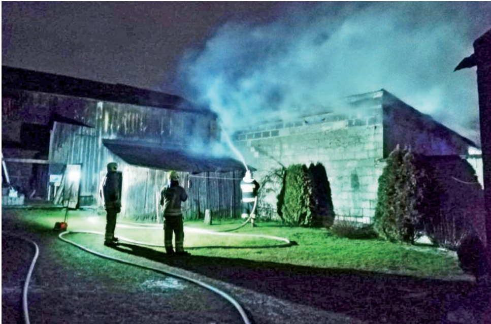
Miejsce zdarzenia. Strażacy działali kompleksowo: z jednej strony gasili pożar, z drugiej zabezpieczali okolicę, by ogień nie rozprzestrzenił się.

Dodajmy, że w garażu znajdowały się butle z acetylenem oraz tlenem. W trakcie zdarzenia doszło do rozszczelnienia butli z acetylenem i to właśnie z uwagi na zagrożenie, jakie mogło ono spowodować, podjęto decyzję o ewakuacji 9 osób, czyli mieszkańców najbliższej okolicy. Znaleźli oni schronienie u sąsiadów oraz rodziny. Dodajmy, że butle z acetylenem najpierw schłodzi-