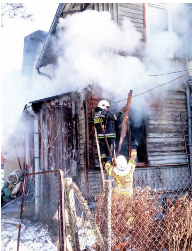
Ogień na szczęście nie rozprzestrzenił się, ale mieszkania na piętrze budynku zostały poważnie zadymione.

Sąsiad otworzył drzwi i wyprowadził z mieszkania starszą kobietę, która najpierw we własnym zakresie próbowała gasić ogień, ale już osłabła, prawdopodobnie od dymu, którego się zdążyła nawdychać.