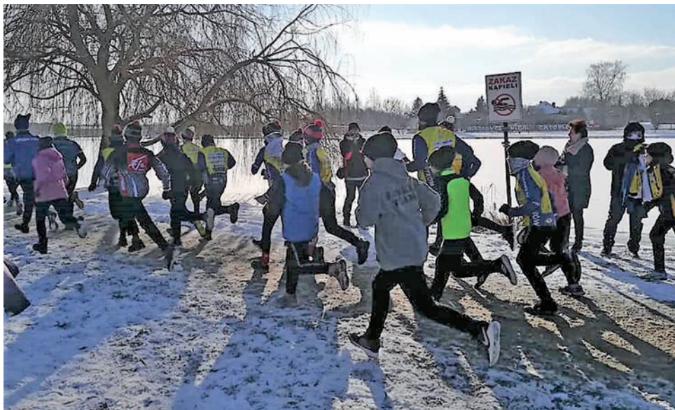
V edycja Biegu po Zdrowie po Strykowie po raz pierwszy odbyła się nad zalewem. Tym razem do rywalizacji przystąpiło 128 osób, w tym wiele dzieci i młodzieży. Mimo mrozu warunki do biegania były wymienne.