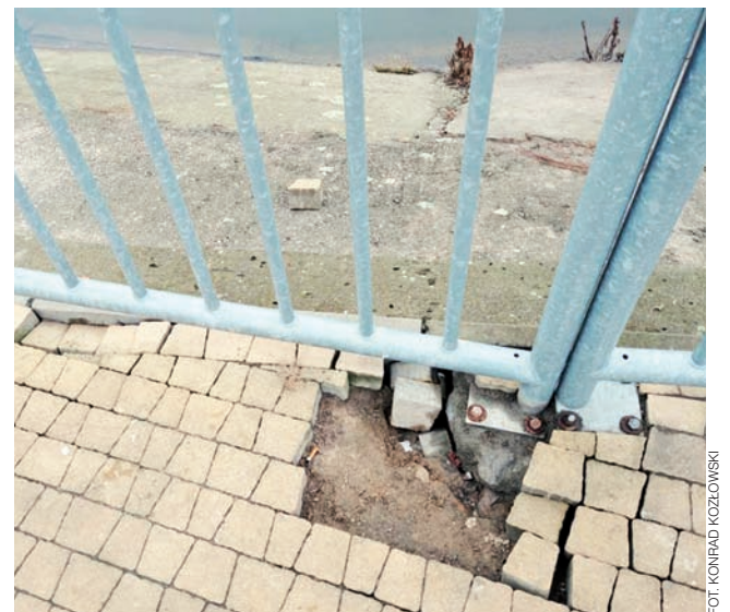
Nie wiadomo czy to głupi pomysł sobotniej nocy, czy zamierzone okrucieństwo, ale takie zachowanie należy piętnować.

Mężczyzna okazał się 24-letnim obywatelem Mołdawii. Został niezwłocznie zatrzymany. Postawiono mu zarzut kierowania pojazdem mechanicznym w stanie nietrzeźwości. aw