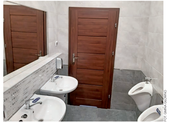
Dzięki przeprowadzonym remontom blasku nabrała m.in. łaźienka.

W ciągu minionych dwunastu miesięcy spadła również liczba mieszkańców gminy Dmosin. Jak informuje tamtejszy urząd gminy, liczba ludności na koniec 2020 roku kształtowała się na poziomie 4.369 osób. Dla porównania, rok wcześniej wynosiła ona 4.393. W trakcie minionego roku dokonano w tej gminie 63 zameldowań i 70 wymeldowań. Liczba małżeństw zawartych w tym czasie wynosi 19. Mieszkańcy wspomnianej gminy powitali w ubiegłym roku na świecie 46 dzieci. Odnotowano 63 zgony. aw