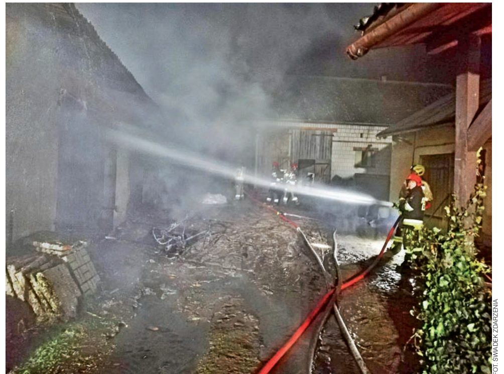
W wyniku pożaru nikt nie odniósł obrażeń, ale ze względu na zagrożenie, konieczna była ewakuacja mieszkańców pobliskich posesji.

Jak to dobrze, że w Dobrej, Kiełminie i Strykowie, obok „zawodowców”, szkoleni są strażacy z ochotniczej straży... Gratuluję panowie! Około 23.30, w nocy, wyłączono nam we wsi prąd. Znow się ubrałem i poszedłem na drogę, by sprawdzić co się dzieje. Spojrzałem w lewo i zobaczyłem ciągle migające niebieskie światła. Gdy podszedłem pod miejsce pożaru, okazało się, że PGE musi odłączyć prąd z gospodarstwa, w którym się paliło. Takie są przepisy. A mieszkańcy z palącego się siedliska i ich sąsiedzi z jednej i z drugiej strony musieli też opuścić swoje domy, bo butle teoretycznie ciągle groziły wybuchem. Część z nich zamieszkała na tę noc u sąsiadów, a pozostali rozjechali się „po rodzinie”. Kilka minut po dwunastej podłączono we wsi prąd. Jakie przemyślenia po rozmowie ze strażakami? Ja tylko piszę o Ługach. Wieś długa, a tylko trzy hydranty i to w centrum. Trzy stare hydranty, w tym jeden z pękniętą śrubą. Mieszkańcy uważają, że zamontowanie nowych, dodatkowych we wsi, to priorytet. Polecamy to uwadze władz gminy i zakładu gospodarki komunalnej. Ktoś powiedział: „płacimy za wodę i chcemy mieć sprawne hydranty z wodą”. Na koniec: mieszkam tu dwadzieścia kilka lat. To był czwarty pożar w Ługach. Na szczęście bez ofiar i większych konsekwencji. A zabudowa jest u nas raczej zwarta. Wczoraj, na szczęście, nie było dużego wiatru... Składam wyrazy współczucia rodzinie z Ługów, na której posesji wybuchł pożar.