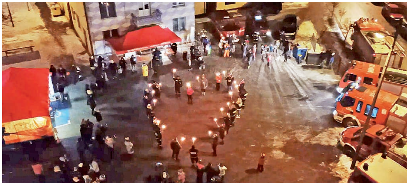
Na zakończenie strażacy z gminnych jednostek OSP „zrobili hałas”, a wolontariusze stanęli na placu tworząc serce.

Można było również zjeść znanego w całej gminie bigosu strażackiego, który przygotowali strażacy ze Strykowa oraz barszczu z pasztecikami przygotowanego