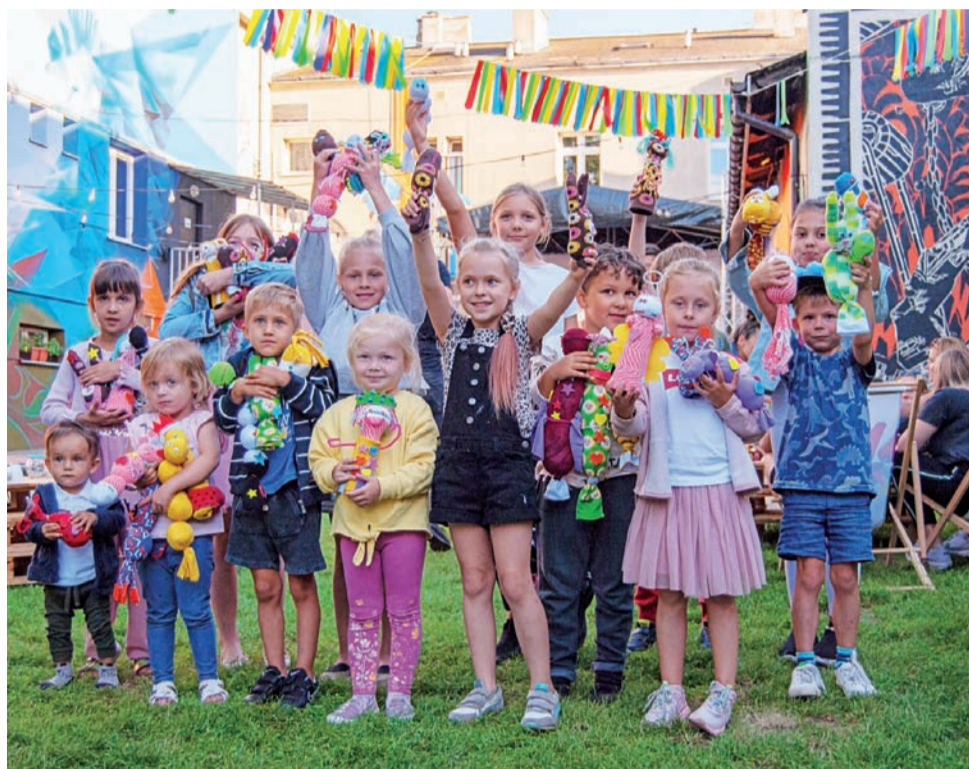
Zrównoważone pluszaki – warsztaty w Nowej Pracowni w 2020 roku.

■ EKO akcje na wakacje w Nowej Pracowni – inicjatywa, która otrzymała 4 tys. zł dofinansowania, zgłoszona została przez Darię Skopińską-Piętę. Projekt polega na cyklu warsztatów