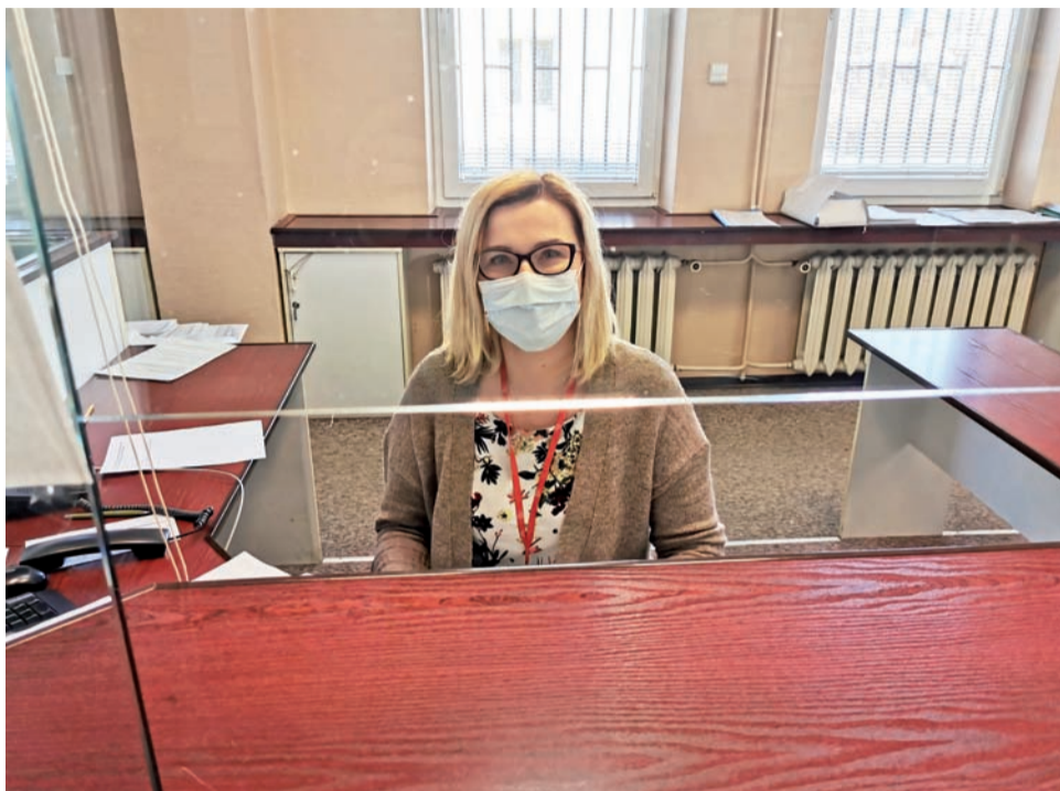
Urząd Skarbowy w Łowiczu działa w reżimie sanitarnym, ale jest otwarty dla interesantów.

Ale i tak raczej nie grożą nam kolejki do kas urzędu, jakie pamiętamy z jeszcze nie tak dawnych czasów. To dzięki ulepszeniom z roku na rok usługom internetowym, do których przekonała się już zdecydowana większość podatników. Już w tamtym roku na 29.061 wszystkich rozliczeń PIT-37 w Urzędzie Skarbowym w Łowiczu aż 24.984 zostało złożone drogą elektroniczną. Być może wpływ miała na to pandemia Covid-19, bo przecież w kwietniu obowiązywały u nas najcięższe restrykcje sanitarne. Można przy tym założyć, że rozliczenie w formie elektronicznej