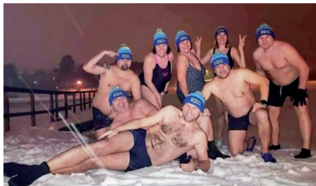
Pierwsze morsowanie w „strykowskich czapkach” już się odbyło. Urząd przekazał grupie 30 kompletów i nie wszystkie jeszcze zostały rozdysponowane.

W ubiegłym roku strażacy OSP Kiełmina wyjeżdżali aż 66 razy do akcji ratowniczo-gaśniczych (w tym do 14 pożarów, 37 miejscowych zagrożeń, 8 alarmów fałszywych oraz 7 razy byli dysponowali przez PSP w Zgierzu do tzw. „zabezpieczenia rejonu” w sytuacjach gdy strażacy zawodowi ze Zgierza i Strykowa wyjeżdżali do akcji). Była to największa ilość interwencji w trakcie roku kalendarzowego w historii jednostki. Co ciekawe, była to największa liczba wyjazdów wśród jednostek OSP z terenu miasta i gminy Stryków, 6. wynik w powiecie zgierskim i 94. w skali województwa łódzkiego. mak