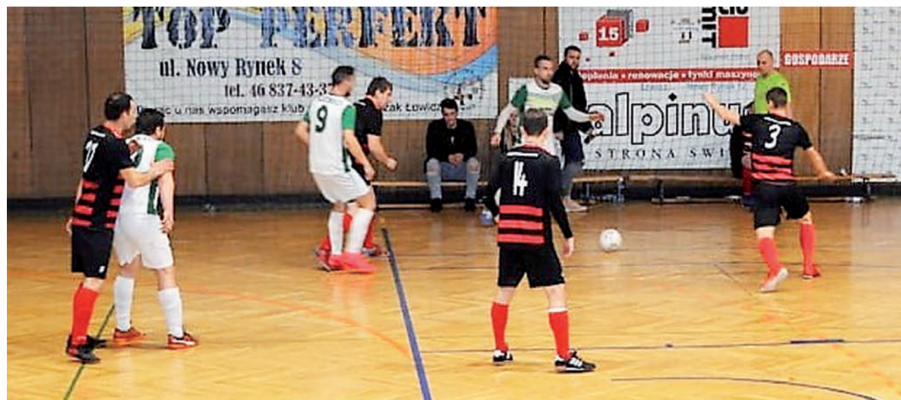
Błękitni II Dmosin (czarno-czerwone stroje) zastąpią pierwszą drużynę Dmosina w I Lidze ŁoLiF.

Z rozgrywkami Keeza II Ligi ŁoLiF żegna się ekipa KS Stefan Łowicz, a bardzo ciężką sytuację mają także piłkarze halowi Promil Let's Dance Dzierzgow.