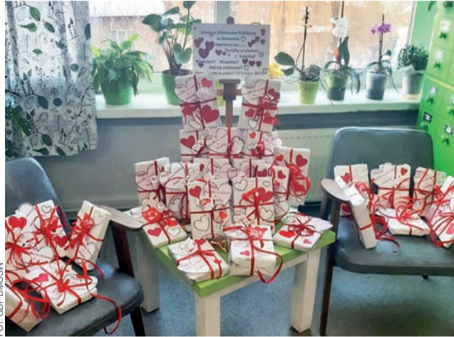
Zapakowane książki nie musiały długo czekać na wypożyczenie.

Co ciekawe, przekroję wiekowi czytelników, którzy je wypo-