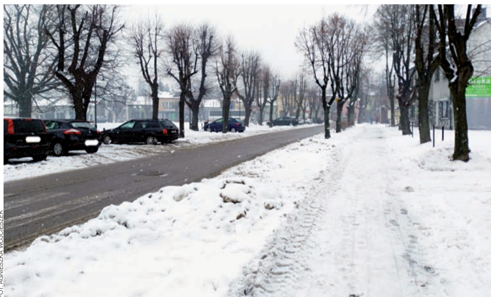
Tak wyglądała sytuacja w ubiegły czwartek przy Placu Wolności. Ulice okazały się przejezdne, ale spacer chodnikiem był już sporym wyzwaniem.

Na wszystkie wspomniane inwestycje uzyskano dofinansowanie ze środków Unii Europejskiej w ramach ZIT Regionalnego Programu Operacyjnego Województwa Łódzkiego na lata 2014-2020. aw