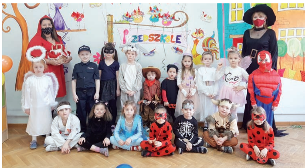
Dzieci i wychowawczynie przebrały się za ulubione postacie z bajek.