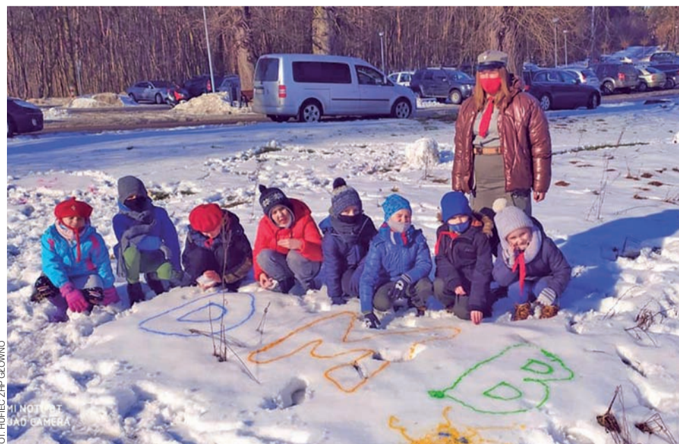
Gromada „Bystre oczy” z Domaniewic postanowiła świętować Dzień Myśli Braterskiej organizując zabawy na śniegu oraz ognisko.

przemiany serca i nowego sposobu myślenia. W jednym z fragmentów owego listu pojawia się jednak fragment, który może być zwiastunem zmian organizacyjnych w diecezji. „W tych wielkopostnych chwilach dzielę się z Wami koniecznością podjęcia niełatwych decyzji połączenia unią personalną małych parafii Kościoła łowickiego. str. 4