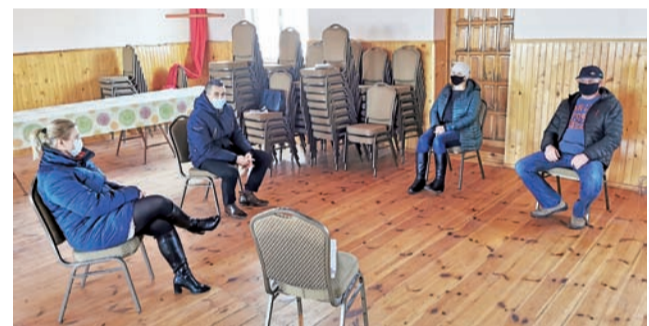
Spotkanie w Błędowie odbyło się w kameralnym gronie.

Gmina zastrzega, że realizacja programu będzie zależała od uzyskania dofinansowania. tm