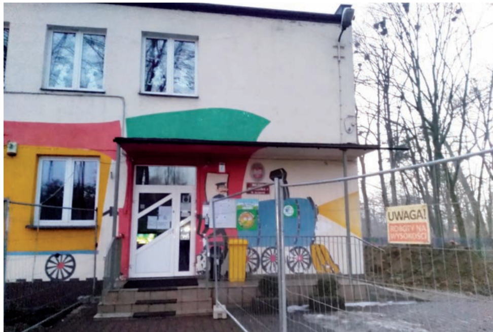
Prace termomodernizacyjne na terenie Miejskiego Przedszkola nr 1 w Głownie właśnie się rozpoczynają.

Zakres działań planowanych w ramach tej inwestycji we wszystkich placówkach będzie podobny. Obejmie on m.in. termomodernizację ścian piwnic i ścian funda-