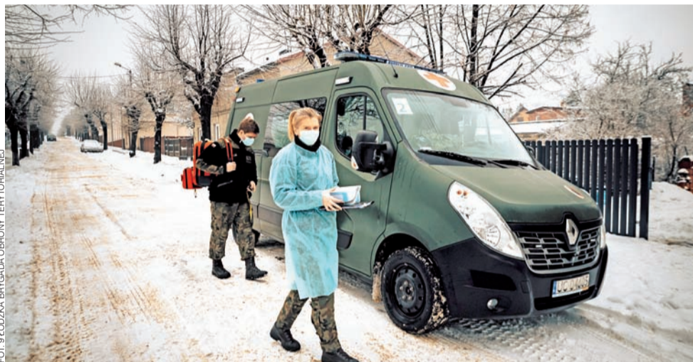
Wizyta mobilnego zespołu szczepiennego Terytorialsów.

Powiat łowicki | Jak będzie potrzeba, przyjadą i do nas