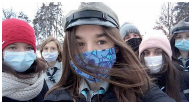
W Biegu Harcerza w Bratoszewicach wzięto udział kilka drużyn.

Ponadto w ostatnich dniach na zuchów i harcerzy czekały zajęcia w drużynach, zaliczanie stopni i sprawności harcerskich oraz