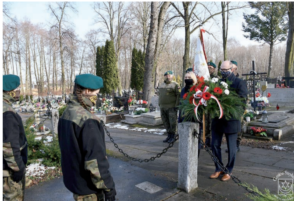
Uroczystości rocznicowe przybrały w tym roku skromniejszą formę, ale pamięć o bohaterach wciąż jest żywa.

Przypomnijmy, że Bitwę pod Dobrą stoczono podczas Powstania Styczniowego. Miała ona miejsce 24 lutego 1863 roku. aw