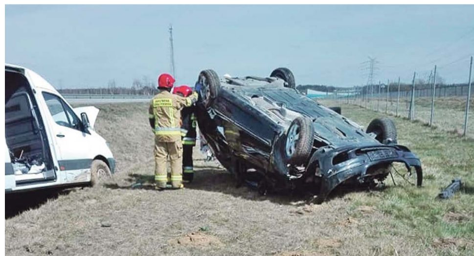
Jeden z samochodów dachował, ale uczestnicy zdarzenia nie odnieśli bardzo poważnych obrażeń.

Gdy druhowie przyjechali na autostradę, wszystkie osoby zdążyły już opuścić samochody.