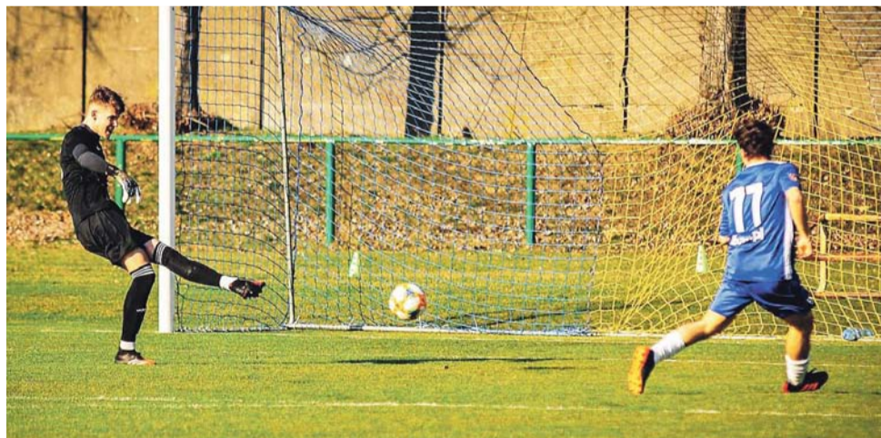
Piłkarze głowieńskiego beniaminka są na dobrej drodze, by sezon zakończyć w górnej połowie tabeli.

Z innych ciekawych spotkań Włóknarz Żelów po emocjonującym pojedynku wygrał z Jutrzen-