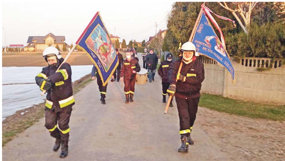
Strażacy z OSP Bednary Kolonia przeszli w lany poniedziałek z odnowioną chorągwią i sztandarem przez swoją wieś.

Z chorągwi tej udało się odzyskać i odnowić wizerunek św. Floriana, został wycięty i wszyty