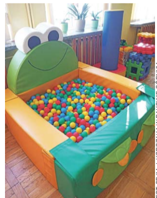
Dzieci w szkole w Bąkowie Górnym mogą korzystać już z nowoczesnego sprzętu.

W ramach projektu w Szkole Podstawowej im. Janusza Korczaka w Bąkowie Górnym powstał gabinet do terapii metodą biofeedback. Tam też, oprócz szkoły, działa przedszkole.