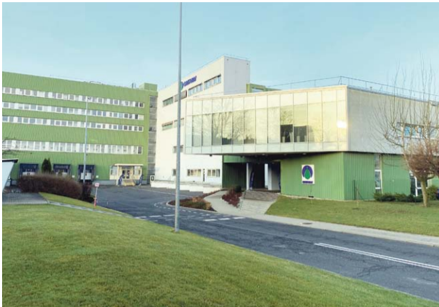
Zakład już po przejęciu, o czym świadczy napis i logo nowego właściciela – największej duńskiej firmy.

Obecnie Orifarm jest już największym w Europie importem równoległym produktów farmaceutycznych. Przejęcie potroi produkcję i sprzedaż leków generycznych dostępnych bez recepty i na receptę. Dzięki realizacji transakcji koncern staje się też największym wytwórcą leków bez recepty oraz największym duńskim dostawcą leków w Da-