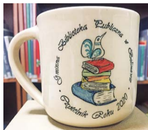
Wyjątkowe i niepowtarzalne kubki dla czytelników roku 2020.

Dane za 2020 rok mówią, że najaktywniejszy dorosły czytelnik wypożyczył ponad 300 książek, najmłodszy 120 książek. Za cały ubiegły rok liczba aktywnych czytelników wyniosła 592 (na ok. 4 tys. mieszkańców gmi-