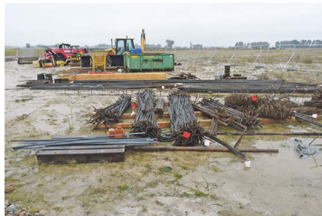
Opuszczony plac budowy w Piaskach Bankowych.