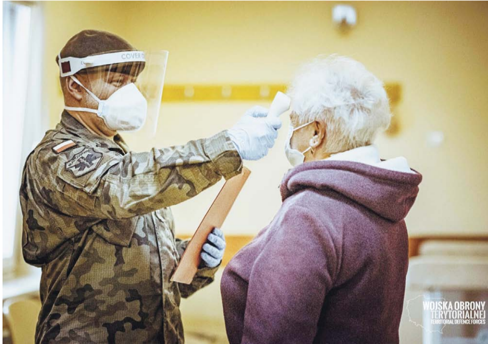
Żołnierze wykonują różne czynności, także np. pomiary temperatury.

Największą ilość pracy świadczą oni w szpitalach. Pracują w nich zarówno od strony logistycznej, pomagając w sprawnym funkcjonowaniu szpitali, jak i praktycznej, gdy razem z zespołami medycznymi zajmują się pa-