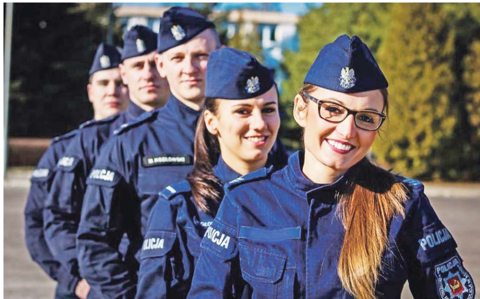
Takim zdjęciem policja zachęca, by przystąpić do procesu rekrutacji do służby.

Podczas webinaru omówione zostaną między innymi obecne przepisy dotyczące rekrutacji do służby w policji oraz przedstawiony zostanie proces