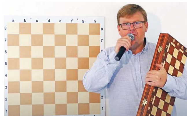
Kurs Szachowy dostępny jest w mediach społecznościowych Gminy Stryków. Łącznie zaprezentowano 24 internetowe lekcje.