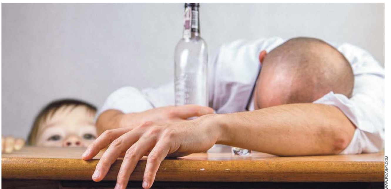
Choroba alkoholowa nigdy nie dotyka tylko jednej osoby, jej skutki odczuwa zwykle cała rodzina.

• Psychiczne – zależą od cech osobowości, które mają wpływ na częstotliwość sięgania po al-