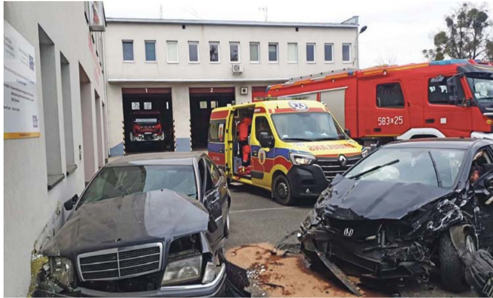
Zwykle strażacy wyjeżdżają do wypadków. W tym przypadku wydarzył się na ich terenie.

Honda uderzyła w trzy samochody, przy czym dwa z nich