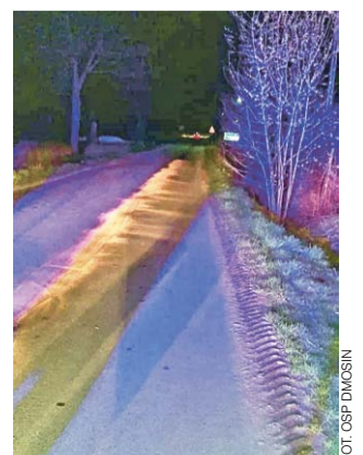
Do zutilizowania plamy trzeba było użyć kilka worków sorbentu.

Tym razem plama miała około 450 metrów, aby ją zneutralizować, strażacy musieli zużyć kilka worków sorbentu. Do usunięcia plamy, która mogła stwarzać zagrożenie dla samochodów z uwagi na śliskość, zostali wysłani w piątek, 9 kwietnia, w nocy, po godzinie 21.00. Akcja trwała około godzinę. Ponownie nie udało się stwierdzić z jakiego samochodu mogło dojść do wycieku. mak