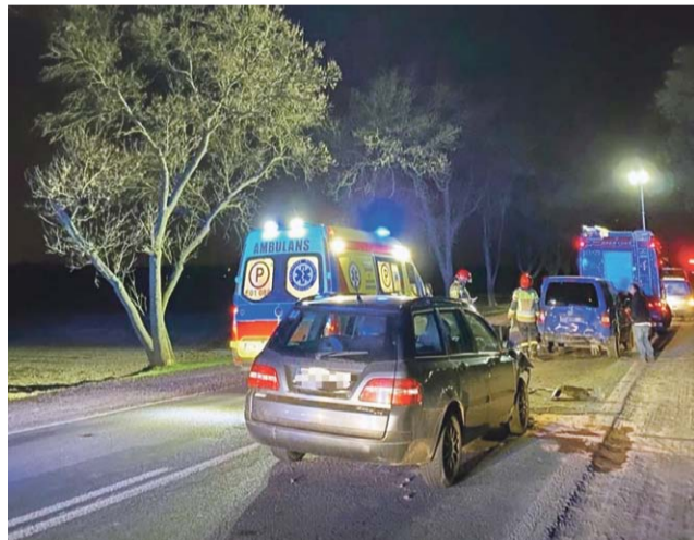
Najbardziej zniszczony był Fiat Stilo, a jego kierowca, który według wstępnych ustaleń spowodował wypadek, został zabrany do szpitala specjalistycznego śmigłowcem.

Fiatem kierował 63-letni mieszkaniec powiatu zgierskiego. Pozostawał przytomny, uskarżał się na silny ból w klatce piersiowej,