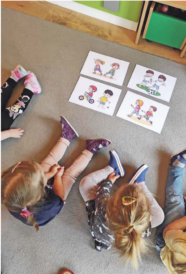
Ze względu na obostrzenia przedszkola oraz żłobki pozostają otwarte tylko dla dzieci służb medycznych i mundurowych.

Z większą grupą żłobek próbuje wracać do normalnego funkcjonowania, jednak czuć u dzieciaków tęsknotę za rówieśnikami. 7 kwietnia obchodzono na-