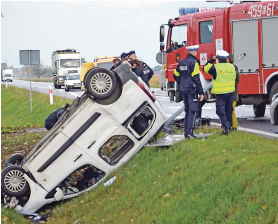
Peugeot Partner dachował w rowie przy DK 92. Zginął pasażer siedzący z tyłu, siedzący z przodu chciałby o tym zdarzeniu zapomnieć.

Panowały złe warunki jazdy – było ślisko, padał deszcz, kierowca natomiast jechał szybko, agresywnie i nerwowo.