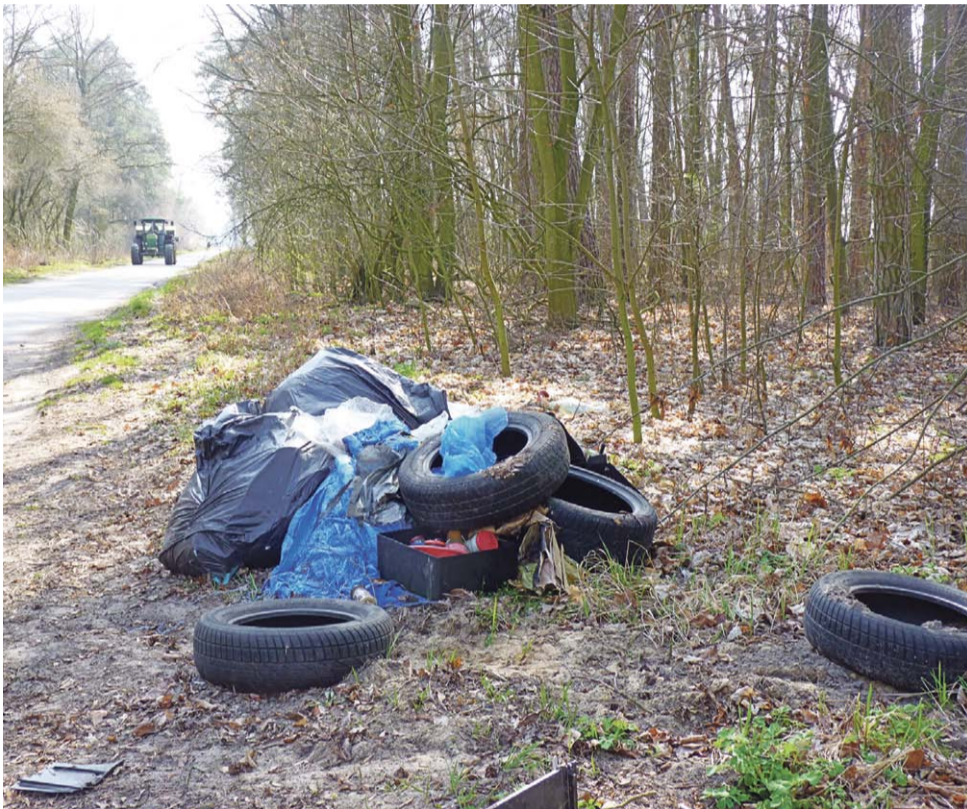
Takie obrazki w lasach, często na ich skraju, nie są, niestety, wspomnieniem sprzed lat.