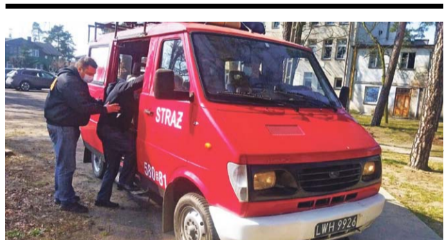
Strażacy z OSP Wola Zbrożkowa nie pierwszy raz dowieźli seniorów na szczepienia.

Dokładne okoliczności wypadku wyjaśniają policjanci, sfinalizowanie sprawy będzie możliwe dopiero po przesłuchaniu kierowcy busa, który jeszcze przebywa w szpitalu. Zarówno kierowca Opla, jak i ciężarowej Scanii, byli trzeźwi. mak