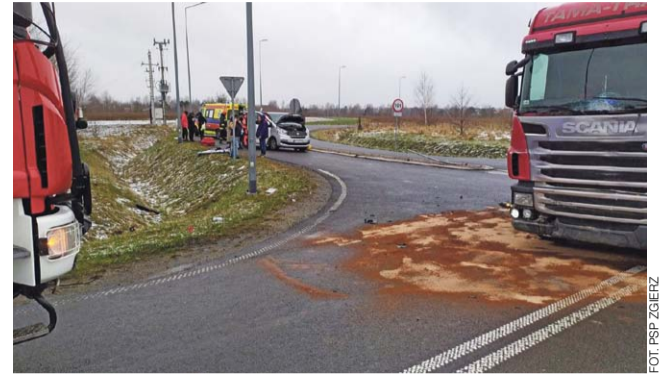
Do wypadku doszło na skrzyżowaniu obwodnicy Strykowa (droga wojewódzka nr 708) z ulicą Złotową.

On sam po zdarzeniu był przytomny, rozmawiał ze służbami, nie był jednak w stanie wytłumaczyć tego co się stało. Prowadzone jest w tej sprawie śledztwo. tm