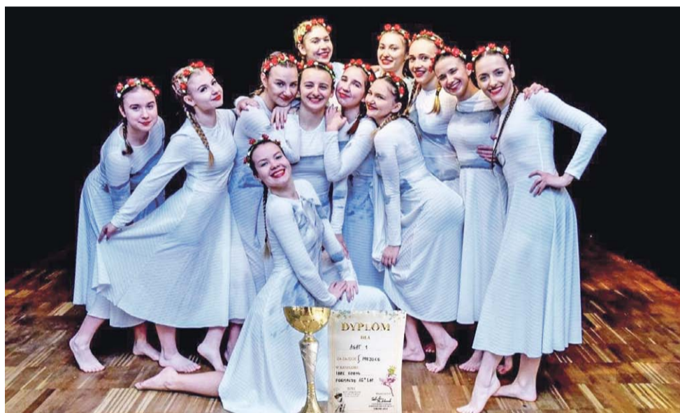
Najstarsza grupa Zespołu Agat ze Strykowa wygrała konkurs.