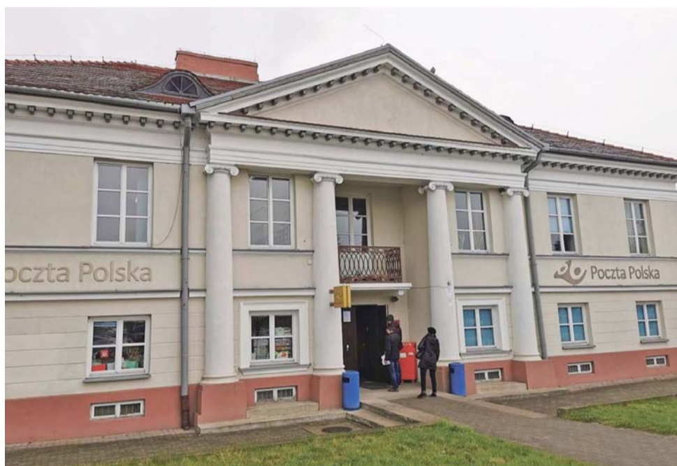
Ze względu na limity osób, które mogą przebywać wewnątrz, kolejki do placówki przy 3 Maja często ustawiają się już na zewnątrz.

Nie udało nam się uzyskać oficjalnych informacji na ten temat w siedzibie placówki przy ul. 3 Maja. Pracownik obsługujący klientów odesłał nas do naczelnika, ten z kolei do rzecznika prasowego całej Poczty Polskiej. Rzecznik poprosił nas o przesłanie pytań mailem. Przed zamknięciem tego numeru nie otrzymaliśmy na nie odpowiedzi.