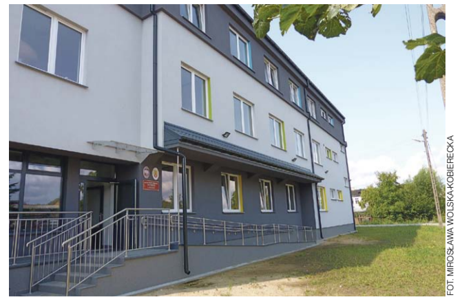
Młodzieżowy Ośrodek Socjoterapii w Kiernozi na razie ma p.o. dyrektora, ale dyrektor może zostać wyłoniony podczas konkursu.