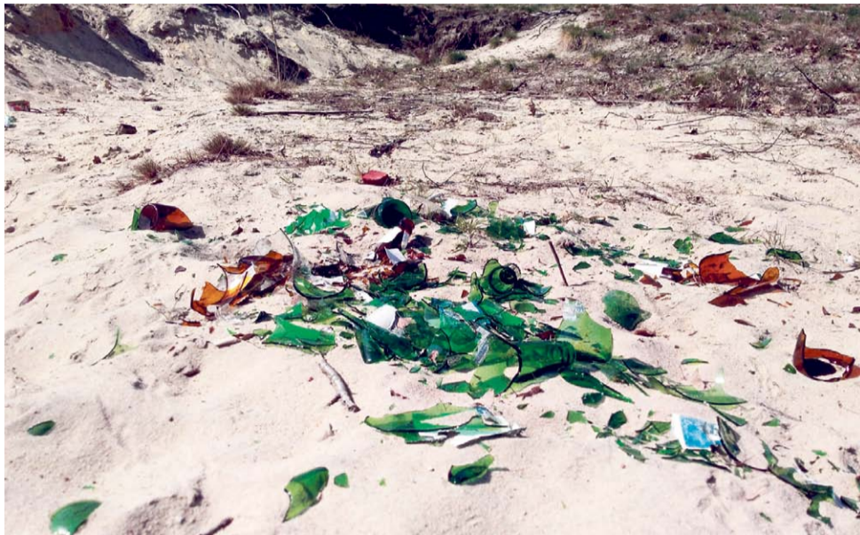
Podobnych skupisk potłuczonych butelek i innych śladów biesiadowania można na Marakanie znaleźć kilka.

Jak chcą wypić piwko i zjeść chipsy na łonie natury, to proszę bardzo. Tylko niech po sobie sprzątną. Niech nie tłuką butelek, nie wyrzucają torebek do lasu.