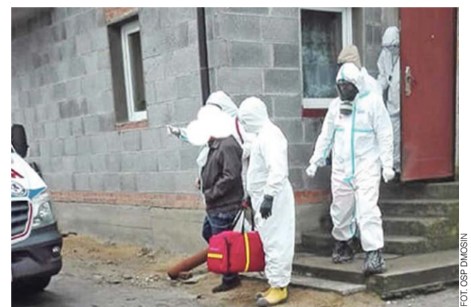
Strażacy zajęli się pacjentem do czasu przyjazdu ratowników.

Na tę chwilę w szpitalu w Głownie prowadzona może być konwencjonalna tlenoterapia. Osiąga maksymalną skuteczność przy przepływie do około 10 litrów tlenu na minutę. str. 26