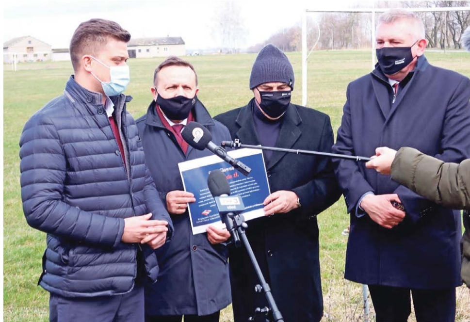
Samorządowcy i parlamentarzyści spotkali się na boisku LZS „Sokół” Popów.

W ramach trzeciego naboru wniosków do dofinansowania w ramach Rządowego Funduszu Inwestycji Lokalnych, gmina Głowno otrzymała 2 mln zł na budowę tego obiektu sportowego. O tym, które samorządy i ile pieniędzy pozyskały z RFIL, pisaliśmy w WG z 1 kwietnia i nie był to – patrząc na datę – żart prima-aprilisowy. Dzień wcześniej wojewoda łódzki opublikował listę dofinansowanych inwestycji, wśród nich wspomniany stadion.