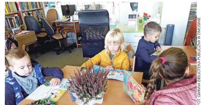
Grupa 6 latków z OP w Dmosinie w bibliotece z okazji Ogólnopolskiego Dnia Głośnego Czytania.

Bardzo zależało mi na wykorzystaniu z pożytkiem dla nas, mieszkańców, tego pozostałego ogryzka dawnej drogi do Lubowidzy.