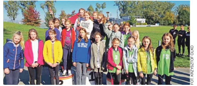
Najlepsze sztafety nagrodzono pucharami.

Najlepsze reprezentacje odebrały puchary, które ufundowane