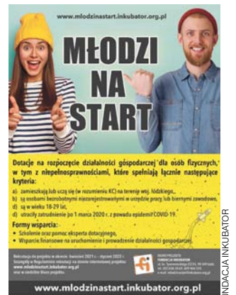
Plakat zachęcający do projektu „Młodzi na start”.

Celem projektu jest rozwój przedsiębiorczości wśród osób młodych poprzez zapewnienie wsparcia w zakresie samozatrudnienia 80 osobom bezrobotnym niezarejestrowanym lub biernym zawodowo. Szczegóły na stronie www.mlodzinastart.inkubator.org.pl . dt