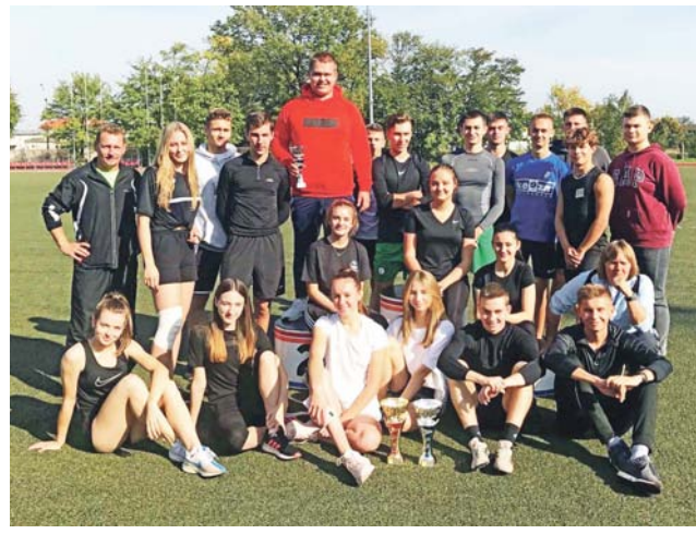
W mistrzostwach powiatu łowickiego wystartowały trzy zespoły.

walizowali w zawodach organizowanych przez Powiatowy Szkolny