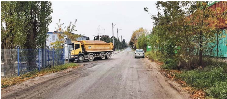
Skład kruszywa jest dla okolicznych mieszkańców prawdziwą udręką.

Ja jestem chora, mam problemy z sercem, a tu się nie da oddychać. A w nocy światła tych dojeżdżających wywrotek i hałas maszyn na tym składzie zwyczajnie nie dają spać