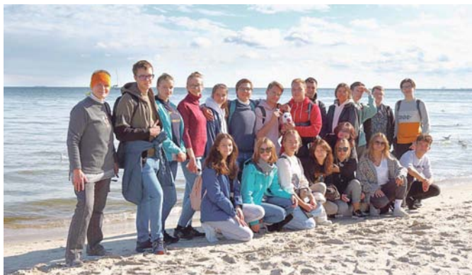
Program był bardzo napięty, ale nie mogło zabraknąć chwili na wizytę na plaży.

Były to trzy dni intensywnego zwiedzania. Jeszcze pierwszego dnia uczestnicy zwiedzili kościół św. Brygidy, Muzeum II Wojny Światowej oraz katedrę w Oliwie. Następnego dnia odwiedzili Muzeum Emigracji w Gdyni oraz Muzeum Marynarki Wojennej, byli też nad morzem. Ostatni dzień zwiedzania zarezerwowano na dwór Artusa, Akademię Sztuk Pięknych, Bramę Zieloną i Bazylikę Mariacką oraz jeden z „gwóździ programu”