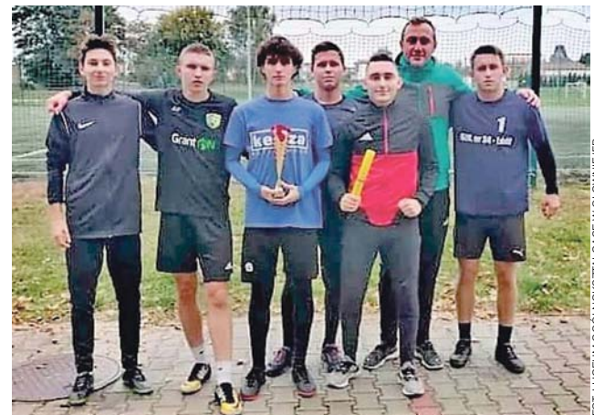
Biegacze I LO w Głownie zajęli 3. miejsce w powiecie.

Następna, 9. kolejka odbędzie się w dniach 16-17 października: Polonia – Boruta II, Victoria – KKS Koluszki, LKS Kalonka – Zjednoczeni II Stryków, Błękitni Dmosin – LKS Gałkówek, Iskra Głowno – LZS Justynów, Huragan Śwędów – Czarni, Sokół Popów – pauza.