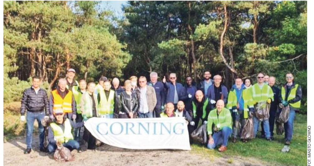
Sprzątanie Marakanu przez firmę Corning.

We współpracy z MZK w Głownie, którego pracownicy zadeklarowali odbiór posegregowanych odpadów, udało się zebrać kilkanaście worków śmieci o łącznej wadze 640 kg. dt