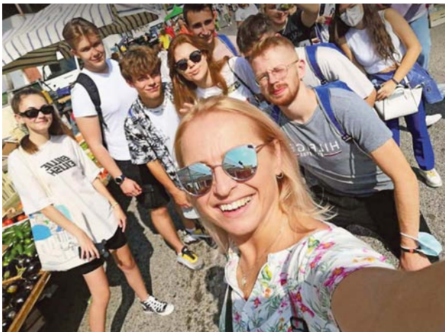
Uczestnicy wyjazdu w włoskim targowisku. Jak mówią – zrobienie tam zakupów nie było większym problemem.

Poza zwiedzaniem było sporo innych zajęć. Jak opowiadali nam uczestnicy – były dni, że wychodzili z apartamentów o 8.00, wracali po 20.00, a niekiedy jeszcze wybierali się na wieczorne spacerki. Zajęcia, w jakich brali