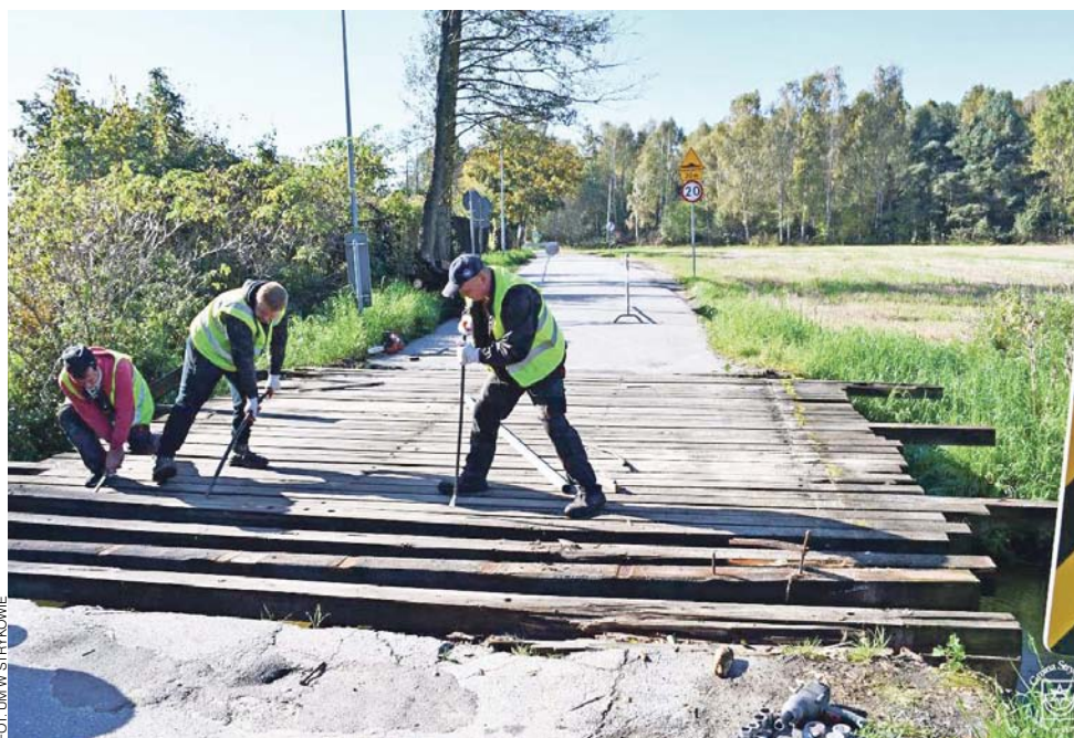
Prace naprawcze były prowadzone nawet w weekend.