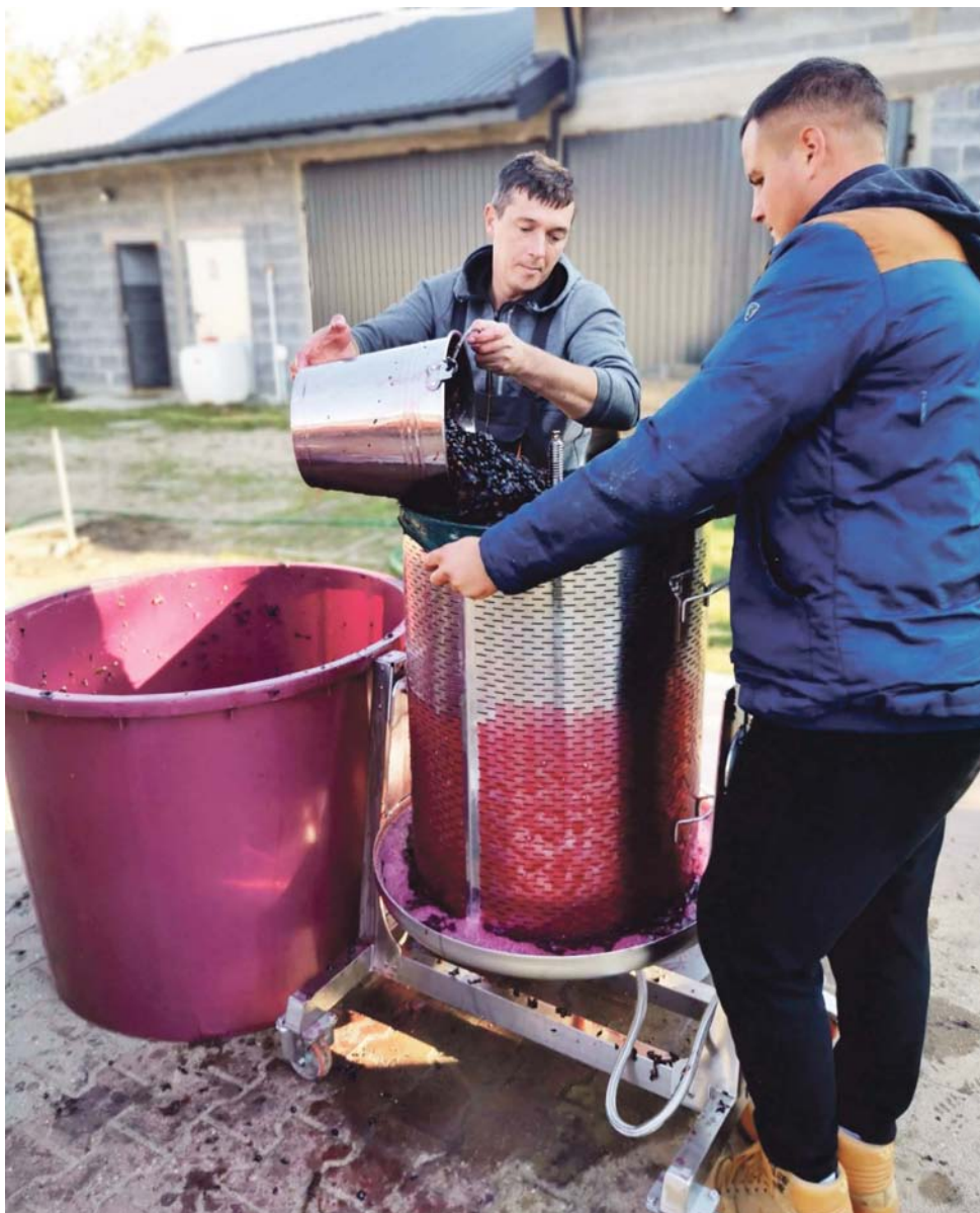
Tak wyglądało wyciskanie ciemnego winogrona w prasie (w środku znajduje się pompowany wodą balon). Spływający przez otwory sok zbiera się do naczynia, a potem wlewa do specjalnych zbiorników, gdzie fermentuje.

W czwartym roku pojechali ze swoim winem do Zielonej Góry