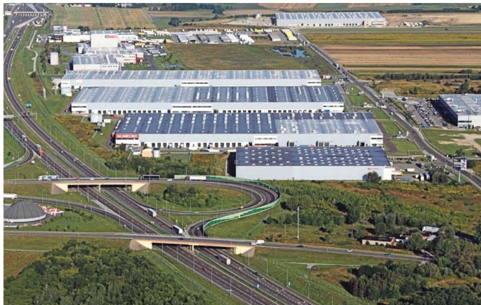
Podstrykowskie magazyny „z lotu ptaka”.

Trzeba usiąść i rozmawiać, nie można się obrażać na marszałka i go nie zapraszać. Może województwo mogłoby wejść do tej spółki, czy Wojewódzki Fundusz Ochrony Środowiska? Musi być wola rozmawiania.