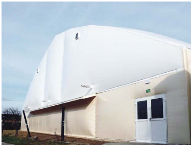
Oślonięte boiska, popularnie nazwane balonem. Obiekt wymagał przeróbek.

Obwodnica została odsunięta od miasta, przesunięta o co najmniej 300 metrów od terenów budownictwa mieszkaniowego w stronę autostrady – ale poza tym