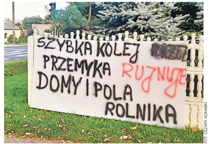
Tak na ogrodzeniach swoich posesji protestują mieszkańcy sąsiadującej z gminą Dmosin wsi Przecław.