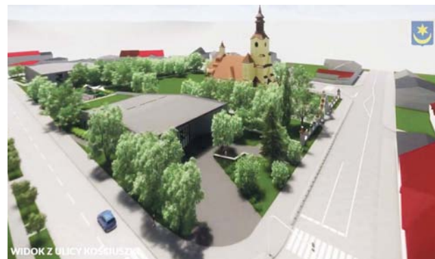
Wizualizacja nowego Centrum Kultury w Strykowie – w wersji z 2018 roku. Projekt budził ogromne kontrowersje – teraz będzie realizowany inny i w innym miejscu.

– Teraz Bratoszowice są zabezpieczone na kolejne 5 lat. Pod koniec sierpnia nowy właściciel zawarł z nami porozumienie, nadal możemy tam prowadzić szkołę. Natomiast on ma swoje cele biznesowe, o których też rozmawialiśmy, dlatego przez te 5 lat chcemy