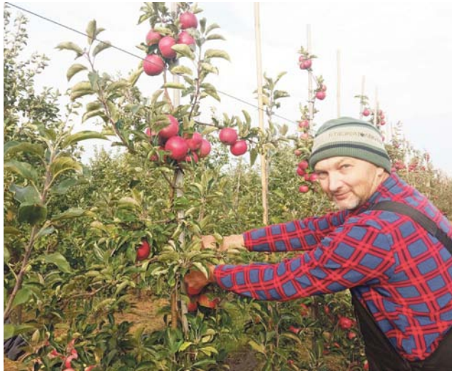
Tegoroczny zbiór będzie dobry, ale cena na razie jest bardzo niska.

Jak przekazał nam jeden z gospodarzy z Zabostowa Dużego, dla przykładu jego wkład do „wyprodukowania” jablek, które uprawia na 5 hektarach ziemi, to 40 tys. zł. Zysk? Jakiś będzie, ale naj-