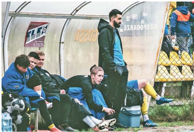
Zespół Stali Głowno z niepokojem może spoglądać na tabelę po serii kiepskich wyników w ostatnim czasie. Głównianie liczą na przełamanie.

Zjednoczeni przegrali czwarte spotkanie z rzędu, tym razem ulegając nieznacznie trzeciej w tabeli Polonii Piotrków Trybunalski 0:1. Strykowianie ostatni raz komplet punktów zdobyli 4 września, a nie przegrali 11 września. Identyfikując sytuację główniejszych piłkarzy Stali, którzy tym razem pechowo ulegli spadkowiczowi z III Ligi RKS Radomsko 0:1. Zespół Głowna także ostatni raz wygrał na początku września, a w połowie poprzedniego miesiąca po raz ostatni dopisał na swoje konto jakiejkolwiek punkty. Słaba postawa w ostatnich tygodniach sprawiła, że Stal wypadła już do