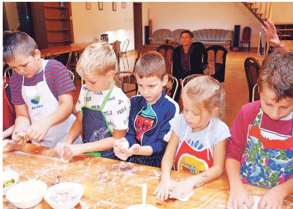
Własnoręczne uformowanie pizzy, potem wybór dodatków, a przede wszystkim – degustacja, były dla dzieci ze Szkoły Podstawowej w Bąkowie Górnym nie lada atrakcją.

Produkcja wina musującego jest bardziej skomplikowana, ponieważ tutaj przeprowadza się dwa procesy fermentacji – drugi już w butelce, z dodatkiem drożdży, które się potem z butelki usuwa, mroząc jej szyjkę. Ale więcej chyba zdradzać nie będziemy, aby wizyta w winnicy mogła być ciekawa i zaskakująca. Dla naszej reporterki taka właśnie była. ■