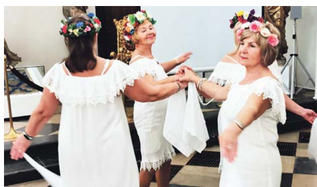
Z układem tanecznym wystąpiły „Złote Babki”, czyli sekcja tańcząca ŁUTW.

W chwili obecnej liczy on 290 słuchaczy w wieku 50+, którzy będą mogli skorzystać z bogatej oferty zajęć. Są wśród nich m.in. brydż sportowy, szachy, zajęcia plastyczne, koło melomana, joga, zumba, koło fotograficzne czy pływanie – nauka i doskonalenie.