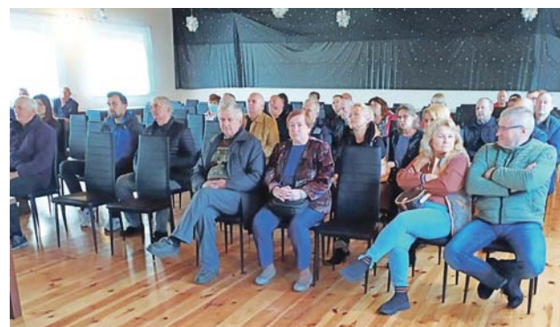
W spotkaniu konsultacyjnym uczestniczyło ponad 40 mieszkańców Kołacina i okolic.

– Mam świadomość, że każdy z proponowanych przebiegów kogoś dotknie, a kogoś oszczędzi