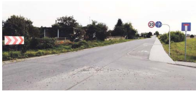
„Ścieżka zdrowia” – tak o nowym miejscu rekreacji mówią mieszkańcy Dmosina.

– Po rozmowie z sąsiadami i ich przychylniej ocenie inicjatywy, wystąpiłam z wnioskiem o zabezpieczenie w naszym budżecie środków na inwestycję i dzięki poparciu pani wójt oraz pozostałych radnych, udało się sfinalizować