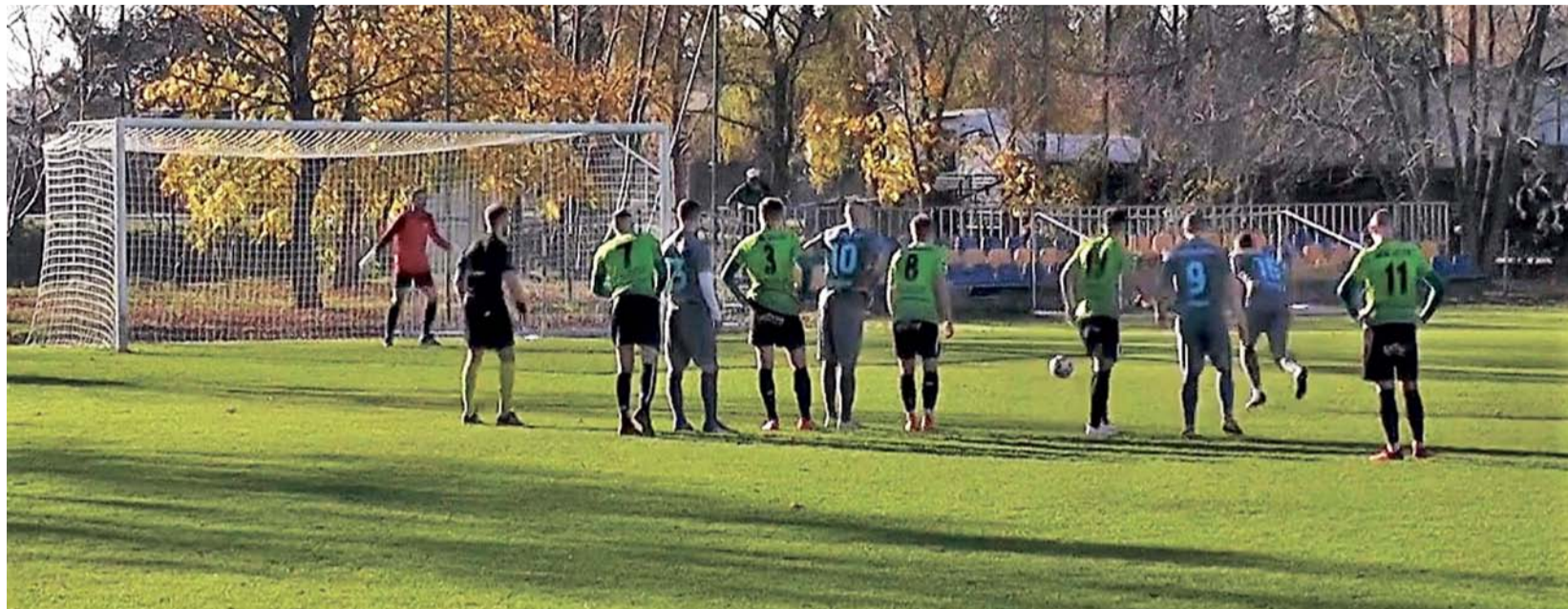
Zjednoczeni w meczu ze Skalnikiem mieli doskonałą okazję do kontaktowego gola, ale nie wykorzystali rzutu karnego.