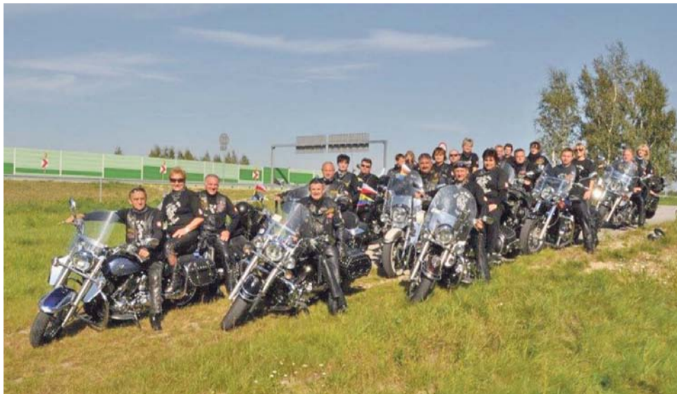
Strykowska Grupa Motocyklowa w pełnym składzie robi naprawdę imponujące wrażenie.

przelatując tuż przy twarzy szefa grupy. W Chorwacji dowiedzieli się, że skóry nie zawsze są najlepsze na motor, szczególnie przy 40-stopniowym upale. W Szwecji na wyspie Olandia jednemu z nich popsuka się maszyna. Tam doświadczyli jak solidarni są ze sobą motocykliści, bez względu na kraj, różnice kulturowe i język. I zaradni. Ostatecznie, wykorzy-