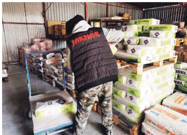
Praca w hurtowni Jakmar w Łowiczu.