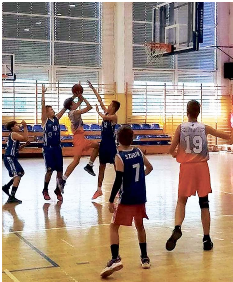
Koszykarze TK Basket Stryków (pomarańczowo-niebieskie stroje) są na dobrej drodze, by w tym sezonie Wojewódzkiej Ligi Koszykówki do lat 15 zaprezentować się w wielkim finale.

Strykowskie koszykarze zbliżyli się do ligowej czołówki. Na czele jest ŁKS KM SG I Łódź, który obok MKS Ósemki Skierniewice jest niepokonany i z którym TK Basket zmierzy się w następnej kolejce. Mecz w łódzkiej hali MOSiR zaplanowano na najbliższą sobotę, 6 listopada o godz. 12:45. wp