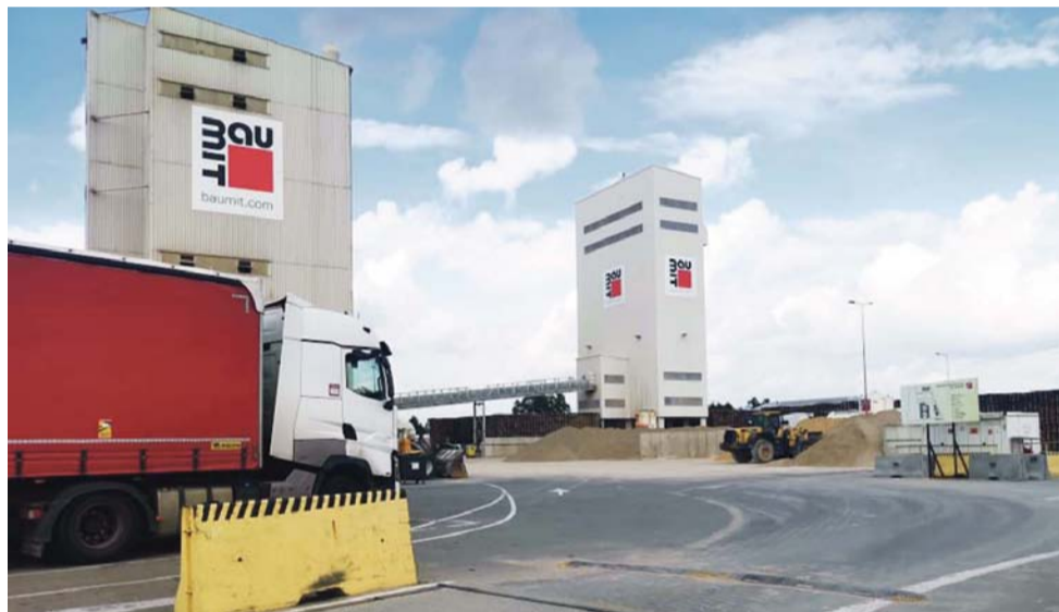
Wytwórnia Baumit w Łowiczu.

większe. Z raportu wynika, że np. tynki i okładziny zewnętrzne drożeją w tempie 4% na miesiąc, co daje ponad 50% w skali roku. Trzeba również zauważyć, że są to procentowe wzrosty cen samej produkcji. Do ostatecznej ceny materiałów dojdzie jeszcze transport i marża wewnętrzna sklepu czy hurtowni. Ostateczne ceny produktów będą zatem notowały dużo większe wzrosty.