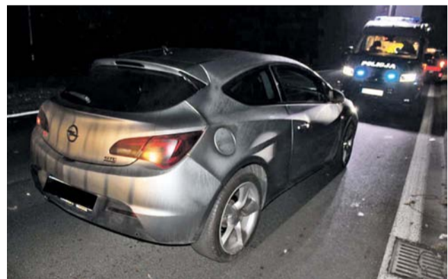
Kierujący Oplem , jadąc w kierunku Bratoszowic, uderzył w leżącą na jezdni kobietę.

Do tragicznego w skutkach wypadku zostali wezwani także strażacy. Dwa zastępy PSP w Strykowie i dwa z OSP w Głownie zabezpieczali miejsce zdarzenia. Droga krajowa nr 14 była zablokowana przez wiele godzin. Objazdy wytyczono przez centrum miasta. ca