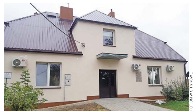
W tej świetlicy już nie straszy – mówią mieszkańcy.

Plan został przyjęty jednogłośnie – 13 głosami „za”. Główne zmiany, które wprowadza, to nowe tereny zabudowy mieszkaniowej i usługowej, które zostały wprowadzone w uchwalonym w 2017 r. Studium Uwarunkowań i Kierunków Zagospodarowania gminy Dmosin.