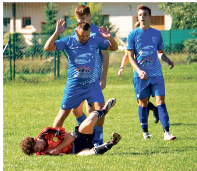
Drużyna Powstańca Dobra (czerwone koszulki) w trudnym meczu musiała uznać wyższość rywali.

Następna, 11. kolejka odbędzie się w dniach 6-7 listopada: KS Rosa Rosanów - KP Byszewy, LKS