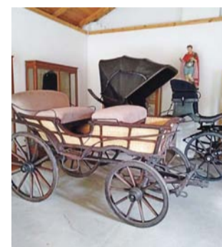
Wóz pod brykę ze Złakowa Kościelnego – jeden z czterech pojazdów poddanych renowacji w tym roku.

Przypomnijmy, że dotacja dla łowickiej placówki wyniosła 119 tys. zł, a 30 tys. zł stanowił wkład własny. Pojazdy zostały poddane gruntownemu oczyszczeniu z kurzu i zniszczonych warstw malarskich, dezynsekcji, uszkodzone elementy zostały naprawione bądź też wymienione, a brakujące odtworzone. Ponadto elementy polichromowane zostały pomalowane, metalowe zabezpieczone