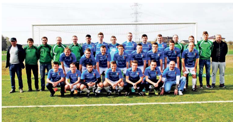
Drużyna piłkarzy z Dmosina kolejny sezon z rzędu ma realną szansę na awans do klasy okręgowej.

Piłka nożna | 11. kolejka A-klasy, gr. II