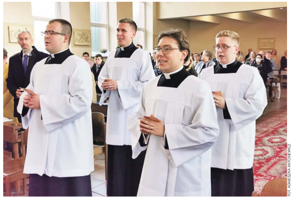
Klerycy WSD w Łowiczu już po nałożeniu stroju duchownego – sutanny.

W przygotowaniach do obłóczyn klerykom pomogły rekolekcje odbywające się w seminarium, jak i te, na które klerycy wyjechali wraz z ojcem duchownym do