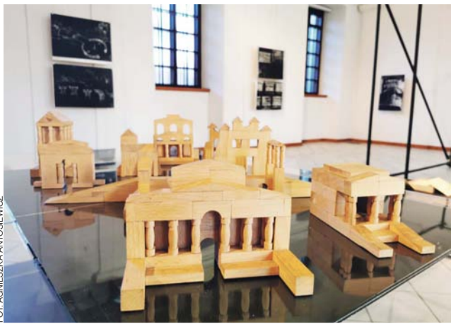
Makieta z zasobów Muzeum w Łowiczu przedstawia budowle ułożone z klocków Noakowskiego.