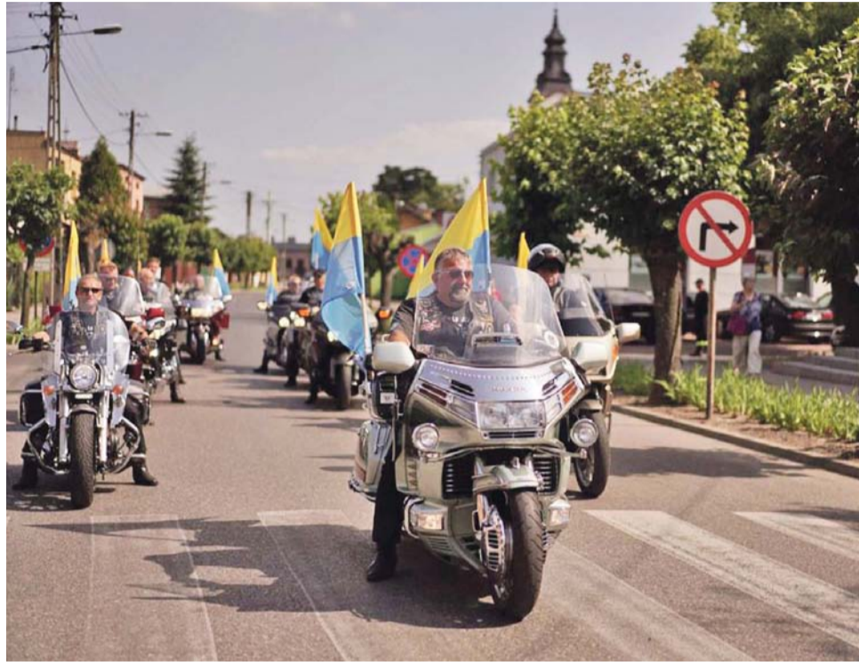
Coroczne święto gminy poprzedza parada motocyklowa.

Tak zaczęła się przygoda strykowskich motocyklistów z wycieczkami. Zaczynali od wyjazdu w Bieszczady na Piknik Country w Lesku. Najwyraźniej zrobili duże wrażenie na tamtejszej pani burmistrz, która wyciągnęła ich na scenę, a następnego dnia zaprosiła na kawę do ratusza. W drodze