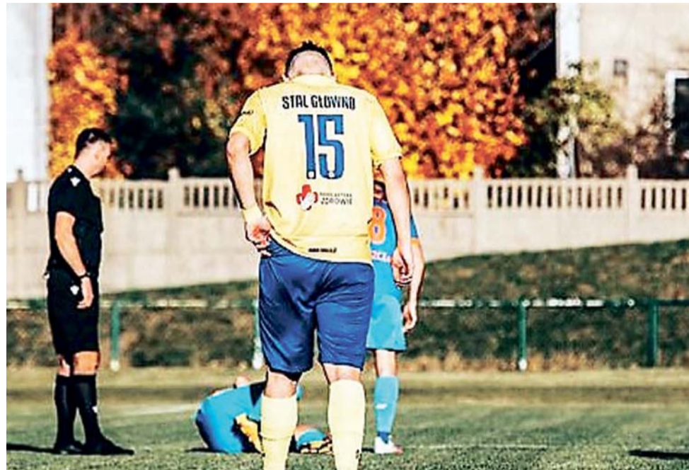
Zespół Stali Głowno znajduje się w największym sportowym kryzysie od lat. Głównianie od blisko dwóch miesięcy nie zapunktowali ani nie strzelili żadnej bramki.