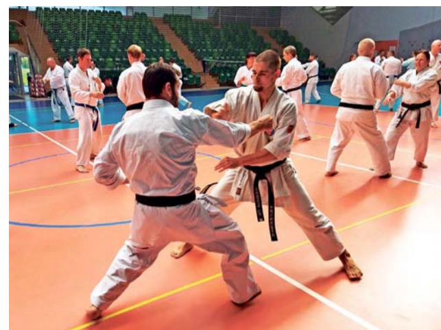
Zajęcia karate podczas zjazdu w Pińczowie dostarczą strykowskim karatekom wielu cennych doświadczeń.