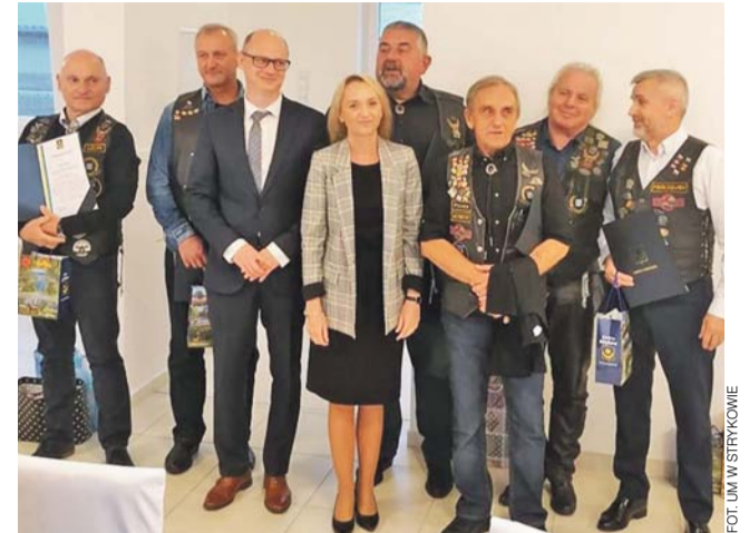
Dla władz gminy motocykliści to prawdziwy promocyjny skarb.

stując części długopisu, naprawili uszkodzoną pompę paliwową i wrócili do Polski na dwóch kółkach, bez pomocy lawety. W Albanii z kolei musieli ściągnąć z siebie promocyjne koszulki Strykowa. Okazało się, że przez charakterystyczny herb gminy z półksiężcem, byli myleni z Turkami. Najlepiej wspominają jednak wycieczkę do Czarnogóry.