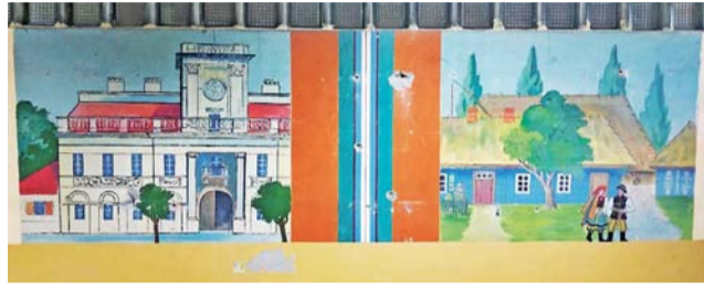
Odkryte malowidło na ścianie holu łowickiego Sanepidu.