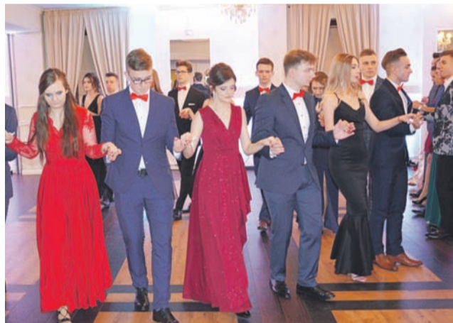
Trochę wspomnień przedcovidowych. Skupieni maturzyści II LO w Łowiczu podczas ostatniej próby poloneza. Ich studniówka odbyła się 11 stycznia 2020 roku.