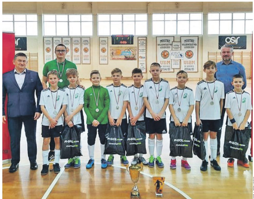
Zespół Pelikana-2010 z nagrodami po turnieju w Skierniewicach.