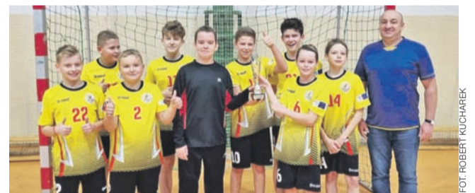
Mistrzami powiatu w piłce ręcznej zostali uczniowie z SP Bielawy.