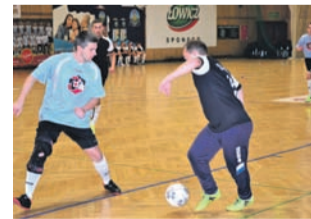
Na najwyższym szczeblu łowickiej halówki zameldowało się dziesięć zespołów