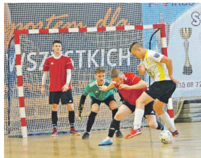
W najniższej klasie rozgrywek IV Ligi ŁoLiF emocje towarzyszące spotkaniom są nieraz większe niż w wyższych ligach.