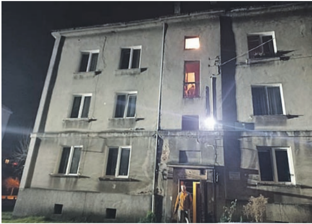
Blok przy ul. Sikorskiego 12 w Głownie.