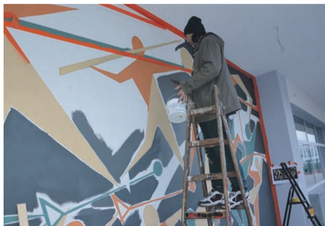
Aura nie sprzyjała artyście. Niska temperatura i wysoka wilgotność sprawiały, że miał problem z nakładaniem kolejnych warstw farby.

Tym razem artysta dostał zlecenie od władz miasta na odtworzenie modernistycznego malunku, jaki istniał na wolno stojącym pawilonie Ośrodka Sportu i Rekreacji przy ul. Jana Pawła II. Budynek przeszedł modernizację, która kosztowała 543.944 zł. Przy prowadzeniu tak szeroko zakrojonych prac trudne byłoby zachowanie modernistycznego malunku sym-