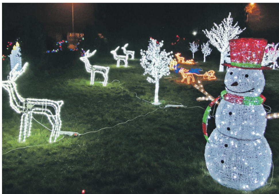
Tak prezentował się ogród państwa Tadeusiaków w ubiegłym roku.

W tym roku dekoracje mają być gotowe na niedzielę 19 grudnia. Począwszy od tego dnia, w godz. 16.00-20.00 będzie można space-