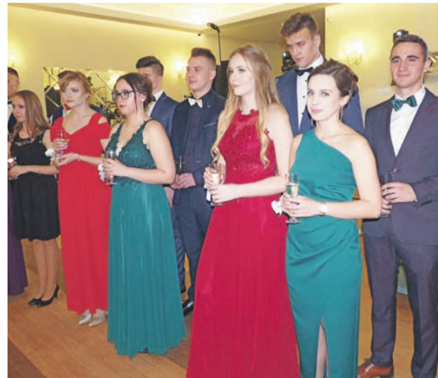
To zdjęcie wykonaliśmy na studniówce ZS nr 1 w Bratoszewicach 11 stycznia 2020 roku.

Dyrektor pijarskiego LO w Łowiczu Przemysław Jabłoński przyznał, że ma ma pewien niepokój związany z tym, że boi się czy epidemia nie pokrzyżuje planów zorganizowania studniówki, biorąc pod uwagę to, co działo się w minionym roku