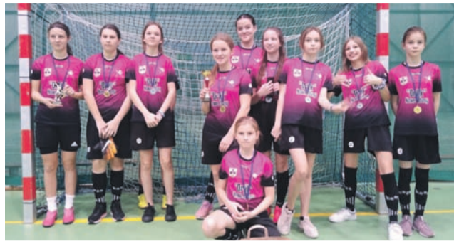
Dziewczęta z Orlika Nowe Zduny zajął miejsce drugie w końcowej klasyfikacji.