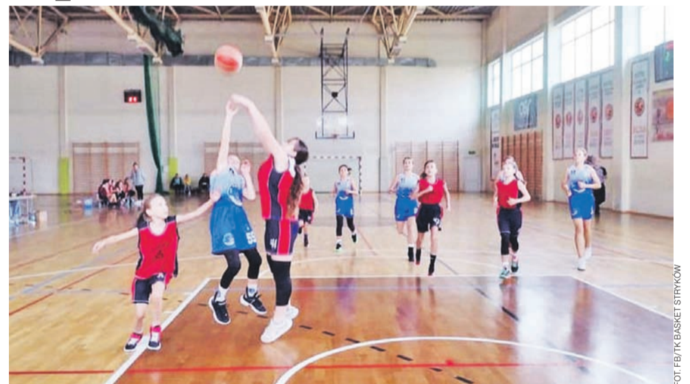
Koszykarki Strykowa (niebieskie stroje) mają wiele do zaoferowania w tym sezonie. Pokazują to w każdym meczu Ligi Wojewódzkiej do lat 13.

TK Basket musiał sobie radzić bez kilku zawodniczek, a mimo to grał pięknie i zasłużenie wygrał tak wysoko. W każdej z czterech kwart strykowianki umiały przekuć wyższy potencjał sportowy na wynik. Już na samym początku goście praktycznie pozbawiły SMOKa złudzeń, wygrywając w pierwszej kwarcie 17 do 2. Potem było podobnie, TK Basket grał skutecznie w ataku i nie dawał zbyt wielu szans rywalkom,