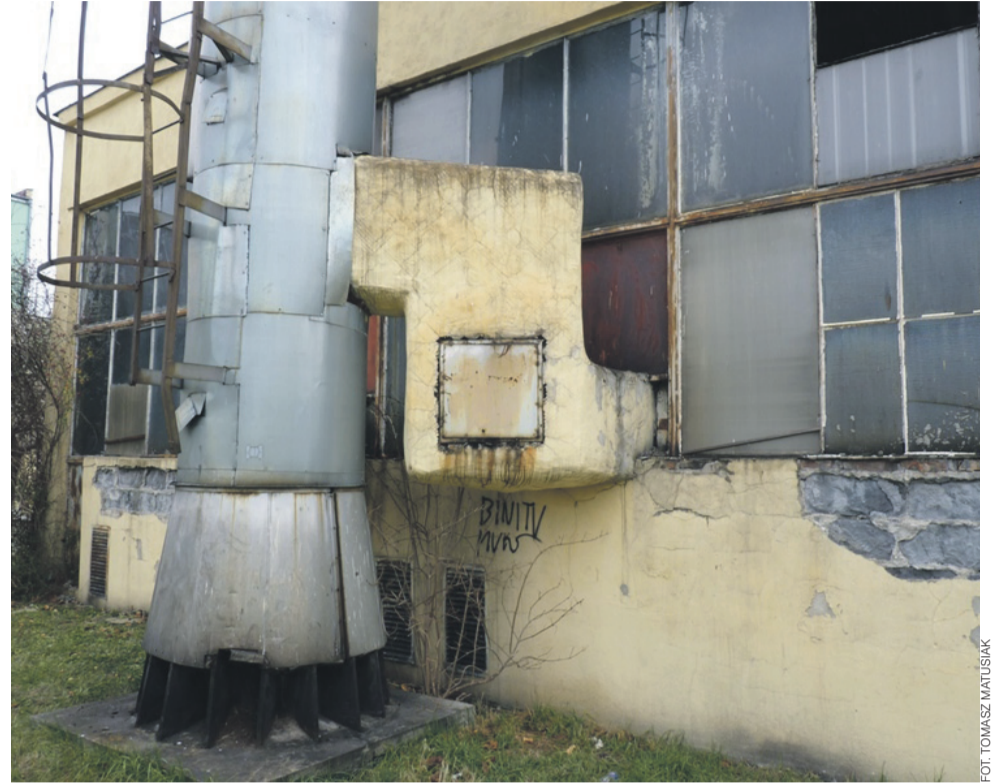
Ani z punktu widzenia ekologii, ani ekonomii – dalsze utrzymywanie kotłowni przy Kopernika nie będzie miało sensu.