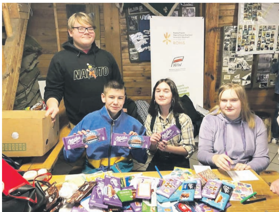
Harcerze z Głowna prowadzą zbiórkę czekolad dla żołnierzy na polsko-białoruskiej granicy.

Harcerze z Głowna prowadzą zbiórkę czekolad także wśród mieszkańców. Można je dostarczyć, razem z naklejoną karteczką z podziękowaniami, do siedziby hufca przy ul. Partyzantów 2 jeszcze tylko dziś, w czwartek 2 grudnia. Później czekolady zostaną dowieszone do punktu zbiórki do Niepokalanowa, a docelowo