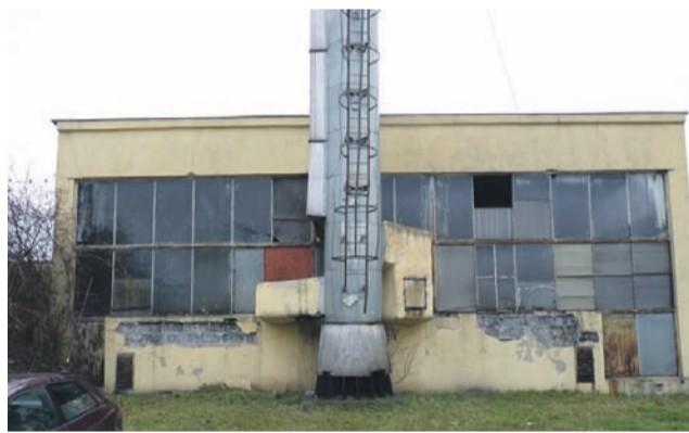
Po odłączeniu obiektów spółdzielczych, z kotłowni korzystałyby tylko trzy bloki, koszty byłyby więc dla nich horrendalnie wysokie.

Zastosowano więc prowizoryczną instalację – co wtedy nie przeszkadzało ani odbierającym