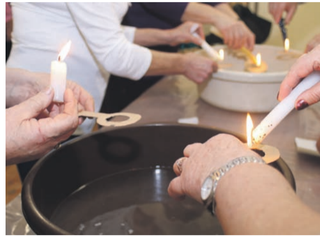
Podlewanie wosku przez klucz.

Podobnego zdania były członkinie Koła Gospodyń Wiejskich w Dmosinie, które zorganizowały Andrzejki we własnym gronie w strażnicy OSP w swojej wsi.