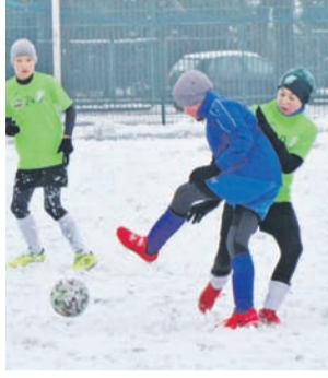
Na boisku przykrytym śniegiem nie brakowało walki.

– Ciężkie warunki do gry w piłkę, więc nie będę oceniał aspektów piłkarskich. Mecz rozegraliśmy w dwóch formułach. Pierwsza połowa w dziewięciu, potem graliśmy na pełnowymiarowe boisko, w jedenastu. Brawa dla chłopaków za ambitne podejście do spotkania. Pierwszy raz mie-