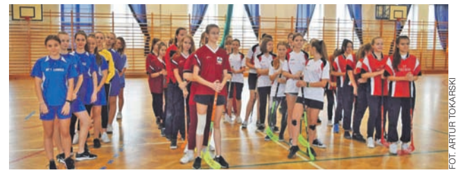
W powiatowej rywalizacji w Bielawach zagrały cztery zespoły

Warto przypomnieć, że niedawno Wolski sprawdził swoją dyspozycję w ultramaratonie, który odbył się w weekend 24-25 września, na trasie Jury Krakowsko-Częstochowskiej w ramach Jurajskiego Festiwalu Biegowego. Spisał się wtedy rewelacyjnie i trasę liczącą 121 kilometrów pokonał w czasie 14 godzin i 55 minut i zajął 4. miejsce w gronie 30 zawodników. zt