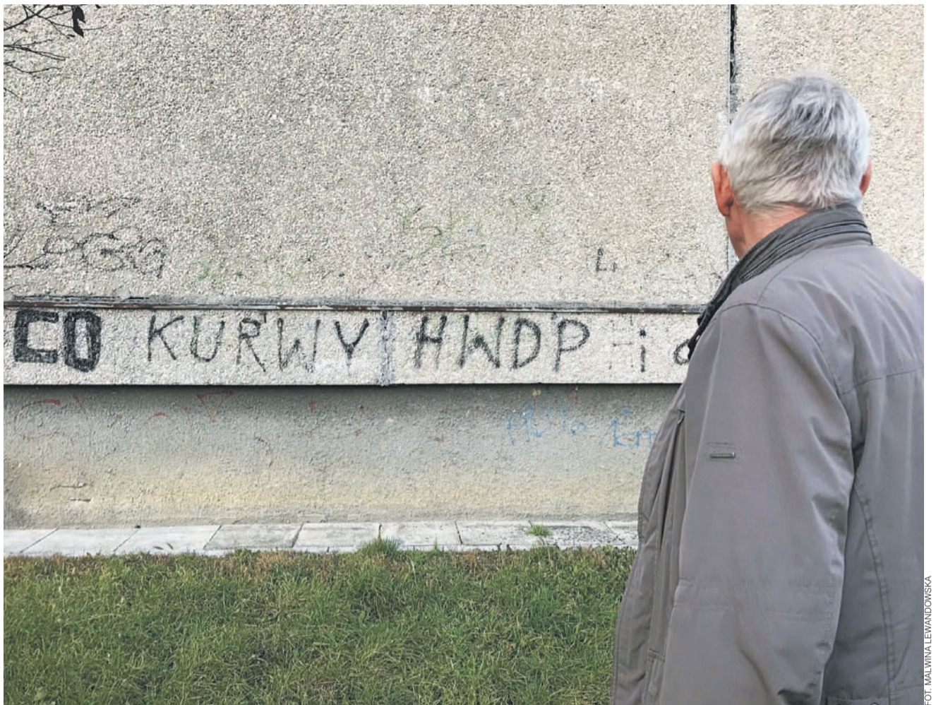
Wulgaryzmy słyszymy – i widzimy – wszędzie wokół nas.