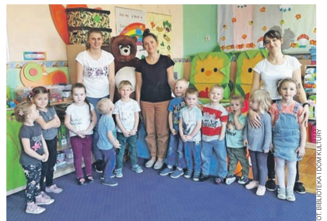
Dzień Misia w przedszkolu Nowe Zduny.

Drugiego dnia dzieci z klas 0 i 1 spotkały się w bibliotece na urodzinach Misia Czytusia. Wspaniałą pamiątką, na lata, są wspólne zdjęcia z Misiem. az