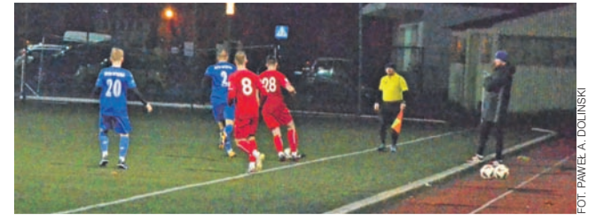
Zryw Wygoda w pierwszej połowie prowadził 1:0, gorzej było po przerwie.