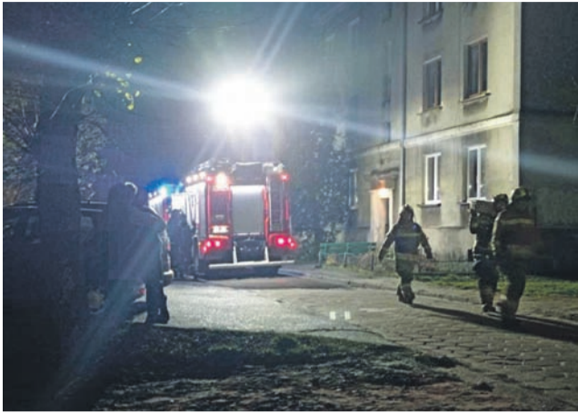
Strażacy podczas akcji na ul. Sikorskiego w Głownie.