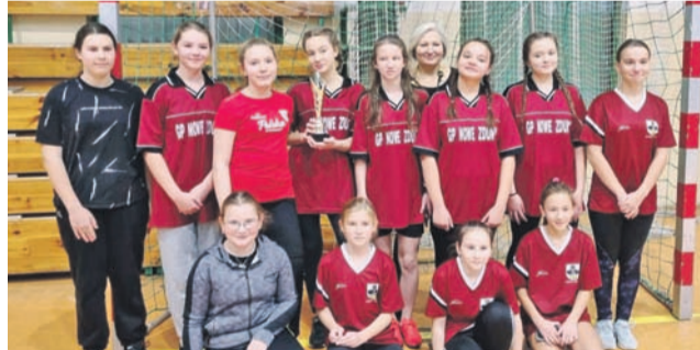
Dziewczyny z SP Nowe Zduny okazały się najlepsze w Szczypiorniaku.

Turniej o awans do zawodów rejonowych odbył się we wtorek, 23 listopada, w hali sportowych OSiR nr 2 przy ul. Topolowej 2. Do rywalizacji w Powiatowych Igrzyskach Dzieci w piłce ręcznej dziewcząt prowadzonej przez Szkolny Związek Sportowy przystąpiły tylko cztery ekipy z naszego powiatu. Drużyny zagrały „każdy z każdym”. Po rozegraniu sześciu spotkań okazało się, że najlepiej poradziły sobie pod-