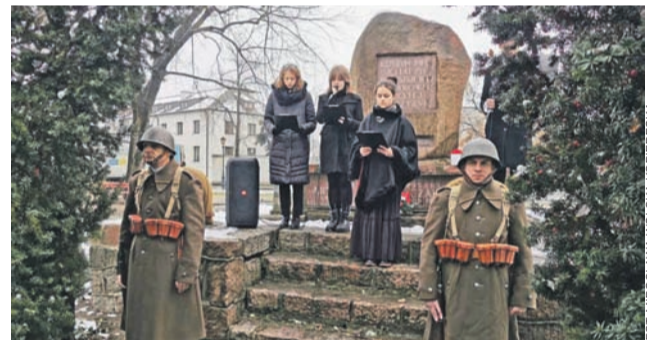
Pod pomnikiem Artura Zawiszy Czarnego wystąpili uczniowie Szkoły Podstawowej nr 7 w Łowiczu.

Podczas uroczystości zabrzmiała muzyka Fryderyka Chopina, a krótkie prelekcje wygłosili Katarzyna Sierska-Pięta oraz Zdzisław Kryściak. Program artystyczny przedstawili uczniowie Szkoły Podstawowej nr 7 im Jana Pawła II w Łowiczu.