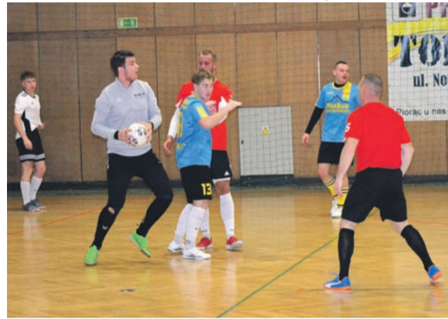
Na parkiecie we wszystkich meczach Da Grasso II ligi futsalu było bardzo ciekawie.

Wyrównany pojedynek stoczyły zespoły Marbudu Chąšno z Eko-Plastem Łowicz. Marbud wygrał ostatecznie 2:1 (1:1),