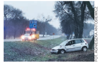
Samochód znalazł się w rowie.

Rzecznik policji w Łowiczu kom. Urszula Szymczak poinform-