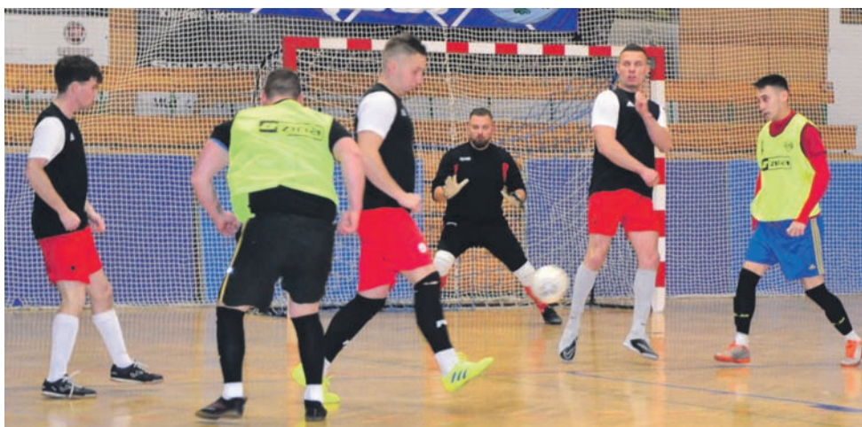
Mecze 1. kolejki Zina III ligi ŁoLiF miały bardzo wyrównany przebieg.