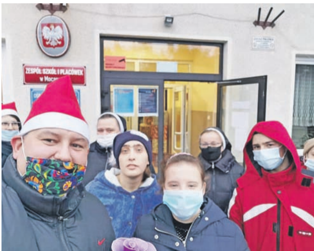
Tak wyglądał ubiegłoroczny finał Mikołajkowej Zbiórki dla Mocarzy z Mocarzewa.