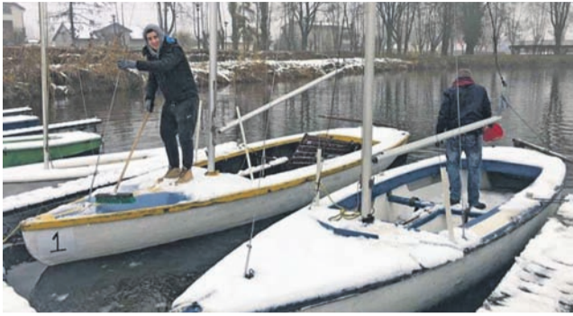
Łódki z zalewu Mrożyczka zostały przewiezione do wynajętej hali, gdzie będą przechowywane przez zimę.