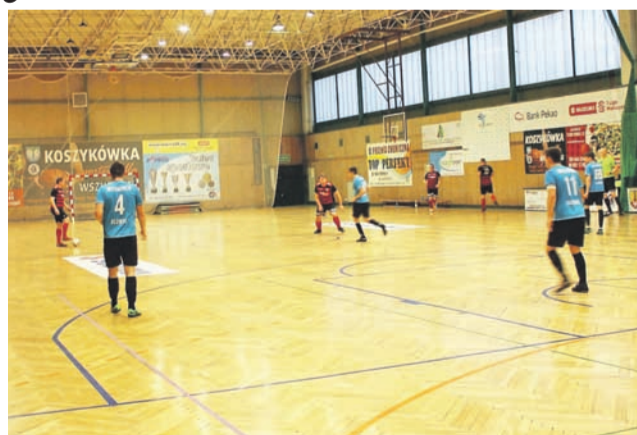
Starcie debiutującego w rozgrywkach Witaminera Głowno (niebieskie koszulki) z doświadczoną w ŁoLiF ekipą z Dmosina zakończyło się wysoką wygraną Błękitnych II.