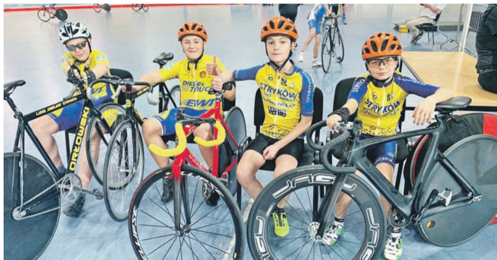
Grupa młodych kolarzy ze Strykowa była jedną z liczniejszych podczas kolejnej edycji torowych zawodów pod nazwą „Szukamy Następców Olimpijczyków”.