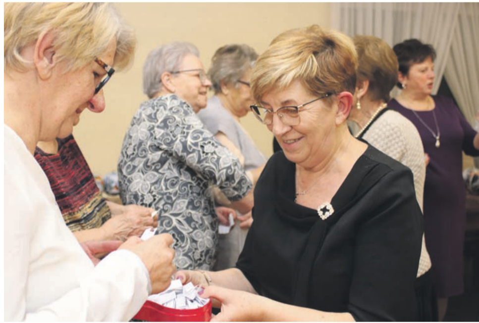
Losowanie karteczek z przepowiedniami.