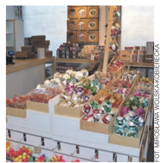
Na kilka dni przed otwarciem sklepu było w nim już wszystko przygotowane na przyjęcie klientów.

W tym roku firma opracowała program franczyzowy. Dzięki niemu w różnych miejscach