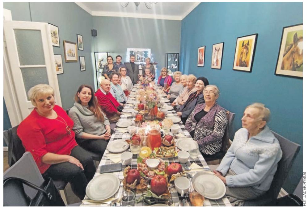
W spotkaniu wzięło udział 8 wolontariuszy akcji „Zjedz obiad z seniorem” i 10 seniorów.

Łowicz | Spotkanie uczestników akcji „Zjedz obiad z seniorem”