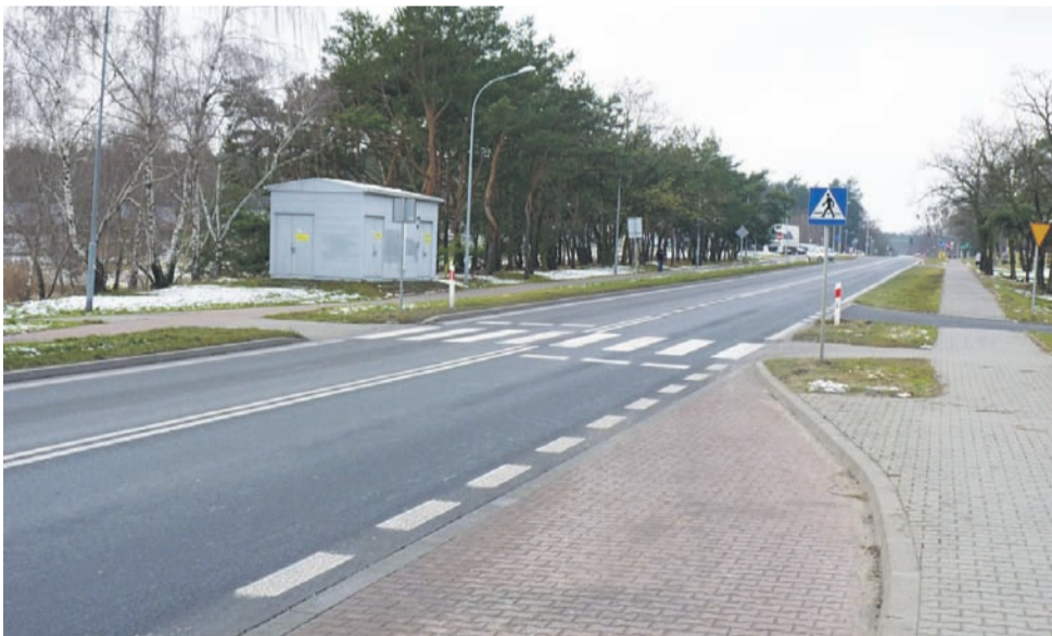
Przed przejściem zawsze należy zachować „szczególną ostrożność”, ale dobrze wiemy, że nie wszyscy kierowcy się do tego przepisu stosują.

Do obowiązku właściciela lub administratora, a w tym przypadku jest to spółdzielnia mieszkaniowa, należy przygotowanie budynku na okres zimowy. Po ostatnim sezonie grzewczym mieszkańcy sami wezwali kominarza, który wyczyścił go powierzchniowo. W zdarzeniu, dzięki szybkiej reakcji lokatorów i straży pożarnej, nikt nie został poszkodowany. zt