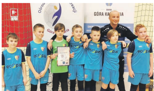
Zespół Zjednoczonych Stryków rocznika 2010/2011 pokazał się z dobrej strony podczas halowego turnieju piłki nożnej w Górze Kalwarii.

Piłkarze Zjednoczonych Stryków rocznika 2010/2011 oraz żacy zaraz po zakończeniu zmagani ligowych przeszli do rozgrywek turniejowych. Młodzi strykowianie grali w Łodzi oraz na Mazowszu.