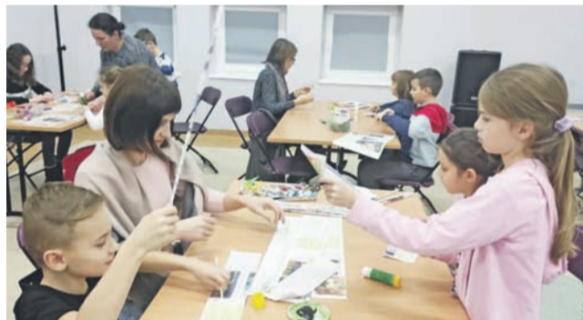
Rodzinne tworzenie świątecznych dekoracji.

Wydarzenie nie tylko zapewniło najmłodszym możliwość rozwoju predyspozycji artystycznych, ale również wprowadziły wszystkich zaangażowanych w typową dla świąt Bożego Narodzenia rodzinną atmosferę. ml