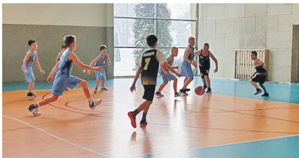
W Tomaszowie Mazowieckim łowiczanie zagraли dwa dobre mecze.