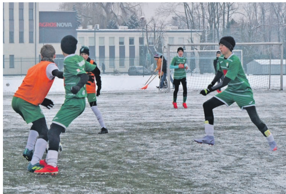
Biało-zieloni z rocznika 2008 walczyli ambitnie podczas sparingu z AP Żyrardowianką Żyrardów.

Mimo tego, że na dworze mroźno, a zalegający śnieg również nie sprzyja rozgrywkom w piłkę nożną, podopieczni trenera Macieja Grzegorego udało się rozegrać zaplanowany sparing z AP Żyrardowianka Żyrardów. Miał on nieco inny przebieg niż tradycyjnie mecze, bo zespoły rywalizowały ze sobą ponad 2 godziny. Ostatecznie gracze Pelikana-2008 ulegli rywalowi 3:4, ale w tego typu jednostkach treningowych, nie wynik jest najważniejszy.