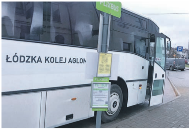
Autobus komunikacji zastępczej ŁKA.

Godzinę dwadzieścia czekaliśmy w zimnym autobusie na inny autobus. W efekcie do domu wróciłem prawie dwie godziny później.