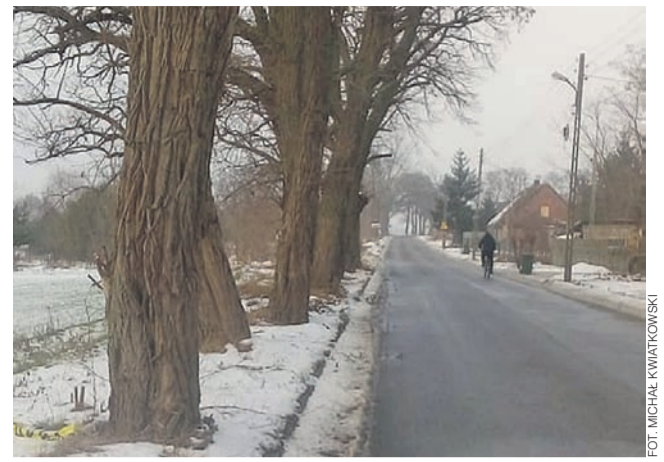
Byłaby tu fajna okolica do spacerów, ale bez chodnika to męczarnia i ryzyko.