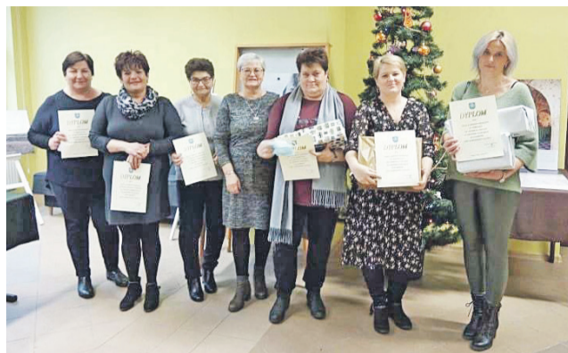
Laureatki konkursu „Lato zamknięte w słoiku”.

Drugie miejsce otrzymała kobieta z KGW Domaradzyn. Gospodynie nagrodzone zostały kompletem noży o wartości