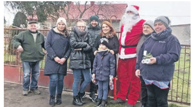
Rodziny Dańków i Nowaków ze św. Mikołajem.

W środku siedział święty Mikołaj, który obdarowywał najmłodszych swoją czekoladową podobizną, natomiast tych starszych różnymi wypiekami, do których dołączone były życzenia: „W ten magiczny, świąteczny czas, niech będzie radosny każdy z Was... Kolorowej choinki, koled śpiewania, bogatego Mikołaja, złotej gwiazdki z nieba, śnieżnego oplatka, a w Nowym Roku – wszystkiego najlepszego”.