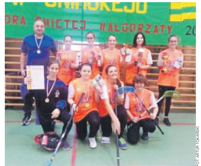
Uczennice z SP Bielawy.

Bielawianki w meczu grupowym awans do finału zapewniły sobie wygraną z SP Sędziejowice 3:0. W meczu finałowym nasza ekipa pokonała SP Pławno 5:1.