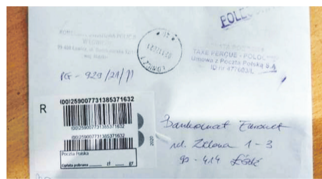
List nadany przez KPP Łowicz został zaadresowany do bankomatu.

uderzył w zaparkowanego TIR-a marki Mercedes, którym kierował 53-letni mieszkaniec Pruszkowa. W zdarzeniu nikt nie odniósł obrażeń. Obaj zawodowi kierowcy byli trzeźwi. Sprawca został ukarany mandatem. mwk