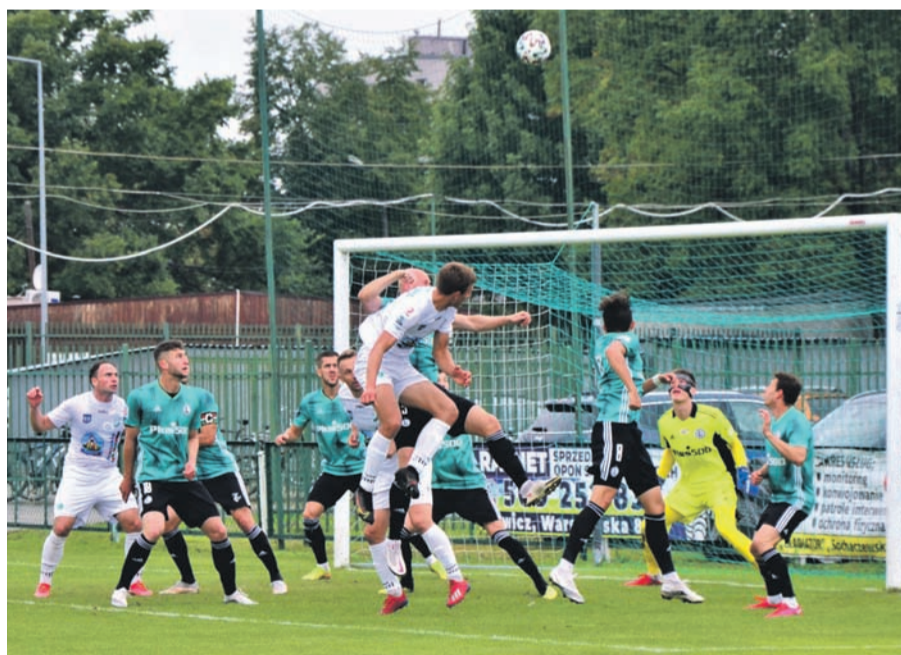
Legia II wywiozła z Łowicza jeden punkt. W tym meczu stołeczni ujrzeni dwie żółte kartki. Jesienią otrzymali ich najmniej w całej lidze.

Zespoły ze strefy spadkowej są za to... antytezą tego twierdzenia. Zamykająca ligowe zestawienie Wisła w klasyfikacji fair play zajmuje siódmą pozycję – exaequo z otwierającym strefę spadkową Pelikanem (czyli jest to całkiem niezła lokata). Przedostatni w lidze Sokół jest w tym zestawieniu jes-