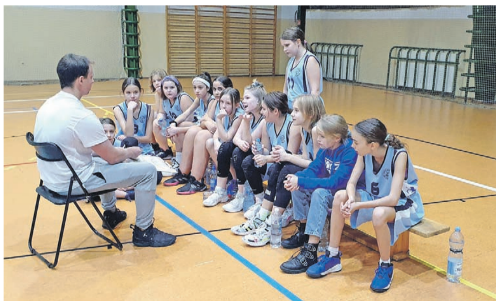
Łowiczanki w Łodzi z Widzewem nie miały szans na wygraną.

Koszykówka | Wojewódzka liga młodziczek U13