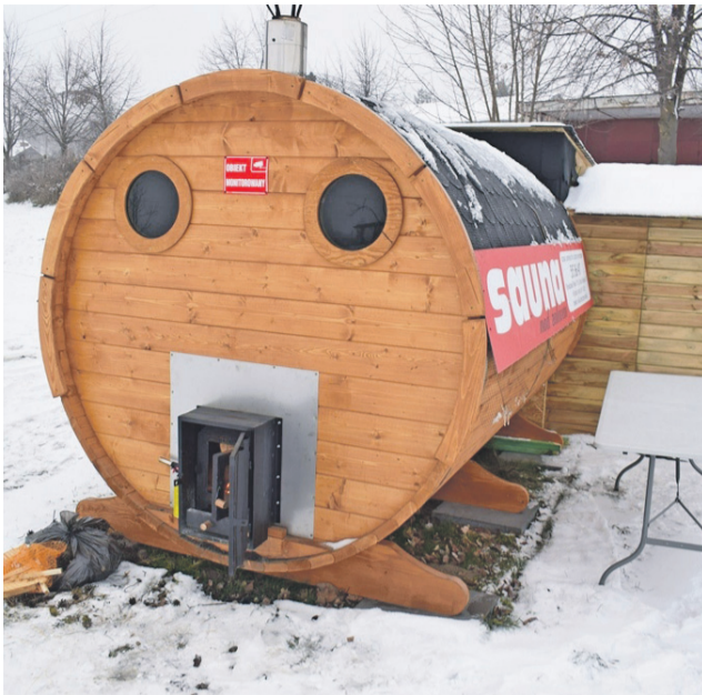
Sauna od zewnątrz. Widać mały piecyk na drewno, którym jest ogrzewana.

Korzystający to najczęściej ludzie ze Strykowa i okolic, a także Głowna czy Zgierza.