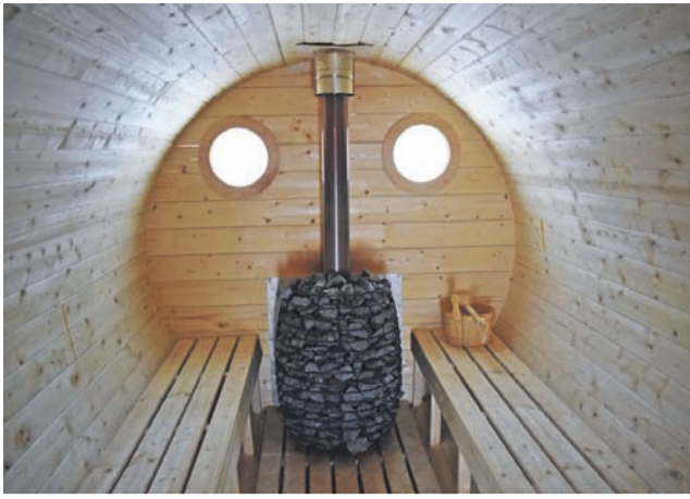
We wnętrzu sauny jest miejsce dla 6-8 osób.

korzystać kobiety w ciąży, natomiast w przypadku okresu, zależy od tego jak dana kobieta go znosi, a także od tego jakiej jest ona budowy ciała.