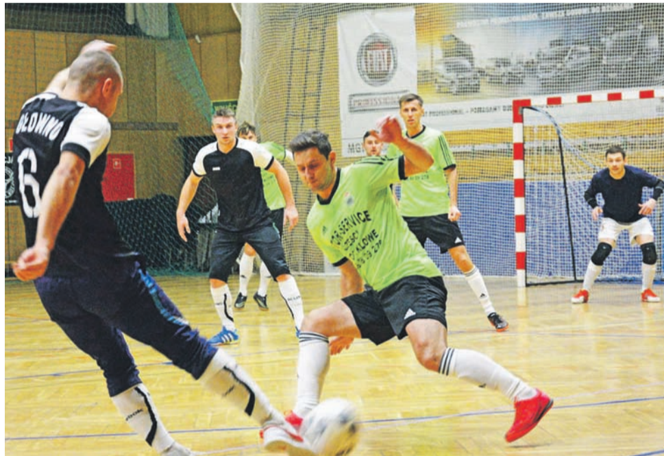
Drużyna Fantazji Głowno mimo małego dorobku punktowego pozostawia po sobie bardzo dobre wrażenie w KIA Open I Łowickiej Lidze Futsal.