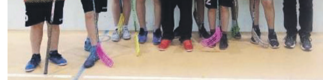
Srebrni medalistki Finału Wojewódzkiego – SP Bielawy.

– Jestem dumny z chłopaków. Wycisnęli na tych zawodach „maksę”. Zagraли rewelacyjnie. Widziałem, że w finale nie bę-