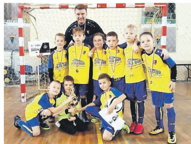
Młodzi strykowianie z ekipy Zjednoczonych wygrali wszystkie mecze i zwyciężyli w Turnieju rozgrywanym w Łodzi, zgarniając przy tym wspaniałe nagrody.

Z bardzo dobrej strony pokazali się też zawodnicy trenera Rafała