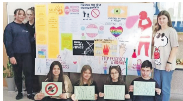
Gazetka szkolna utworzona w ramach kampanii „16 dni bez przemocy”.

formacyjno-edukacyjne broszury dotyczące przemocy fizycznej i psychicznej. W materiałach zostało wyjaśnione zjawisko agresji i przemocy, wskazano ich przejawy oraz szkodliwe skutki. Kolejnym etapem kampanii były spotkania na temat przemocy, które zostały przeprowadzone podczas lekcji wychowawczych. W czasie tych zajęć uczniowie mogli zapoznać się z dodatkowymi materiałami dydaktycznymi, podzielić się własnymi spostrzeżeniami oraz skorzystać z pomocy szkolnego psychologa.