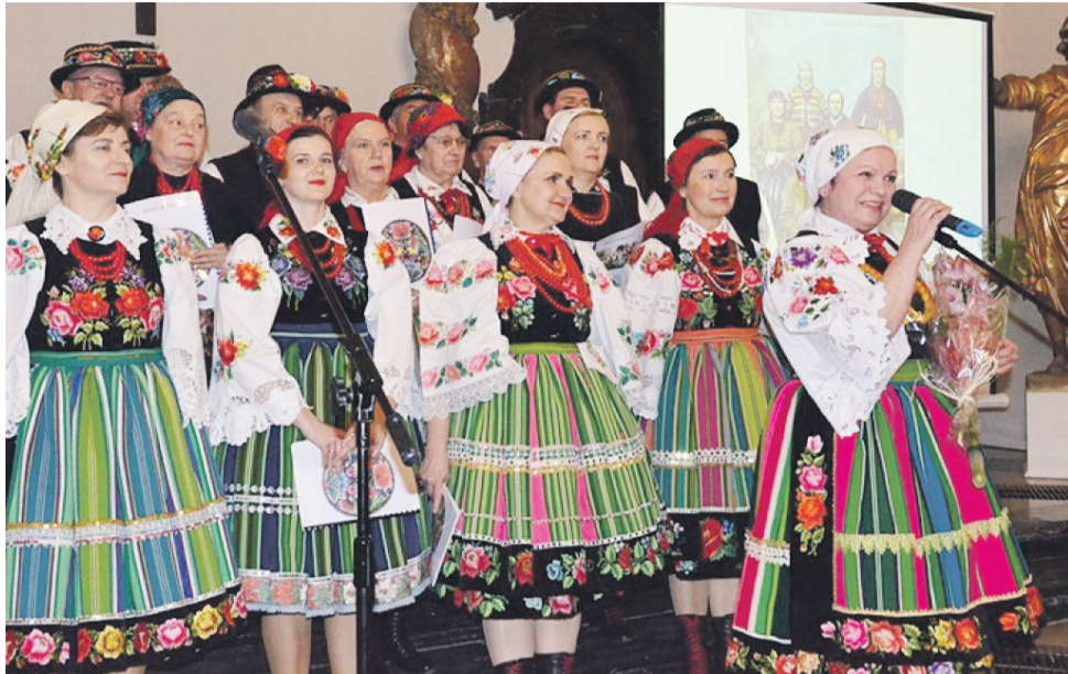
Występy Zespołu Śpiewaczego Ksiazoków zwykle przyciągają liczną publiczność.

Zespół Śpiewaczy Ksiazoków od dwóch miesięcy, na cotygodniowych próbach, przygotowuje się do wystawienia przedstawienia pt. „Wilio u Ksiazoków – według tradycji zapamiętanej”. Zaprasza na nie na środę 29 grudnia na godz. 17.00 do Łowickiego Ośrodka Kultury. Po przedstawieniu, które trwać będzie około godziny, zaplanowano kołędowanie z publicznością.