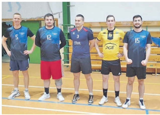
Pierwszym liderem ligi czwórek jest UKS Korabka I.

W pierwszych derbach wygrała Korabka I, ale mecz był bardzo wyrównany. Rozstrzygnięcie padło dopiero w tie-breaku, który zakończył się wynikiem 15:13 dla tych bardziej doświadczonych.