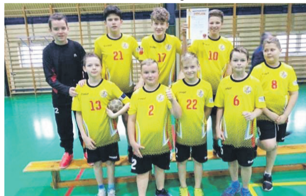
Uczniowie z SP Bielawy zajęli 3. miejsce w rejonie.

Uczniowie SP Bielawy wygrali pewnie zawody powiatowe i jechali na dalszy etap eliminacji do Rawy Mazowieckiej. Tu zajęli 3. miejsce. Na turniej do Rawy