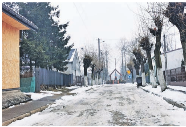
Plac Kazimierza w Głownie wymaga remontu.

– Czekamy na zrobienie tutaj drogi już może z 10 lat i nic, ile można? Dobrze, że chociaż są te kamienie to nie robi się błoto – mówi inny mieszkaniec.