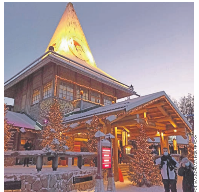
W tym urokliwym drewnianym budynku mieści się główne biuro Mikołaja.

Goście odwiedzający wioskę są zwykle w znakomitych nastrojach, pomimo pobudki w środ-