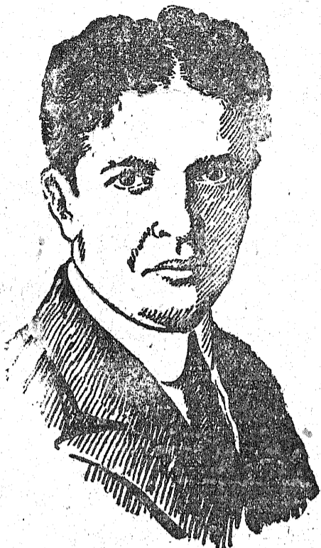
Duparnow, minister gabinetu Stambolijskiego, został w czasie transportowania go do Sofii zastrzelony w chwili, gdy usiłował uciec.

p. minister powołuje się na to, co już powiedział w komisji sejmowej. Należałoby dodać tylko, że stanowisko rządu angielskiego w sprawie kontroli wojskowej w Niemczech było w pewnej mierze podyktowane względami na położenie Polski.