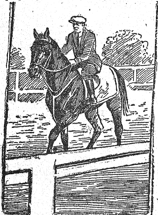
Koń Papyrus został sprzedany za cenę 5.000 funtów szterlingów do Ameryki.