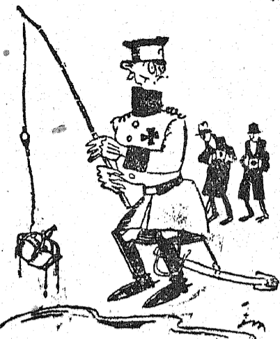
Kronprinz (do fotografów): — Oddałem się panowia! Ja podróżuję po Niemczech wyłącznie w celach osobistych, bez żadnych zamiarów politycznych.