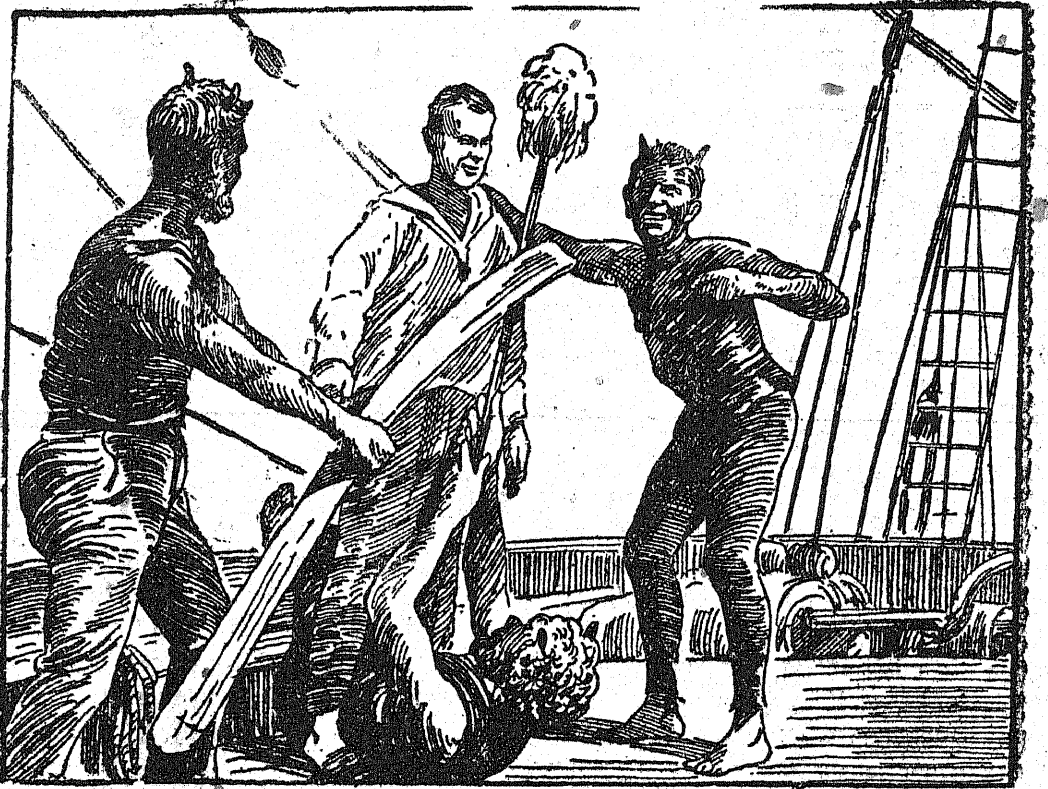
Ilustracja nasza przedstawia moment z podróży polskiego statku szkolnego „Lwów“, który po 107 dniach uciążliwej żeglugi przybył do Rio de Janeiro. Matryntaże, zaprawiający po raz pierwszy przez równik, podlegają tzw. „chrzestowi Neptuna“. Przez brzoziaki i „chłopy“ wlewa się nowoczysta woda i goła drewniana brzoziwa.