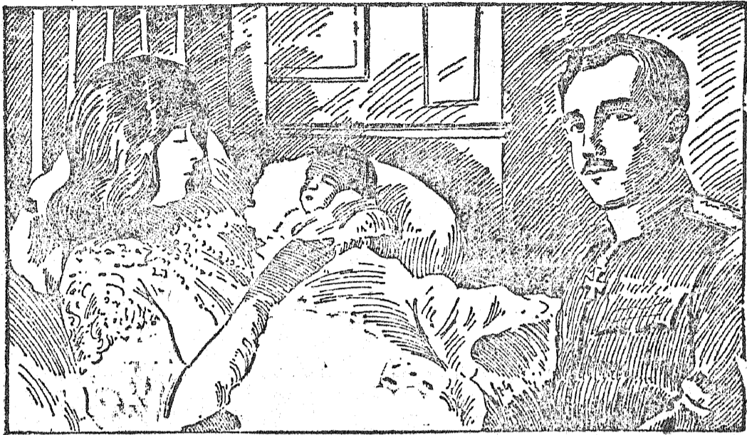
Ilustracja nasza przedstawia jugosłowiańską królową Maryę z następcą tronu, którego chrzcziny się niedawno z ogromnym uroczystym ceremoniałem.