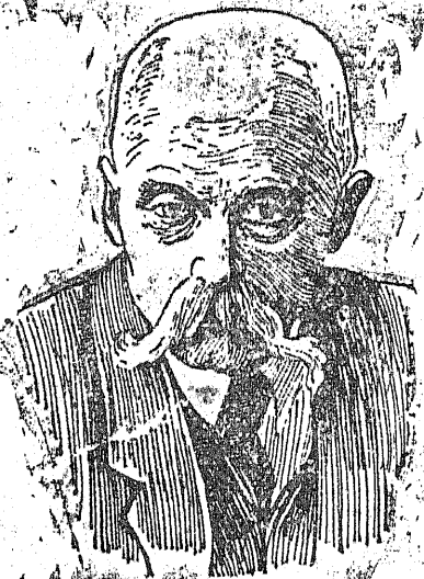
artysta-malarz, zmarły dnia 26 bm. w Krakowie