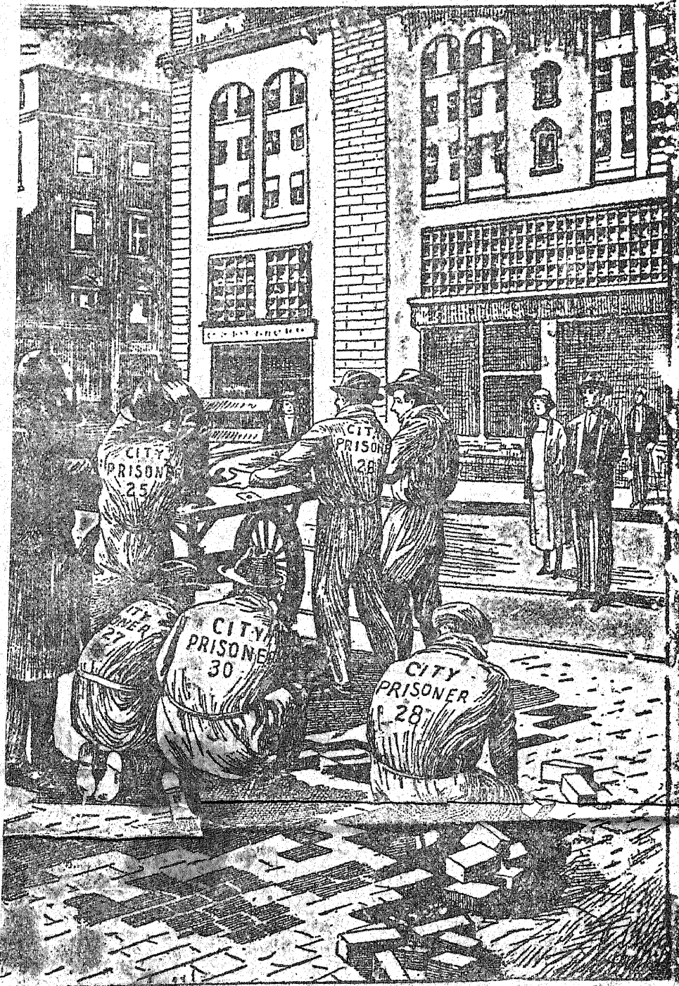
miejsowości River Rouge koło Detroit w Stanach Zjednoczonych — automobilści, którzy przez rybką jazdą spowodowali jakiś nieszczęśliwy wypadek — bywają skazywani na roboty przymusowe.