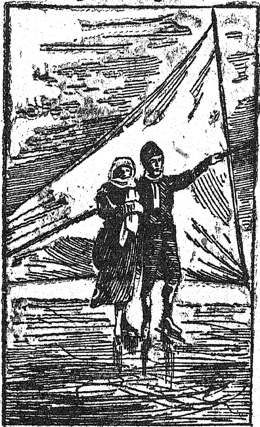
Sportsmeni amerykańscy wprowadzili obecnie do sportu łyżwiarstwa łyżwiarki, co zwłaszcza przy silniejszym wietrze przyspiesza szybkość jazdy. Ilustracja nasza przedstawia parę łyżwiarzy, którzy posuwają się na łyżwach po śniegu.