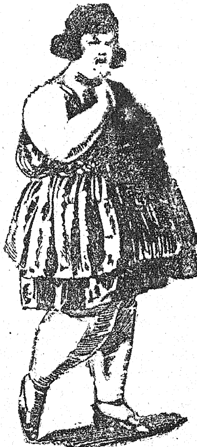
Fotografia powyższa przedstawia najcięższą i najcieńszą dziewczynę w Stanach Zjednoczonych. Osóbka ta panna Ewelina Takwood mieszkanka Darvill w stanie Utah waży 165 kłb.