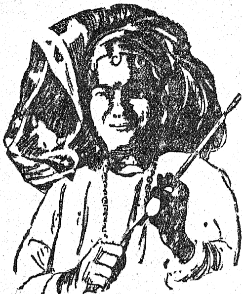
Wnieścienka ta dziewczę podziwiana była jako piękność na festynie w Timbuktu w Środkowej Afryce. Fotografie jej sporządził fotograf wyprawy, która wysłana przez „Chicago Tribune” przebyła Bahara.