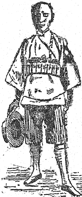
Ta oto niewiasta w wojowniczym stroju — stoi na ziele szajki bandytów chińskich i wzięła go za zwiastkiem generała Wong.

co do tego, to premier oświadczył, że rząd opuści swe stanowisko jedynie w następstwie powzięcia przez izbę uchwały wyrażającej brak zaufania.