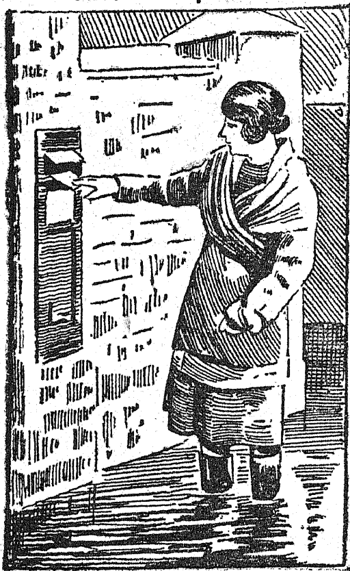
Obrazek z powodzi.

W Anglii, dotkniętej niedawno w niektórych okolicach klęską powodzi, pewne ulice znajdowały się pod wodą. Na ilustracji widzimy, jak pewna młoda Angielka chcąc wrzucić list do skrzynki, musiała przywdziać wysokie, nieprzemakalne buty do kolan i brnie odważnie przez wodę. Gdy tylko stopnieją śniegi w Łodzi, będziemy mieli z pewnością nieraz sposobność do obserwowania analogicznych scen.