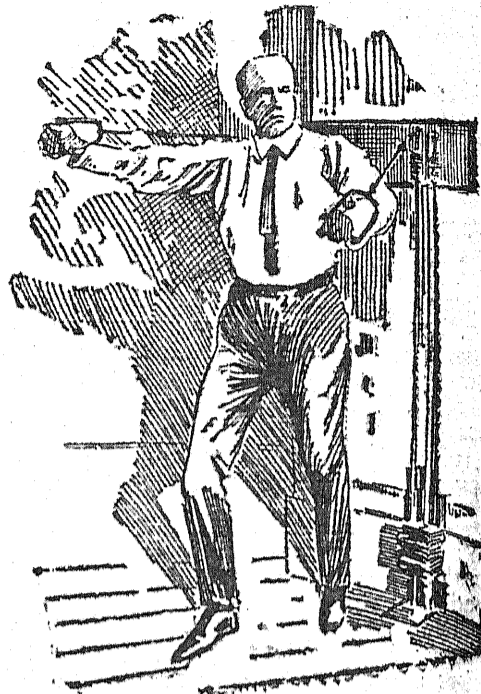
PREZIDENT STANÓW ZJEDN. Coolidge uprawia gimnastykę szwedzką.