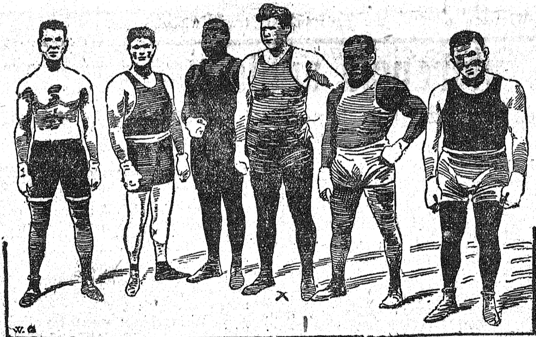
Na ilustracji naszej widzimy czarnych i białych bokserów Północnej Ameryki, którzy przed zaczęciem zapasów bokserskich dali się wspólnie fotografować, zaznaczając w ten sposób, że sport jest nie tylko międzynarodowy, ale i międzyrasowy.