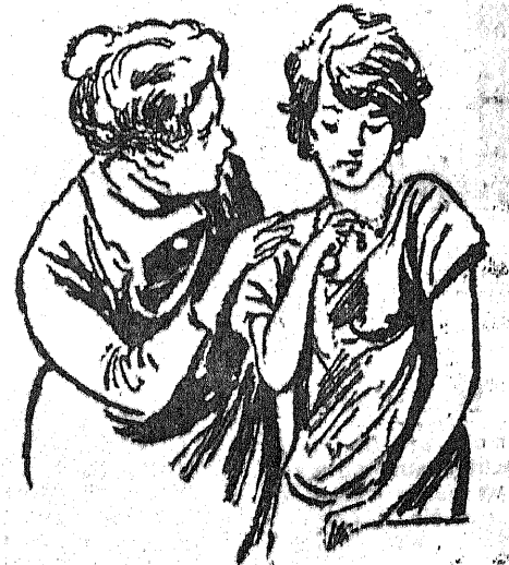
— Mówiasz, że cie kocha, więc dlaczego nie prosił twoją rękę? — On jest zbyt dumny, aby o cokolwiek prosił...