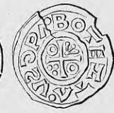
Nr. 28. Str. 36.