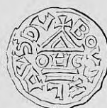
Nr. 31. Str. 38.