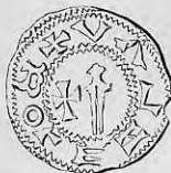
Nr. 5. Str. 21.