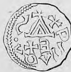
Nr. 1. Str. 17.