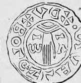
Nr. 26. Str. 35.