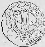
Nr. 3. Str. 20.