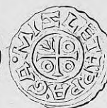
Nr. 33. Str. 39.