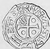
Nr. 17. Str. 30.