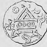
Nr. 7. Str. 22.