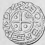
Nr. 9. Str. 25.