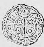
Nr. 12. Str. 27.