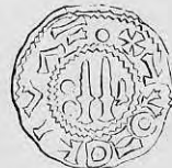
Nr. 2. Str. 18.