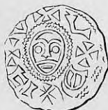
Nr. 19. Str. 31.