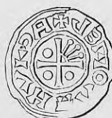
Nr. 27. Str. 36.