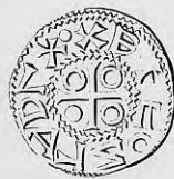
Nr. 11. Str. 26.