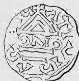
Nr. 13. Str. 28.