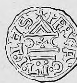
Nr. 38. Str. 41.