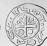
Nr. 34. Str. 39.