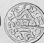
Nr. 32. Str. 39.