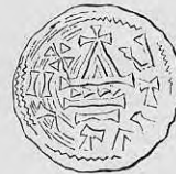
Nr. 6. Str. 21.