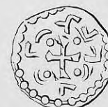
Nr. 40. Str. 43.