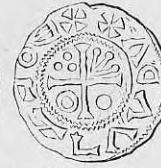
Nr. 23. Str. 33.