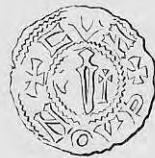
Nr. 4. Str. 20.