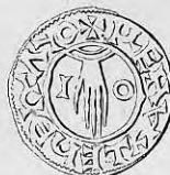
Nr. 15. Str. 29.