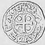
Nr. 10. Str. 25.