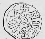
Nr. 36. Str. 40.