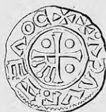
Nr. 14. Str. 29.