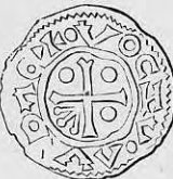
Nr. 16. Str. 29.