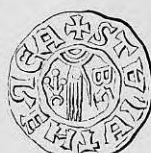
Nr. 35. Str. 40.