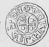
Nr. 29. Str. 37.