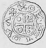
Nr. 22. Str. 33.