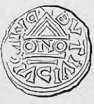
a. b. Nr. 18. Str. 30 i 31.