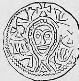
Nr. 20. Str. 32.