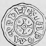
Nr. 39. Str. 41.