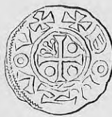
Nr. 21. Str. 32.