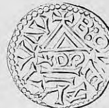
Nr. 8. Str. 23.