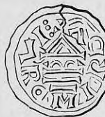
Nr. 37. Str. 41.