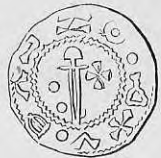
Nr. 25. Str. 34.