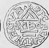
Nr. 30. Str. 38.