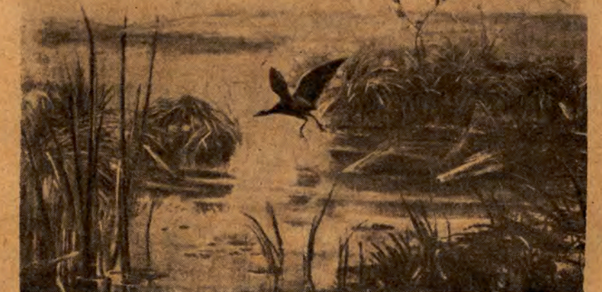
Wodne zarośla