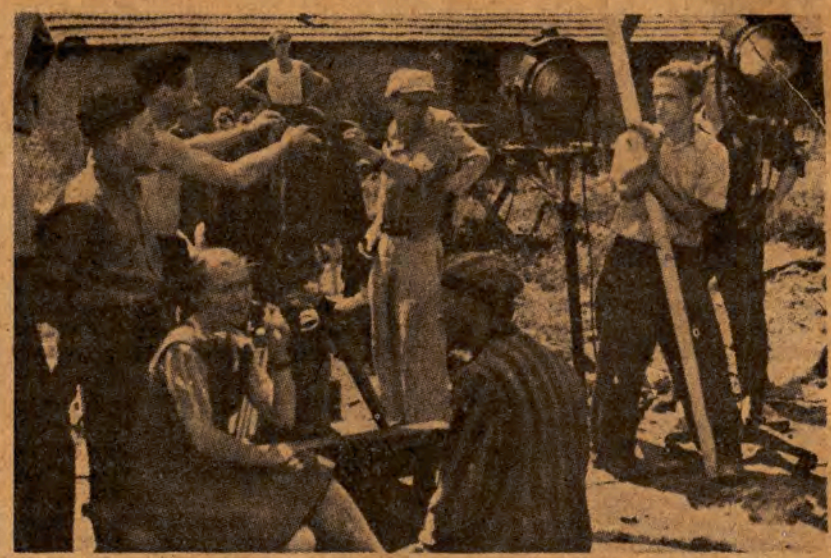
Fragment prac nad filmem „Ostatni Etap”

Z rozwojem radzieckiej dramaturgii filmowej, odzwierciedlającej nowe zagadnienia, zawierające idee nowego społeczeństwa radzieckiego, nasza sztuka filmowa stała się potężną bronią w walce z ideologią i sztuką burżazji. Jest rzeczą zupełnie naturalną, że reakcyjne wpływy formalistyczne w dziedzinie filmu przejawiały się przede wszystkim w negowaniu roli scenariusza”.