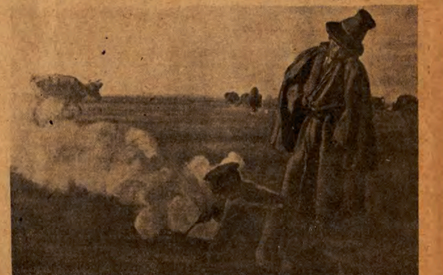
Na pastwisku