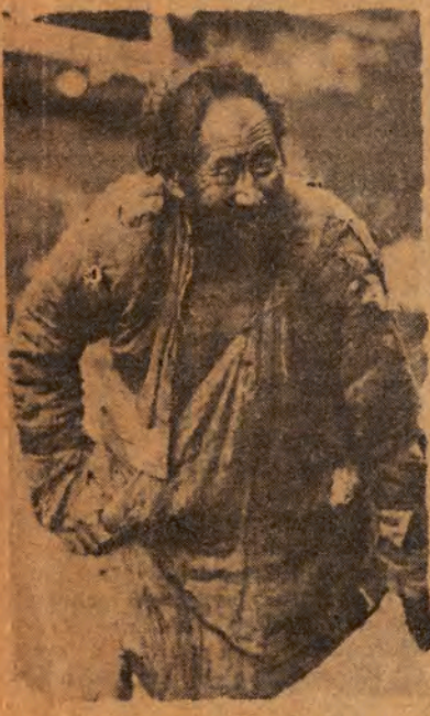
Charakterystyczny typ żebraka Chin kuomintangowskich