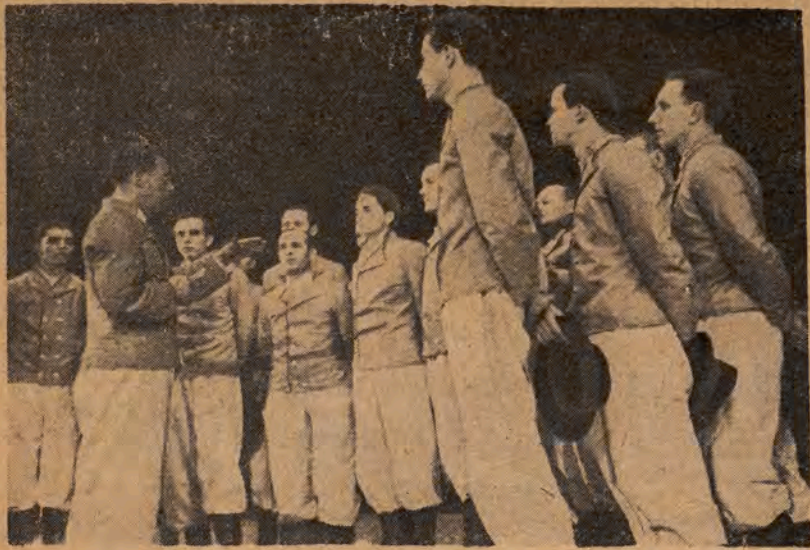
Z Festiwalu zespołów ludowych w Warszawie