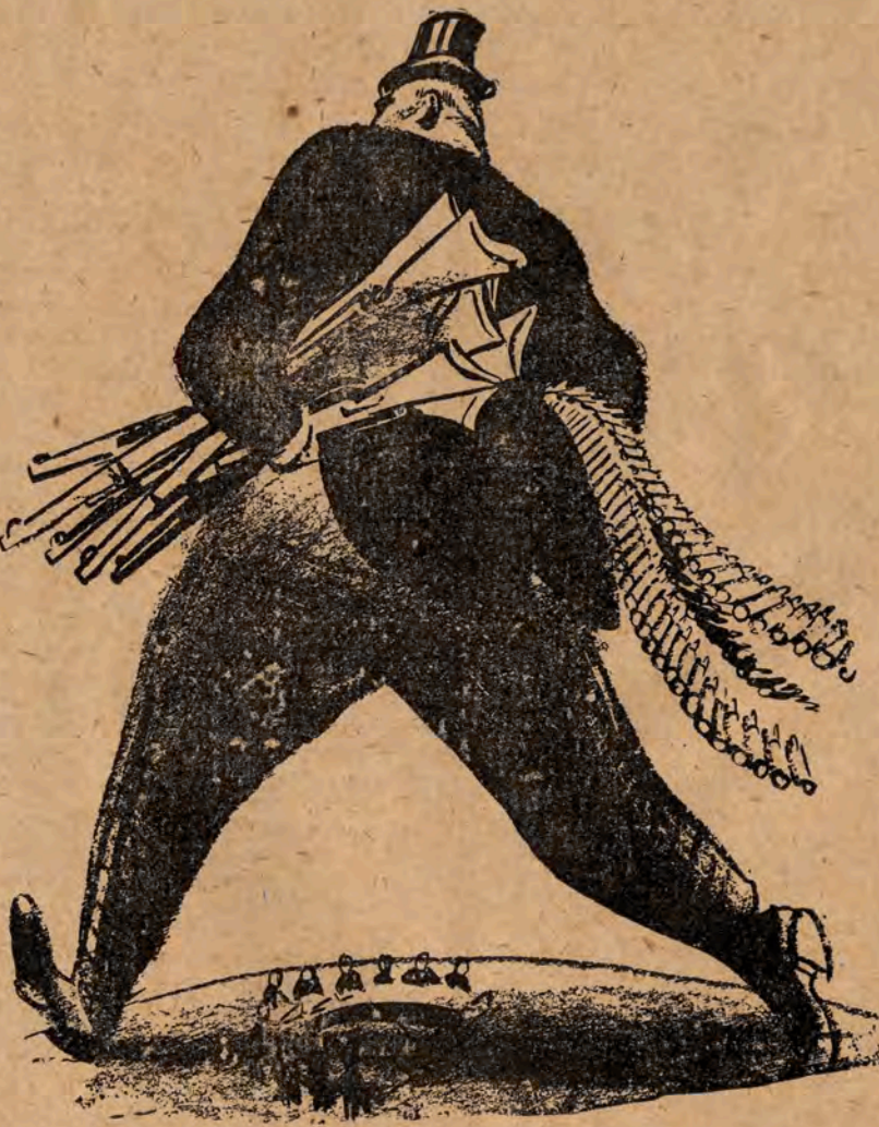
Z teki rysunków satyrycznych Wiliama Groppera

Redaktor naczelny - JAN ALEKSANDER KROL Redaguje Komitet, Adres Redakcji i Administracji: WARSZAWA, ul. Starynkiewicza Nr 7. Tel. Red. Nacz. 812-71. Tel. Redakcji 8-00-61 do 6, wewnętrzny 23 i 76. Wyd.: ZARZĄD GŁÓWNY ZWIĄZKU SAMOPOMOCY CHŁOPSKIEJ. REDAKCJA NIE ZAMÓWIANYCH REKOPISÓW NIE ZWRACA. Ogłoszenia przyjmuje Administracja - WARSZAWA Starynkiewicza 7. Warunki p renumerat y: miesięcznie 80,- zł; kwartalnie 240,- zł; półrocznie 480,- zł; rocznie 960,- zł. Należność za prenumeratę należy wplacać na konto PKO Warszawa I-6841 z zaznaczeniem „za tvę „Wies”. Drukarnia nr 2 Spółdz Wyd.-Ośw. „Czytelnik” Marszałkowska 3/5 B-95407