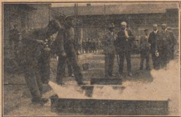
Próba użycia gaśnicy kwasowęglowej ręcznej.

wanie zużycia tego materiału jest tu łatwiejsze.