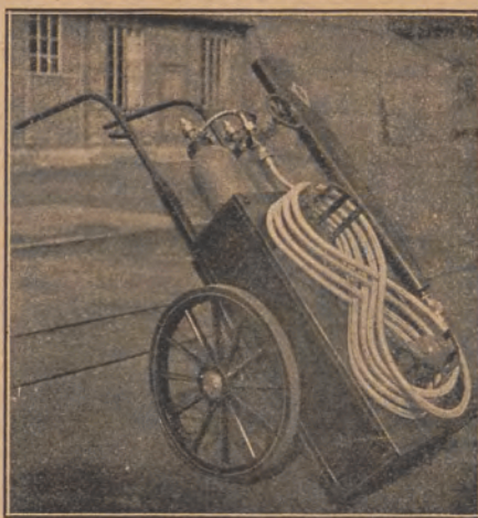
Gaśnica kwasowęgłowa „Polar-Total“ na wózku dwukołowym. Widzimy tu odpowiednią ilość węża łocznego, umożliwiającego manewrowanie specjalną prądownicą.

Próba V. Polegała znów ona na gaszeniu palącej się oliwy. Zbiornik napełniono całkowicie oliwą w ilości 250 klg., poczem doprowadzono oliwę do stanu wrzenia i w odpowiedniej chwili zapalono; pożar zaś ugaszono za pomocą samoczynnej gaśnicy