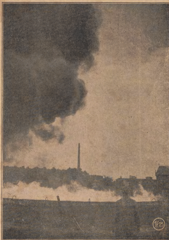
Próba samoczynnych gaśnic kwasowęglowych w Kölnie. Jak to widać na zamieszczonych ilustracjach do zbiorników z płynem łatwopalnym prowadzi linja węzowa, przechodząca przez aparat, który umieszczony jest w ścianie zbiornika i posiada od jego wnętrza tryskacz; ten topnieje z chwilą zapalenia się płynu w zbiorniku, wobec czego następuje samoczynne działanie tłumiące gaśnicy kwasowęgłowej. Na lewej ilustracji widzimy zbiornik w chwili zapalenia się płynu; prawa ilustracja uwiidoczni nam efekt działania samoczynnej gaśnicy w kilkanaście sekund po powstaniu pożaru.