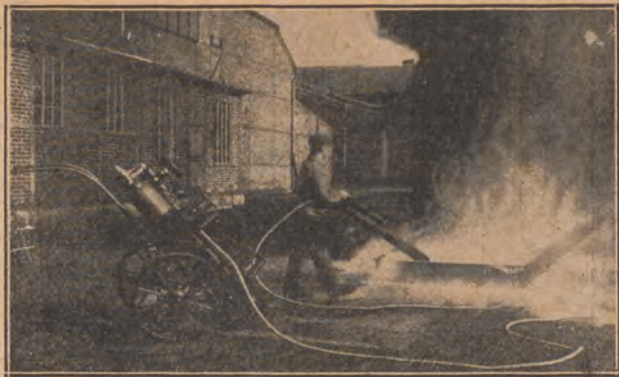
Próba użycia gaśnicy kwasowęglowej na wózku dwukółowym. Gaszenie naczyń z benzolem (w ilości 50 kg) trwało 6 sekund.