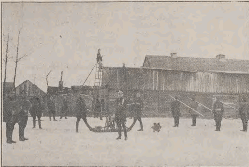
Ćwiczenia z narzędziami na egzaminie 8-dniowego kursu pożarniczego dla oficerów straży pożarnych pow. Sierpeckiego. Sierpce d. 30 stycznia 1927 r.

Wygłoszone zostaną fachowe referaty dotyczące pożarnictwa i służby strażackiej.