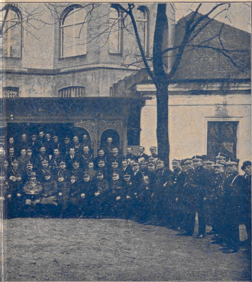
W Poznaniu w dniu 8-ym lutego r. b. i zgromadził 144-ch oficerów ze straży ochotniczych w woj. Poznańskim).

Redakcja otwiera rubrykę ofiar na cel wskazany w powyższej odezwie.