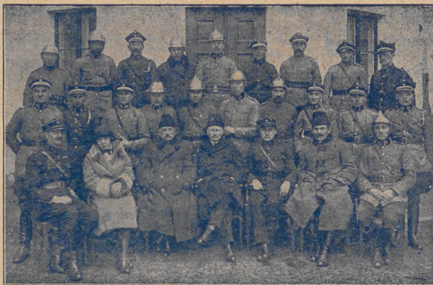
Kurs 8-dniowy w Skierniewicach (5. II—12. II—1927 r.). Ilustracja nasza przedstawia grupę uczestników oraz członków kom. egz. (siedzą).