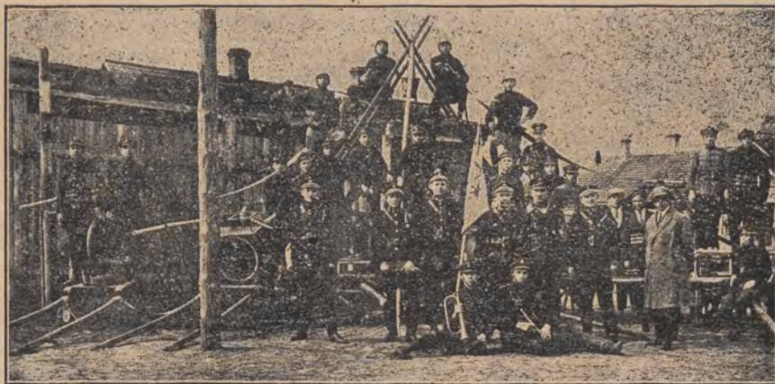
Członkowie Ochotniczej Straży Pożarnej w Jeziorach (pow. Grodzieński).

gmin, które zamierzają powołać na swoich terenach straże pożarne, delegatów oddziałów wojskowych i policyjnych. Ogół uczestników wykazał bardzo duży zaś obowiązkowość, wykazując się jednocześnie wielką łatwością ujmowania nawet trudniejszych zagadnień z techniki i organizacji pożarniczej. Szczegóły dotyczące tych kursów oraz fotografie zamieścimy niebawem w Przeglądzie.