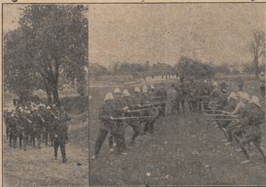
Ochotnicza Straż Pożarna w Opocznie (województwo Kieleckie) z zapalem uprawia ćwiczenia wojskowe. Nasze zdjęcia przedstawiają: szermierkę na bagnety oraz powrót z ćwiczeń.