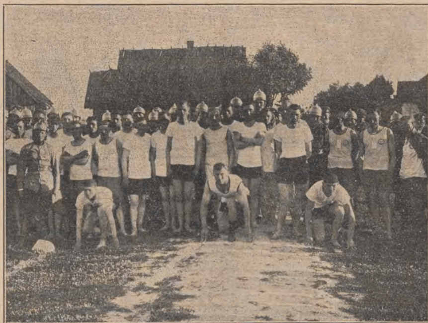
Start biegu na 400 mtr. w czasie zawodów w Gogolach (pow. Ciechanowski).

Kom. Olimp. zamierza przydzielić do obozu specjalnego kucharza, który zgodnie ze wskazówkami Komisji Lekarskiej zapewni racjonalność odżywiania z tem, że kucharz ten pojedzie później do Amsterdamu wraz z polską ekspedycją. Uczestnicy obozu korzystać będą z wszelkich niezbędnych dla zachowania odpowiedniego nastroju psychicznego, udogodnień, jak radio, czytelnia etc. Uczestnicy obozu zostali już wyznaczeni.